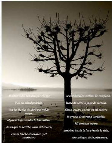
Magisteria Salesiana "Santiago el Mayor" Burgos, 28 mayo 2007 n.º 68