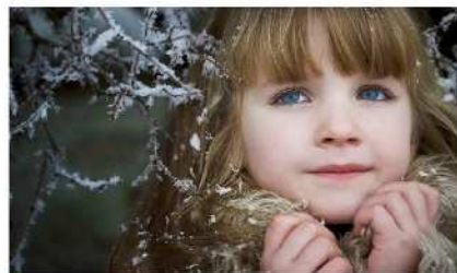
Magisteria Salesiana "Santiago el Mayor" Burgos, 24 nov 2007 n.º 65

La ley de enero es muy rigurosa, pero febrero ya es otra cosa.