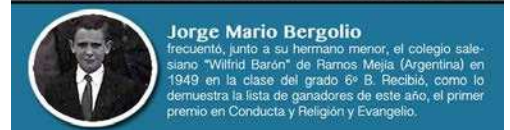
Jorge Mario Bergoglio

frecuentó, junto a su hermano menor, el colegio salesiano "Wilfrid Barón" de Ramos Mejía (Argentina) en 1949 en la clase del grado 8º B. Recibió, como lo demuestra la lista de ganadores de este año, el primer premio en Conducta y Religión y Evangelio.