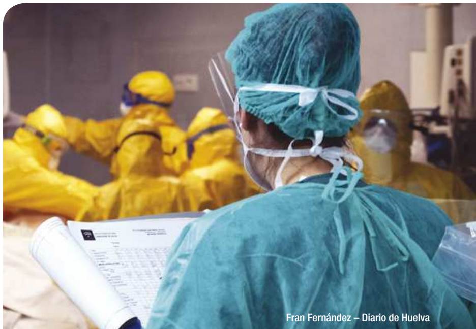
Fran Fernández – Diario de Huelva