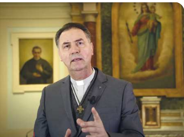
Don Ángel Fernández Artime, en este vídeo publicado en ANS, instaba a preguntarse: “¿Qué podemos hacer para seguir ayudando a quienes lo están pasando mal?”.

En este sentido, haciendo realidad la frase “tristeza y melancolía fuera de la casa mía”, pronunciada por Don Bosco, son numerosos los ejemplos de vídeos de motivación o mensajes de apoyo proporcionados desde las comunidades educativas. Peque-