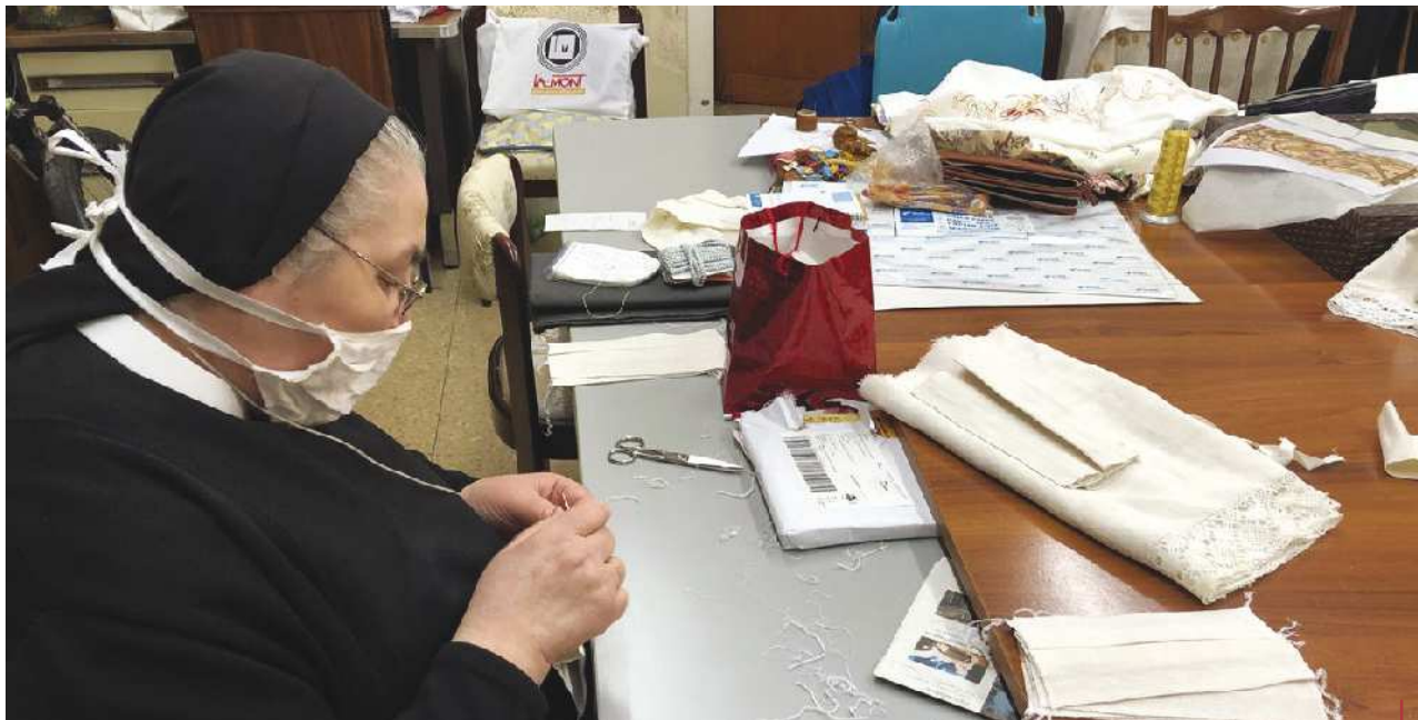
Las religiosas que atienden la parroquia de Santa Engracia (Zaragoza) confeccionando mascarillas. ↓