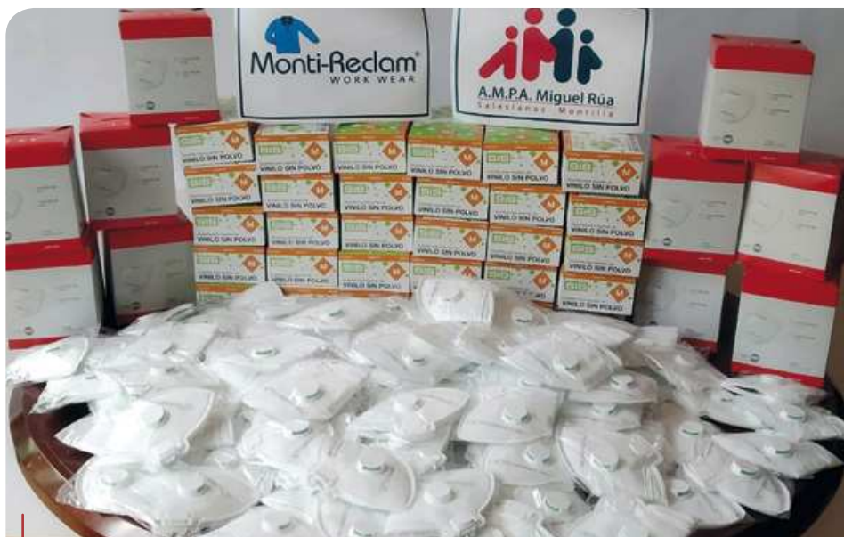
Grande está siendo la solidaridad salesiana. A través de la ayuda económica se está comprando material sanitario para repartir en hospitales o residencias de ancianos.

Las comunidades educativas, gracias a la excelente labor e implicación de los docentes, continúan impartiendo sus clases a distancia a través de plataformas digitales o recursos educativos, como los proporcionados por la editorial Edebé, u ofreciendo materiales pastorales como los tradicionales “Buenos días” con miles de descargas en las web de Huesca, La Almunia, Guadalajara, Villamuriel, Alcoy o Sant Vicenç dels Horts. “Incluso se ha realizado un acompañamiento intensivo de formaciones prácticas como la de soldadura en Puertollano o con los simulacros de selectividad para los alumnos de Córdoba”, comparten desde Escuelas Salesianas. Igualmente destacable la labor de los departamentos de Orientación con la elaboración de diferentes recomendaciones académicas para afrontar el estudio, cuidar las rutinas diarias en el confinamiento, fomentar la buena salud o mejorar el descanso. Dentro de esta atención virtual también se celebran nuevas iniciativas, como las “Puertas abiertas” en las que centros como Paseo de Extremadura presentaron las instalaciones online y la sección de Infantil a las familias interesadas.