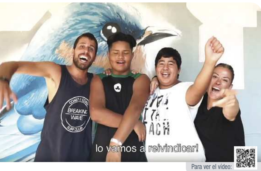
Para ver el vídeo: