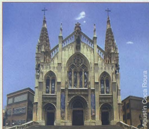
Agustín Coca Roura