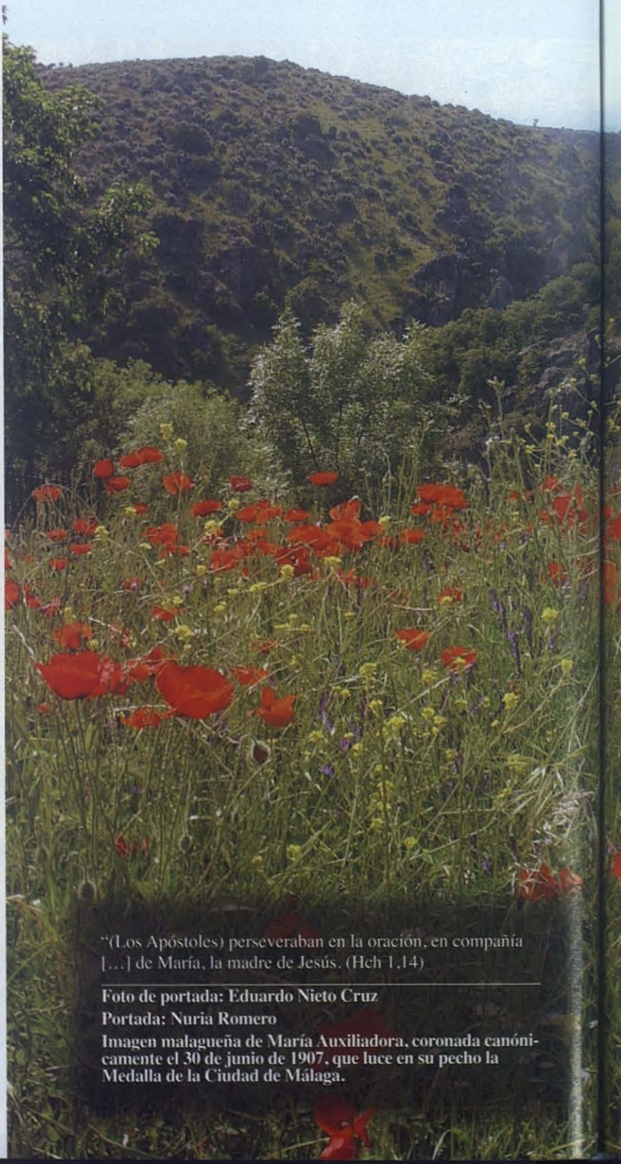
Imagen malagueña de María Auxiliadora, coronada canónicamente el 30 de junio de 1907, que luce en su pecho la Medalla de la Ciudad de Málaga.