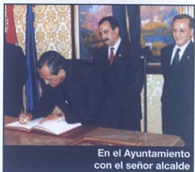
En el Ayuntamiento con el señor alcalde