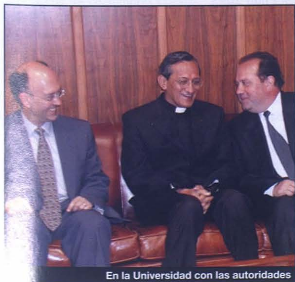
En la Universidad con las autoridades