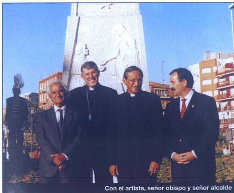
Con el artista, señor obispo y señor alcalde