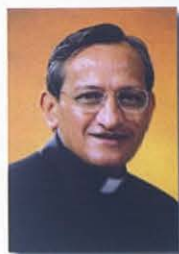
Don Pascual Chávez Rector Mayor

A propósito de la XVII Jornada Mundial de la Juventud (Toronto, 18-28 julio 2002)