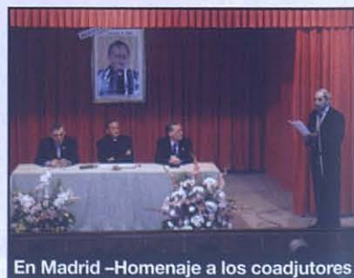
En Madrid -Homenaje a los coadjutores

toda la mañana. Y escucharon con agrado lo que don Pascual comentó sobre su nuevo servicio de Rector Mayor: "No me pesan los más de 17.000 salesianos, no los llevo a la espalda, los llevo en el corazón". Ellas notaron que estaban también muy en el corazón del Rector Mayor, sucesor "no de Don Vecchi sino 9º sucesor de Don Bosco".