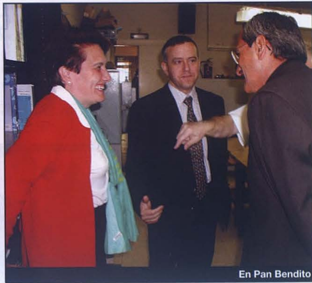
En Pan Bendito

tiano es el Dios que se manifiesta amando en la Cruz y así se presenta al hombre. Animó a los miembros de la Familia Salesiana a ser imágenes de este Dios amor.