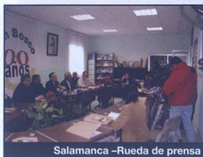
Salamanca -Rueda de prensa