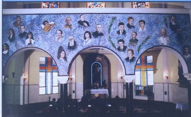
Los trabajos de ornamentación de la Iglesia de San Juan Bosco de Panamá continúan. Destacan los murales realizados en Roma, que ya están colocados. (Francisco Ballesteros)