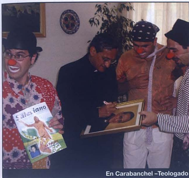
En Carabanchel -Teologado