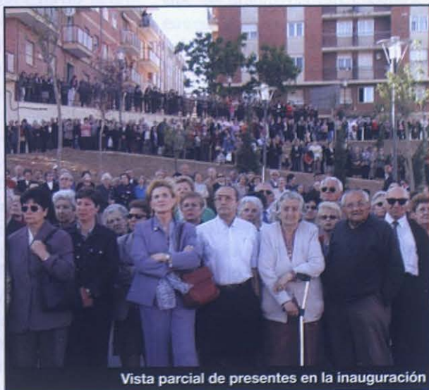
Vista parcial de presentes en la inauguración