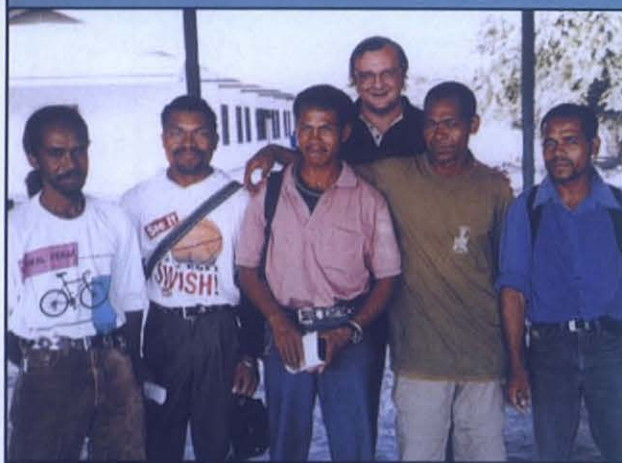
Grupo de exguerrilleros de Timor con el salesiano español Calleja

Centenares de fieles han participado, el domingo por la mañana, en una Misa celebrada en su casa por el obispo salesiano de Dili, premio Nobel de la Paz, Carlos Felipe Ximenes Belo . Su casa ha sido reconstruida recientemente después de haber sido