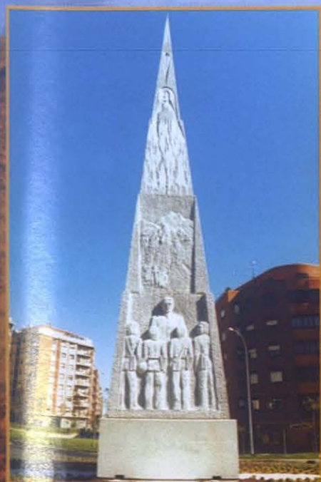
■ Obelisco a Don Bosco