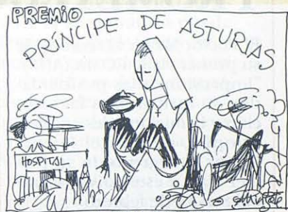
MINGOTE (DIARIO ABC 26-4-94)

Salesianas evacuadas de Ruanda, en la Casa Provincial de Madrid.