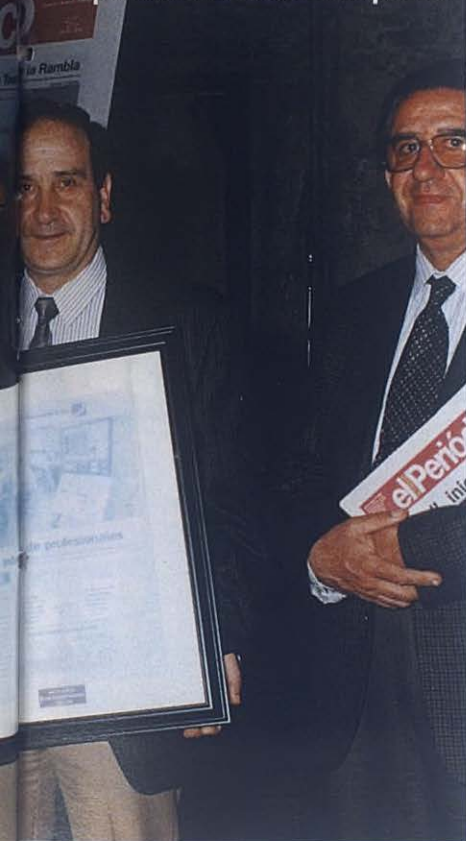
El Presidente de la Generalitat felicitando al Director Pedagógico y a los Jefes del Departamento de Electrónica.