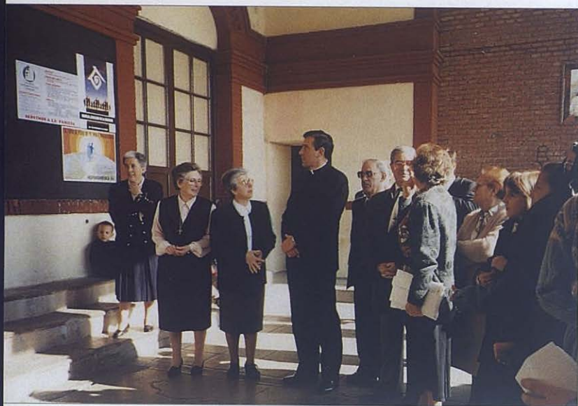
Dehesa de la villa: en las Bodas de Oro del Colegio