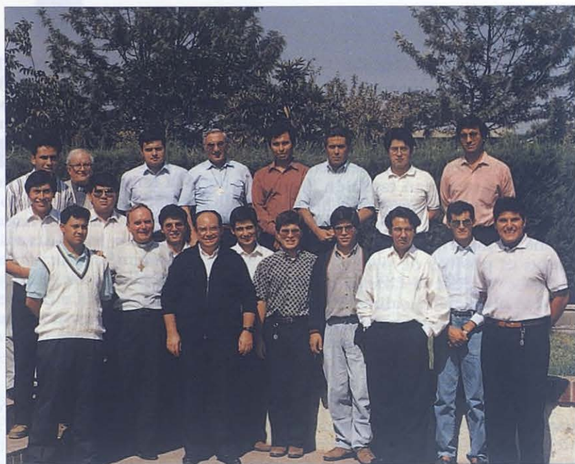
■ Grupo de los novicios de Chile, que dan las gracias por los donativos que les llegaron de España.

gos, formulación del interrogatorio para el proceso... Después la postulación pedirá formalmente al obispo que incoe la causa.