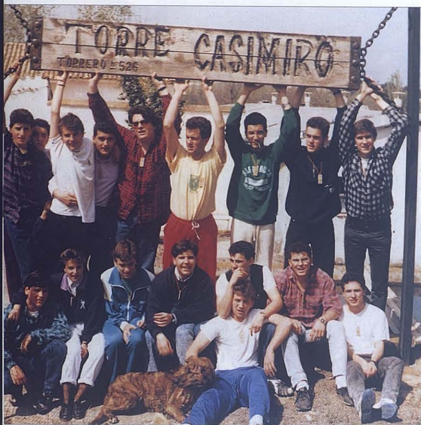
Convivencia de monitores en 1989.

de Lona " (así se ha llamado siempre nuestro campamento) se vistió de gala. En ella tuvo lugar durante dos días el encuentro de todos los monitores que a lo largo de estos 25 años han ido construyendo y asentando el Grupo Juvenil Exploradores Don Bosco. El actual equipo de monitores pudieron así agradecer a quienes fueron los protagonistas en su educación, todo lo recibido, semilla de lo que hoy se entrega de nuevo.