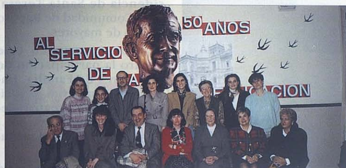
■ Salesianas y profesores de la casa Dehesa de la Villa, que cumple los 50 años.