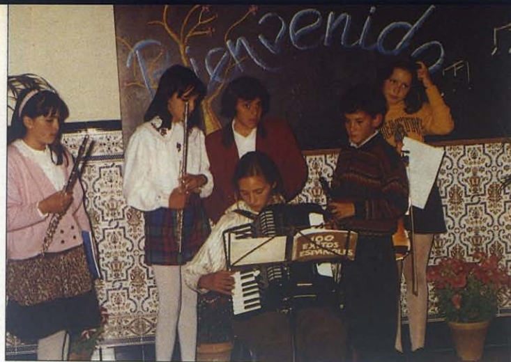
Los chicos de Sevilla dan la bienvenida al Rector Mayor al son de instrumentos.

Casi doscientos Cooperadores Salesianos escucharon de «Don Bosco hoy» palabras certeras sobre las relaciones de los laicos con la vida consagrada: «Estamos en los inicios de una nueva época