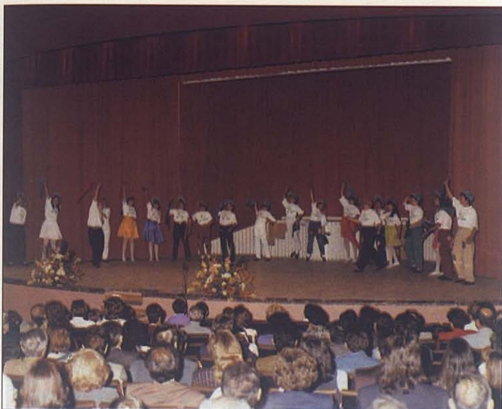
Escena de Lo he visto en sueños o Viva Don Bosco amigo , musical con que se estrenó el Salón de Actos.