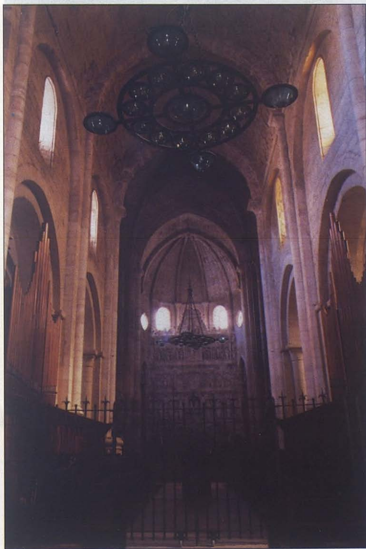
Nave central de la Basílica de Poblet con la lámpara y con las rejas de Martí.

—Hubo que partir de la nada, porque no quedaba ningún vestigio de hierro o plomo en las paredes. Sobre la marcha, íbamos improvisando, adaptándonos a las formas