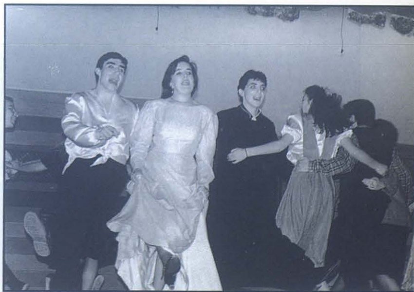
El fotógrafo ha sorprendido a los actores del grupo «El Hormigón» en una de sus representaciones de El diluvio que viene .