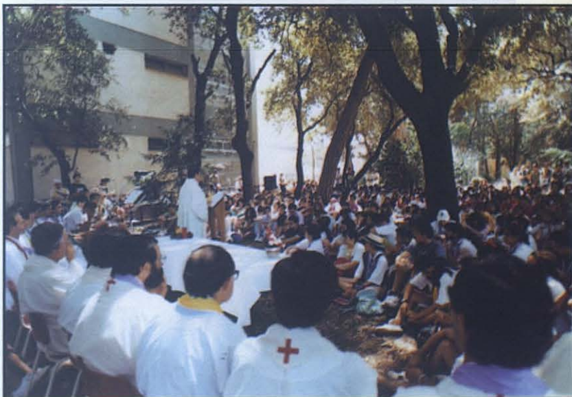
Dos momentos del Campobosco '91 en dos celebraciones de la Eucaristía.