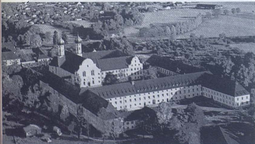
Vista general del Estudiantado Salesiano de Benediktbeuern.