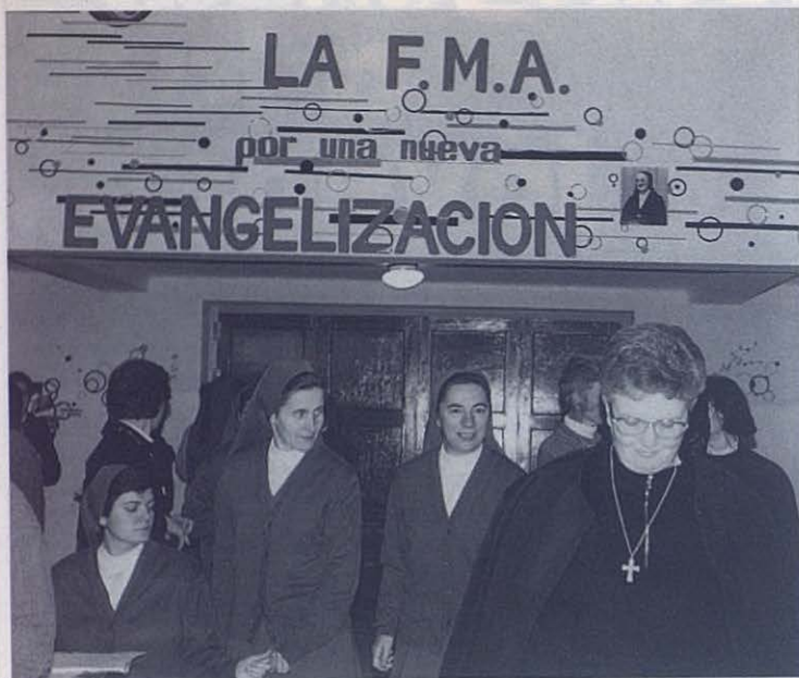
«Hay que hacer todos los esfuerzos posibles con vistas a una generosa evangelización de la cultura.»

preensión y su comunicación... La participación de la mujer en la vida de la Iglesia y de la sociedad, mediante sus particulares dones, constituye simultáneamente el camino imprescindible para su realización personal, en la que tanto y con razón se insiste hoy día, y la aportación original de la mujer al enriquecimiento de la comunión eclesial y al dinamismo apostólico del pueblo de Dios (cfr. CL, 51).