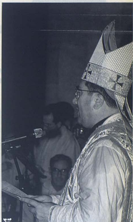
Don Miguel pronuncia su discurso programático «en clave mariana».