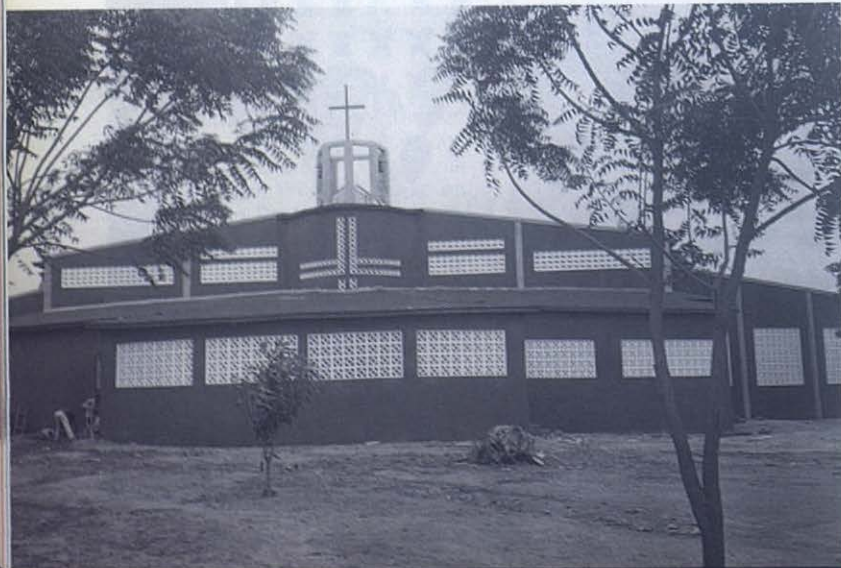
Vista posterior del nuevo templo de Parakou.