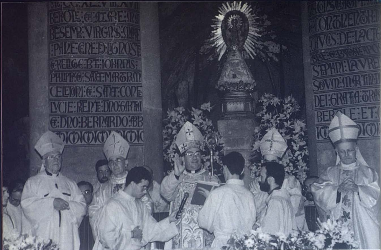
Al final de la Eucaristía, el obispo impartió la bendición bajo la mirada de Nuestra Señora de Veruela.

Preciosas fueron las palabras del Nuncio cuando habló del nuevo obispo salesiano: «Los Salesianos —dijo— viven con pasión los problemas de los jóvenes y están entregados a ellos en cuerpo y alma. Es otro de los signos de la aportación del nuevo obispo a la Jerarquía de la Iglesia española, y, en particular, a la Iglesia de Tarazona.»