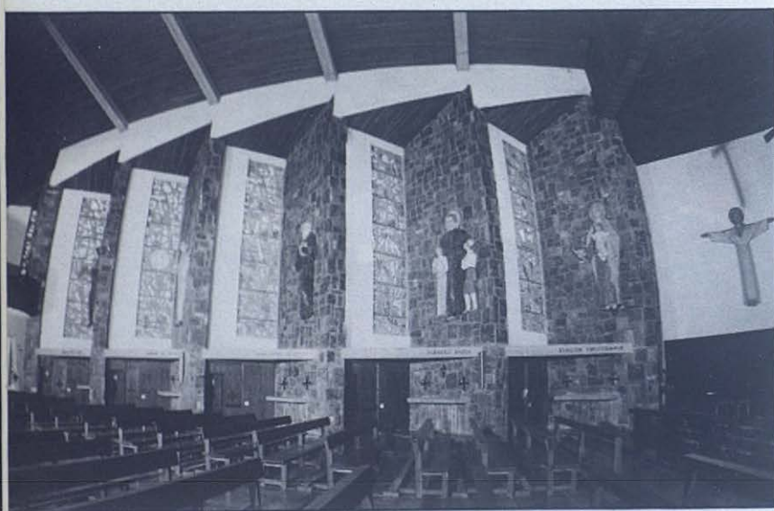
Urnieta: Vista interior de la capilla, parte lateral izquierda.