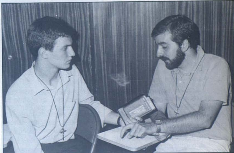
El periodista habla con el médico de la expedición.