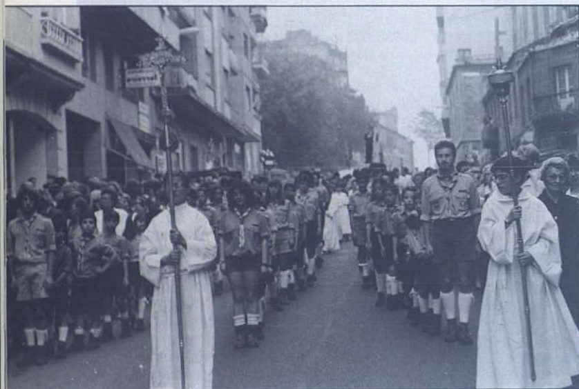
Vigo: Orden y fervor en la procesión popular.