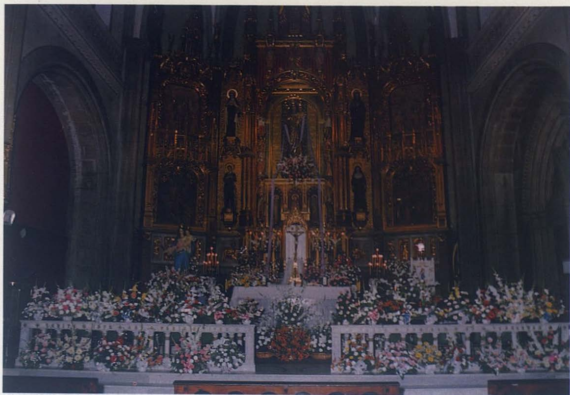
Vigo: El pueblo inunda de flores el altar de la Virgen Auxiliadora.