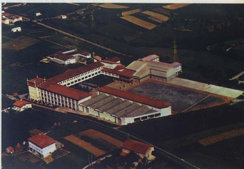
Urnieta: Vista aérea de las Escuelas Profesionales Salesianas, fachada oeste.

Años de trabajo acelerado: Muerta la familia de fundadores —entre el 19 de junio de 1963 y el 30 de septiembre de 1965—, pasaron sus bienes a la Inspectoría, administrados por el padre Beobide. Las obras