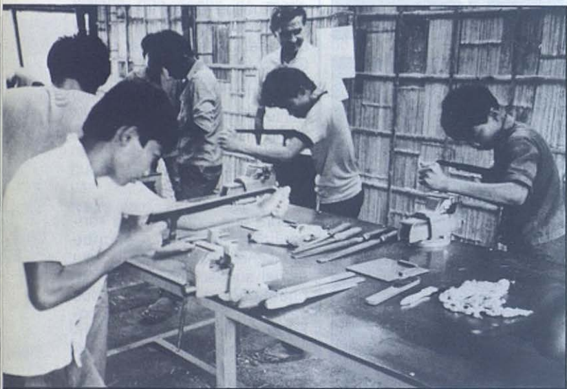
Thailandia: Campo de prófugos camboyanos. Los Salesianos trabajan con jóvenes aprendices.

Érase una vez una pequeña ciudad llamada Raniganj, con oficina de correos con el nombre de Maryganj... «Rani» es un nombre de mujer muy común en la India y significa «Reina»; Mary es María en inglés, y «ganj» corresponde a «ciudad, sitio o centro». Combinando las palabras