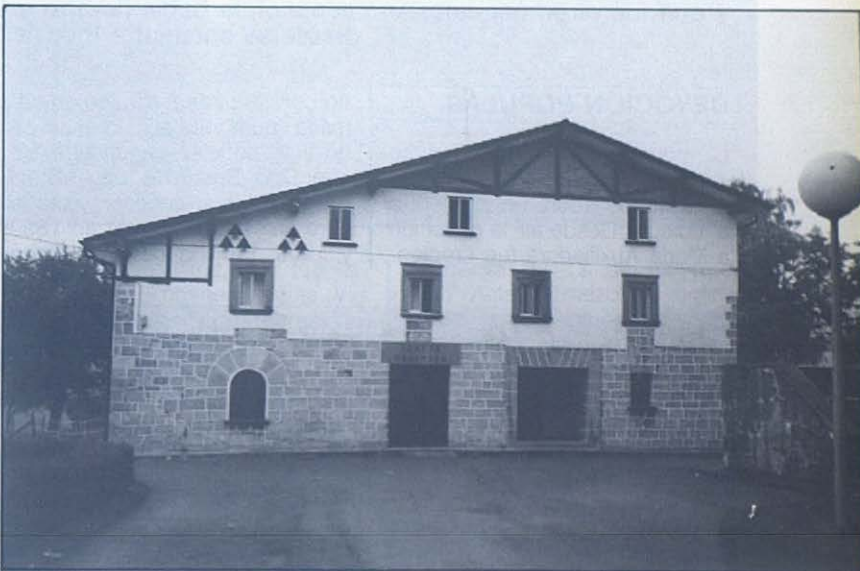
Salesianos de Urnieta, fachada del caserío Elketá.

A la entrada de la casa, una hermosa cristalería: representa a Don Bosco rodeado de muchachos vestidos a usanza de esta tierra y la Señora de sus sueños señalándole la misión mientras le apunta con su índice una maqueta del colegio. A su lado,