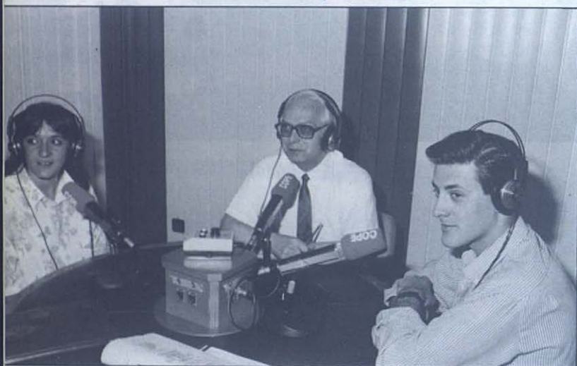
El director de la COPE recibió a dos voluntarios de Madreselva para lanzar a las ondas la explicación de su proyecto.

• Cinco personas para trabajar en hogares de niños: dos licenciadas en Psicología; una profesora de EGB; una estudiante de cuarto curso de Psicología de la Universidad Complutense y una estudiante de Farmacia.