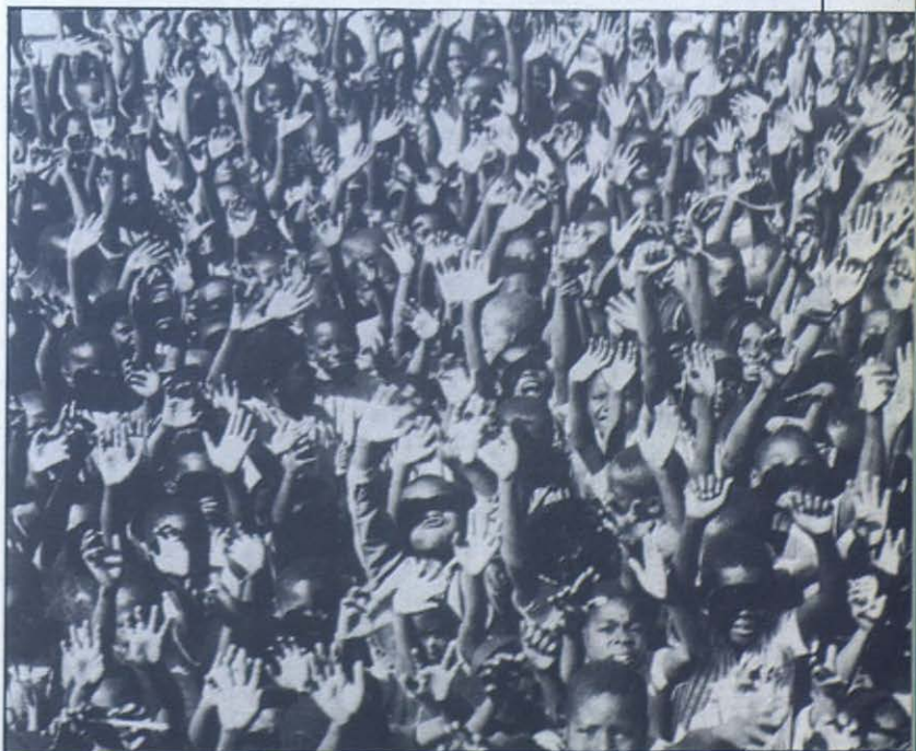
Frontera de Africa: Los jóvenes nos esperan con las manos abiertas.