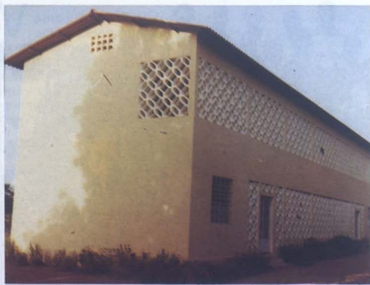
■ Tambacounda (Senegal): Esta es la residencia de los misioneros.

El mismo día de la fiesta de Don Bosco se organizó por la mañana una ginkana por equipos y con participación de todos los alumnos del centro.