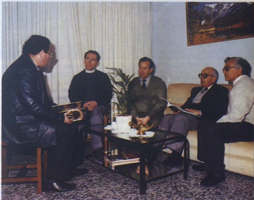
El equipo conversa con un visitante.