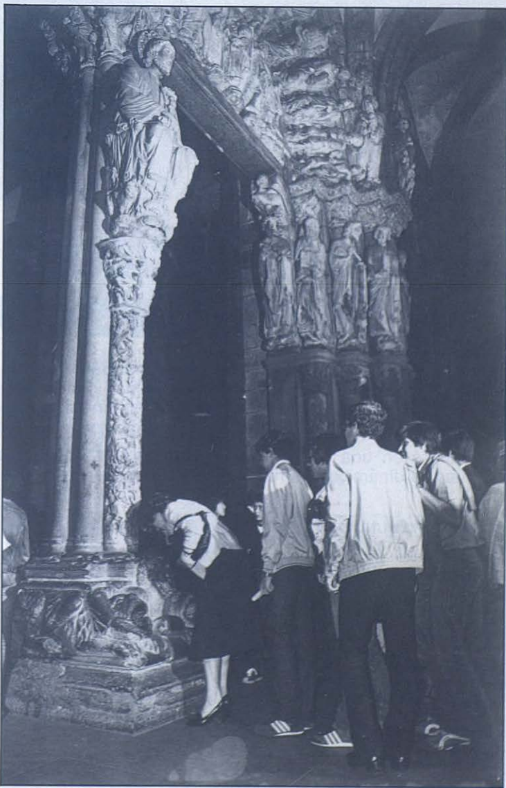
Y el coscorrón, como debe ser.

La cita del 19-20 de agosto será, pues, una ocasión extraordinaria, para cada uno en particular y aún más para todos los jóvenes juntos, de construir un momento fuerte de comunión en la Iglesia universal. De ahí la calurosa invitación que, al final de su mensaje, dirige Juan Pablo II a todos y a cada uno de los jóvenes, que se comprometan en todo el proceso de preparación espiritual que les exige el gran acontecimiento: «Caminad en el amor... Caminad como hijos de la luz.» ■