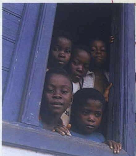
Los niños siempre esperan a alguien que los atienda.

Asistieron 28 educadores. El acto consistió en subrayar las ideas-clave de la carta. A continuación hubo tiempo para las posibles preguntas: «¿Quién era