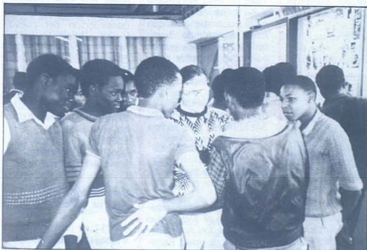
Nairobi (Kenia): Jóvenes aprendices de Karen, la Ciudad de los Muchachos de Don Bosco.

★ El cardenal Mauricio Otunga, arzobispo de Nairobi (Kenia), confió a los Salesianos la Ciudad de los Muchachos, que bendijo el pasado 31 de enero. El centro educativo consta de talleres de artes y oficios y residencia de los jóvenes, que este año serán unos trescientos.