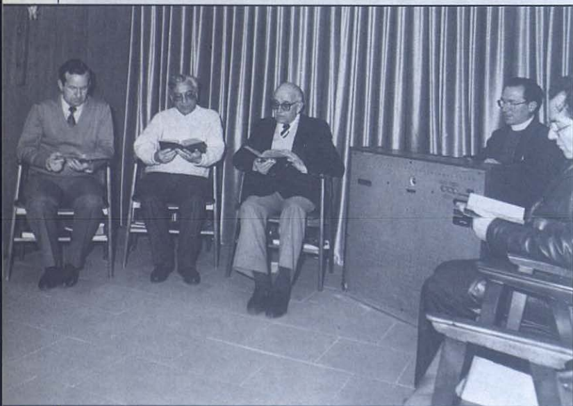
El equipo de Pastoral, en oración.

la reunión de los Delegados inspectoriales de pastoral juvenil constituye la «Delegación Nacional». Por su parte, existen las «Comisiones nacionales» de cada dimensión y ambiente, constituidas por los respectivos representantes inspectoriales, que eligen de entre ellos un coordinador nacional de su ambiente/dimensión. La reunión de todos estos equipos nacionales de dimensiones y ambientes, juntamente con la Delegación Nacional de P.J. constituye el «Consejo Nacional de Pastoral Juvenil», que se reúne anualmente