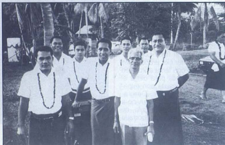
■ Apia (Samoa occidental): Grupo de catequistas.