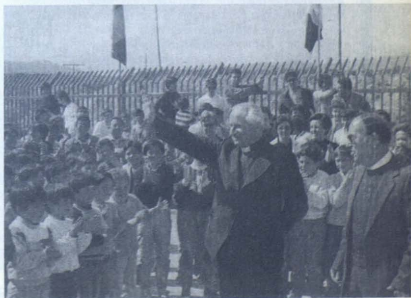
Diversos momentos del acto de la inauguración del monumento por el Rector Mayor.