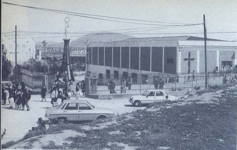
ALCOY: Vista del colegio Juan XXIII y el nuevo monumento a María Auxiliadora.