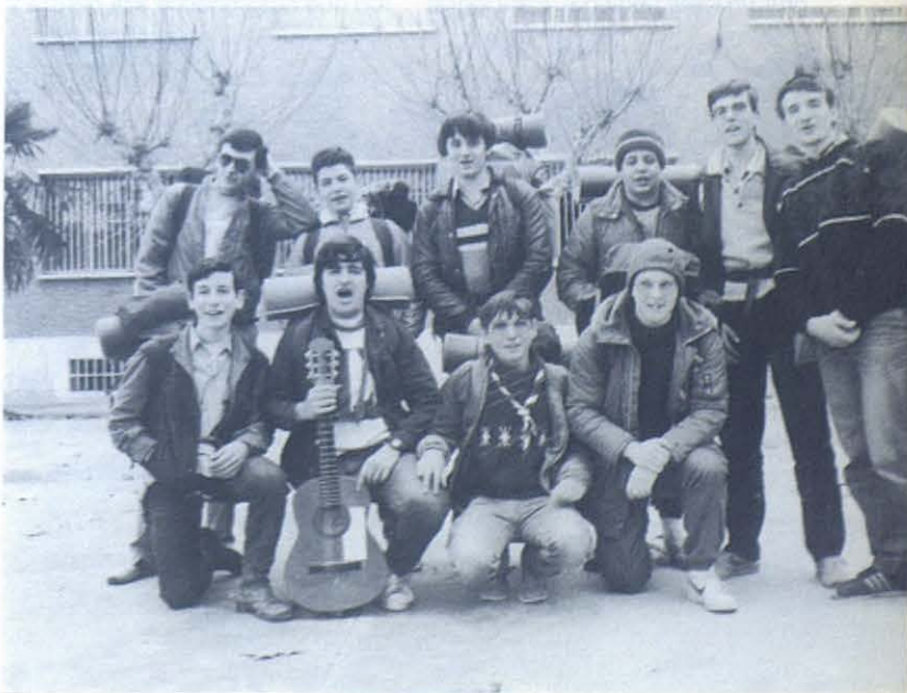
Antes de salir de excursión, una foto a las puertas del Colegio.

Estamos descubriendo nuestra propia libertad. Esto nos compromete a vivir una vida intensa y