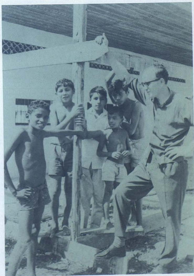
Fieles al carisma de don Bosco, los Salesianos han puesto en marcha formas originales de asistencia a los jóvenes marginados.

Refiriéndose después a una significativa experiencia de la provincia salesiana de Belo Horizonte, que ha hecho propia la iniciativa de los «Vigilantes mirins», el documento final del seminario invita a todas las obras más estructuradas de Iberoamérica (colegios y parroquias) a renovarse en profundidad, y a abrirse con generosidad y originalidad a las nuevas demandas de los jóvenes pobres.