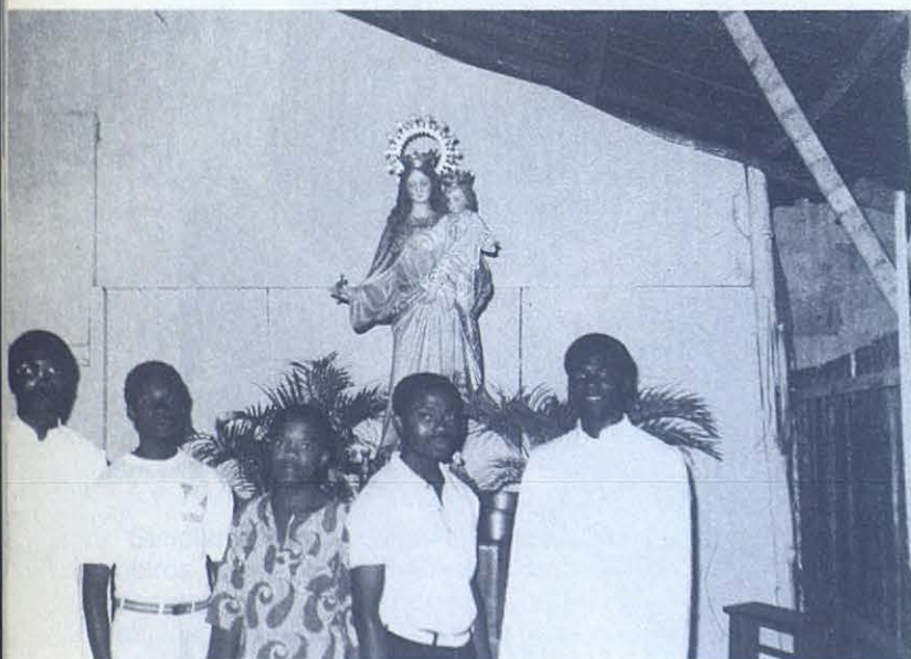
Un momento de la misa del día 25 en Akodessewa. En primer término aparecen los catecúmenos que recibieron el bautismo y la primera comunión.

El día 25 fue el día de la fiesta propiamente. La Eucaristía fue en el mismo sitio, en Akodessewa, muchos de los fieles de la comunidad se habían quedado toda la noche preparando la iglesia, es decir, la gran explanada de arena, cubierta por las extensas lonas. Buscaron sillas de to-