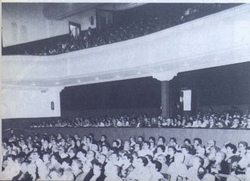
BARCELONA-SARRIA: Salón de Actos durante una de las ponencias.

Y de Montjuic a nuestros lugares de residencia contemplando una vez más la belleza de «Barcelona de noche».