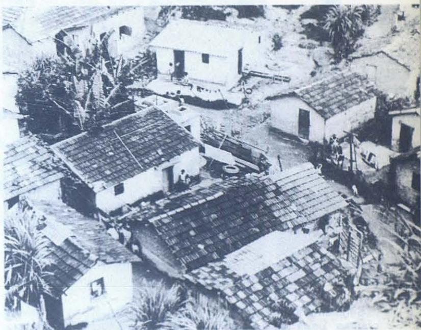
El joven no puede alcanzar un nivel de dignidad humana viviendo en los ambientes de chabolismo y de miseria.

1. En la formación permanente cuidar los siguientes contenidos y sus correspondientes actitudes: