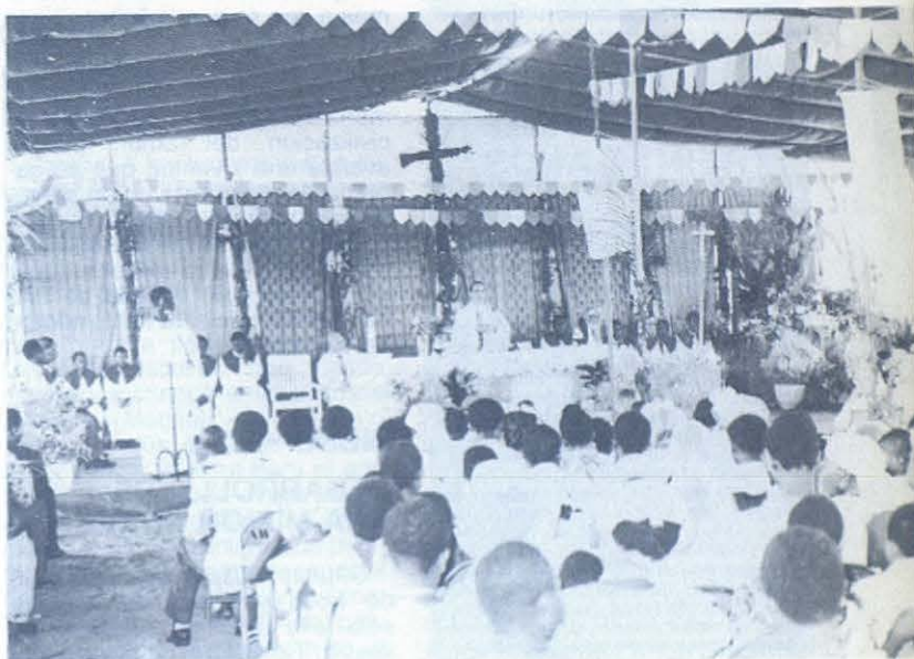
En Togo se quiere mucho a María Auxiliadora.

Esta ha sido la fiesta de este año. A todos nos dejó una impresión muy positiva, por ser fruto de la colaboración de muchas personas, por ver cómo ciertos laicos de la comunidad parroquial se han esmerado, por ver cómo el pueblo, los fieles han vibrado