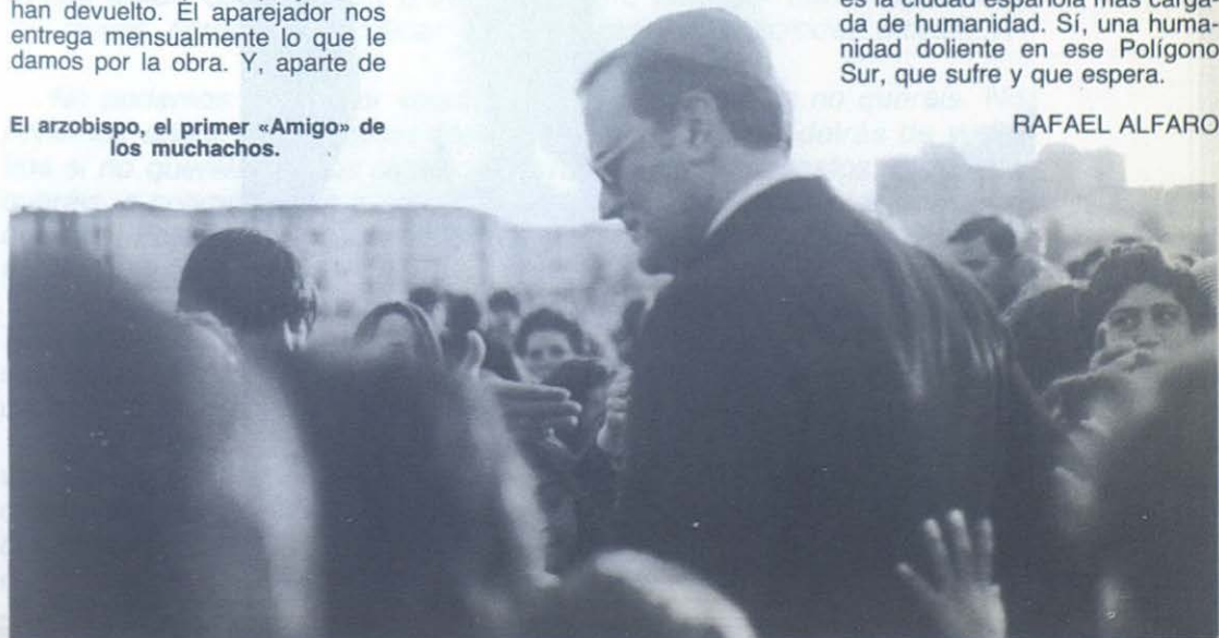
El arzobispo, el primer «Amigo» de los muchachos.