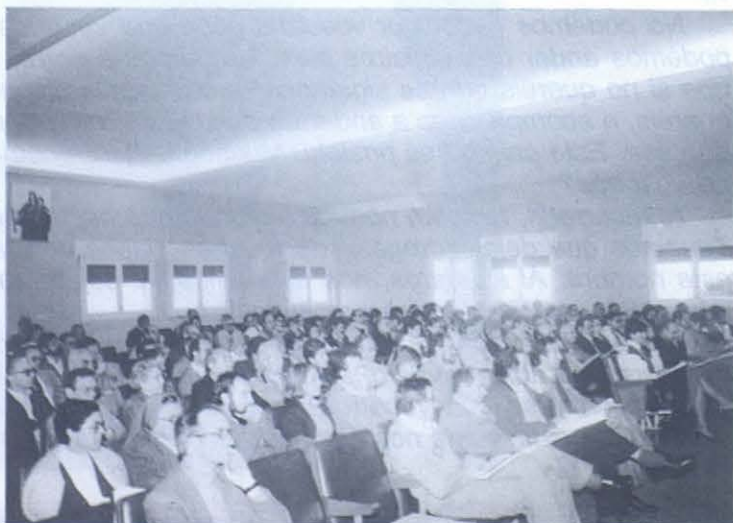
Asamblea de los asistentes. Arriba, grupo general en las gradas de la Basilica del Tibidabo.