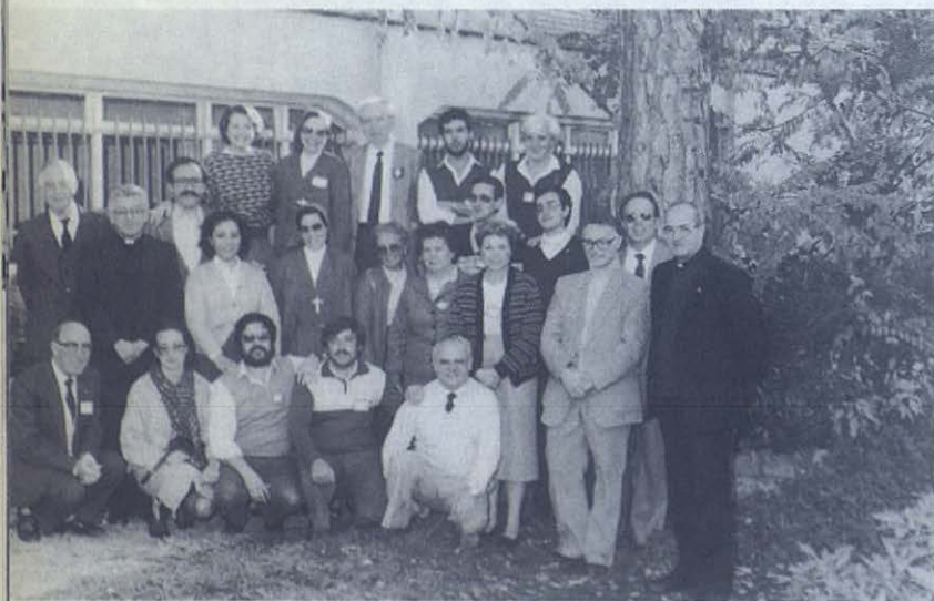
Grupo de la Delegación de Madrid.

He admirado la constante responsabilidad de los Cooperadores, su estilo de familia, la alegría de cada Cooperador, su conocimiento y la compenetración clara con lo que significa ser salesiano en el mundo. Les agradezco, os agradezco, el trabajo, el nivel de calidad de este trabajo, la dedicación, la estupenda buena voluntad, y admiro el amor que profesáis a don Bosco y el compromiso de hacer crecer este carisma en la historia de España y de Portugal (aplausos).