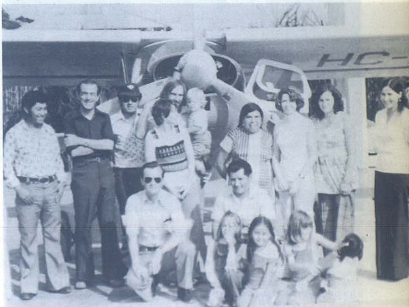
Con esta avioneta, se facilitan las comunicaciones de los centros más importantes de población con la selva amazónica ecuatoriana.

Para ello se sirve de tres emisoras: una de cinco kilovatios y dos de tres. Otra de cinco kilovatios está de reserva, para suplir cuando se produce alguna avería.