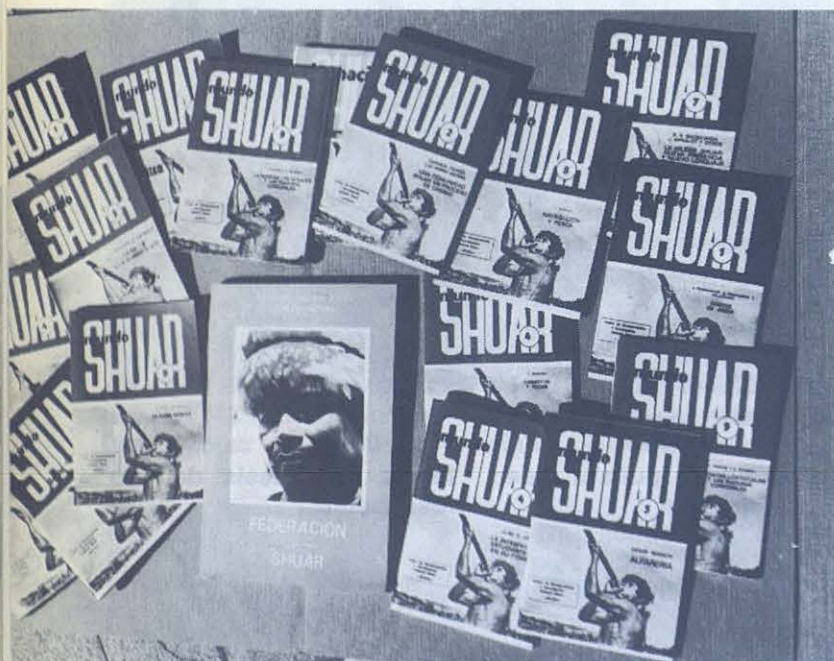
Publicaciones «Shuar», otro medio de comunicación para los indígenas.

Muchas fueron las dificultades que tuvimos que superar, sigue el padre Alfredo, suspirando hondo como después de dar la vuelta a la página dolorosa de un diario. Por ejemplo: Desconfianza en la técnica, escasa población escolar en algunas comunidades, fuertes reacciones al tener