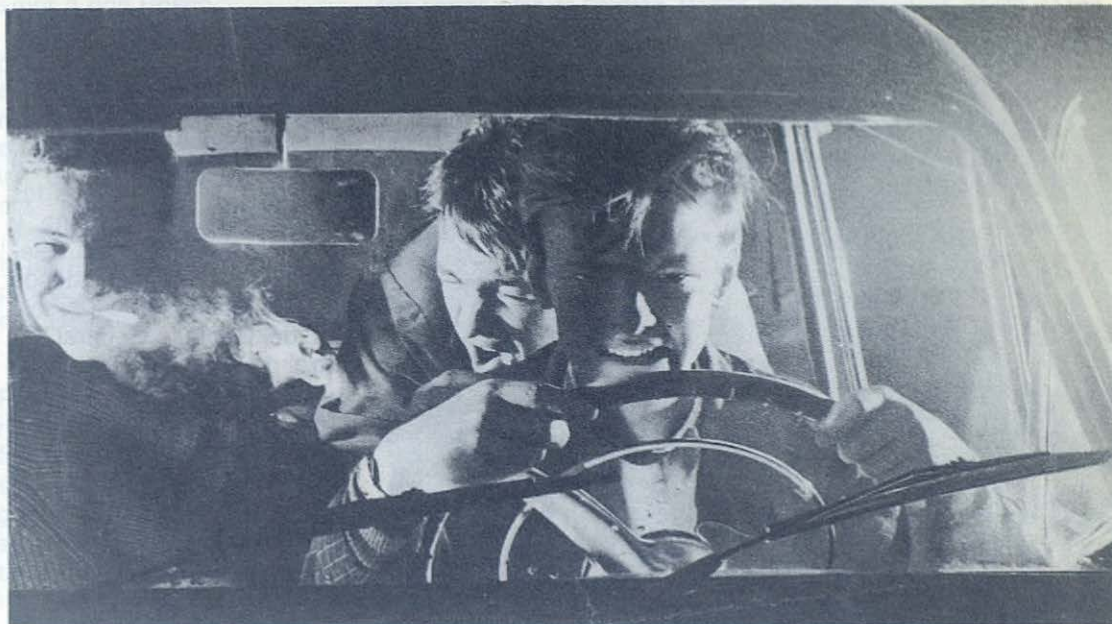
Los problemas juveniles son para solucionarlos, no para ser derrotistas.

pueda haberse modificado en el último año —y no estamos seguros de ello— la participación de los jóvenes, especialmente la participación política, sigue estando en unos niveles muy bajos. En unas circunstancias tan críticas como las actuales