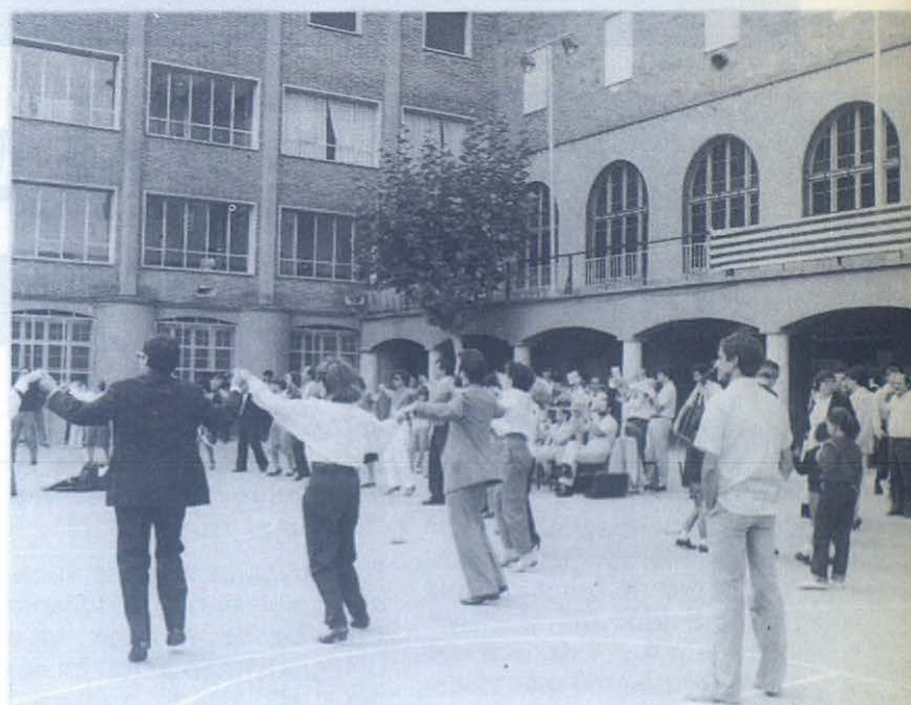
Ambiente festivo en el encuentro.