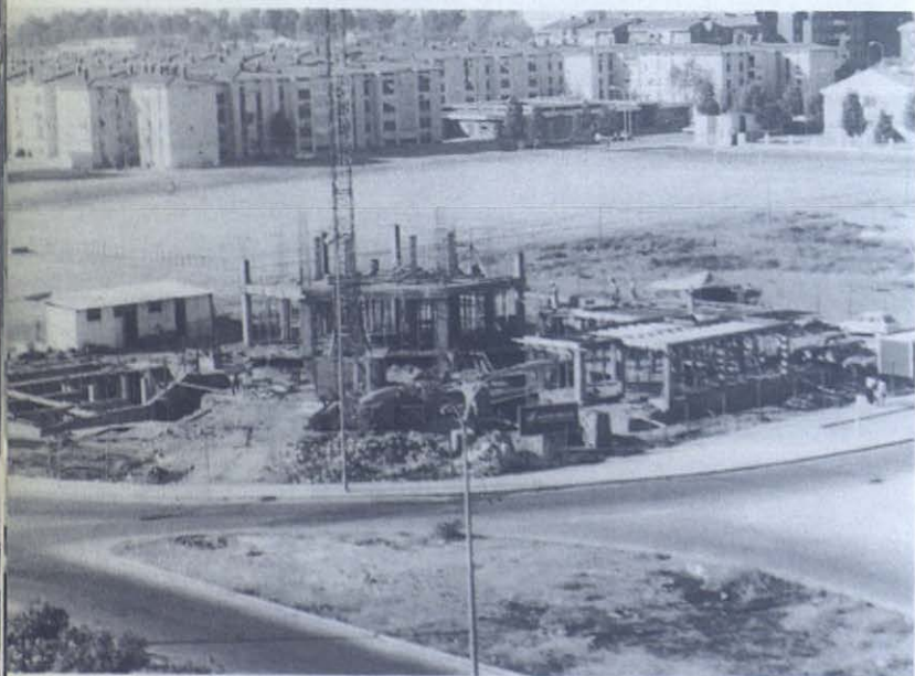
En el corazón del barrio sevillano surge el futuro centro parroquial.