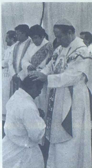
Momento en el que monseñor Braulio Sánchez confiere el diaconado a un padre de familia mixe.

El señor Obispo, los Párrocos de la Prelatura, así como los misioneros y las misioneras se veían visiblemente emocionados; y con las últimas notas de la Banda y las palabras de despedida de esa fiesta inolvidable surgió una de las realidades más consoladoras para