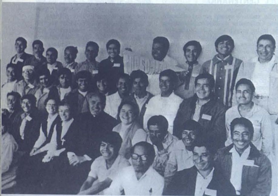
La primera preocupación de los Salesianos que llegaron a los Mixes fue la de formar catequistas para la evangelización.

El Papa, en su Bula, nos da el encargo de promover en toda la Prelatura la Evangelización y Catequesis. Y por esto desde entonces nos dedicamos con especial ahinco a formar los multiplicadores de esta evangelización... Y hemos encontrado un número muy crecido de Apóstoles Laicos. A los hombres les dimos el encargo de ser auxiliares parroquiales y a las mujeres que fueran catequistas.