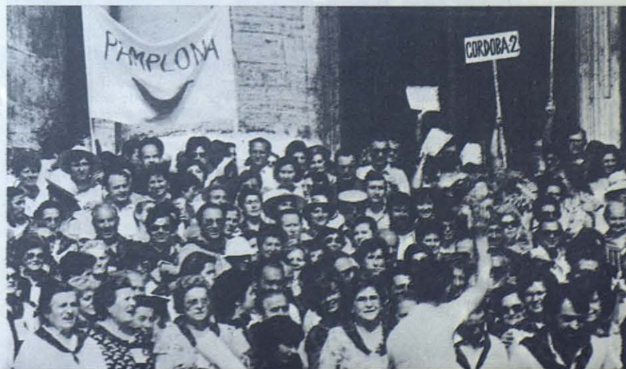
De Sevilla y Jerez; de Pamplona y de Córdoba..., una Familia Salesiana.