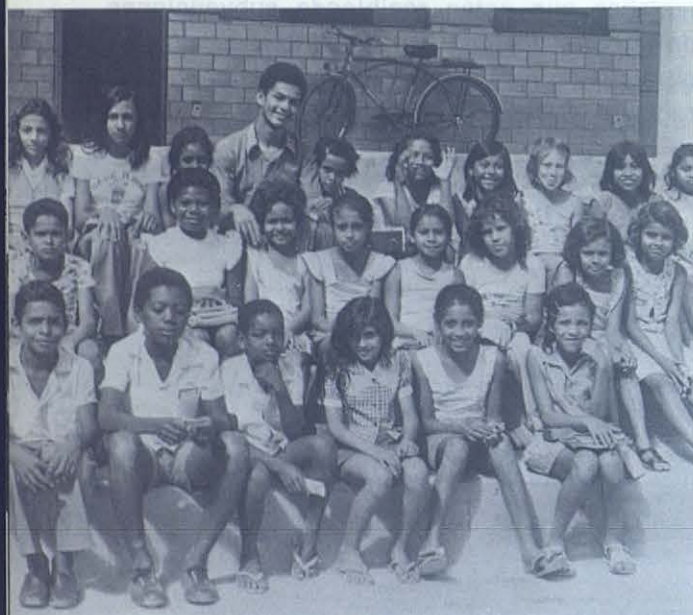
Estas «crianças» de Corumbá envían un saludo muy caluroso a sus amigos de España.

Asimismo, me enseña cartas de agradecimiento que ha recibido de los misioneros. Monseñor Obelar le escribe desde Fuerte Olimpo (Paraguay) y, entre otras cosas, le dice: «Le escribo a usted, que sigue siendo nuestro Delegado ante la «Campaña contra el hambre», para que pueda apuntalar con sus visitas nuestros pedidos... Rece, buen hermano, por este Obispo el último de la Iglesia, que se suscribe su hermano en Don Bosco».