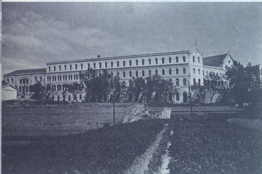
Colegio Salesiano de Mataró, vista lateral del edificio.

El Arzobispo Monseñor Javierre, presidió la Concelebración Eucarística. Asistió el ilustre señor alcalde, don Joan Majó i Cruzate.