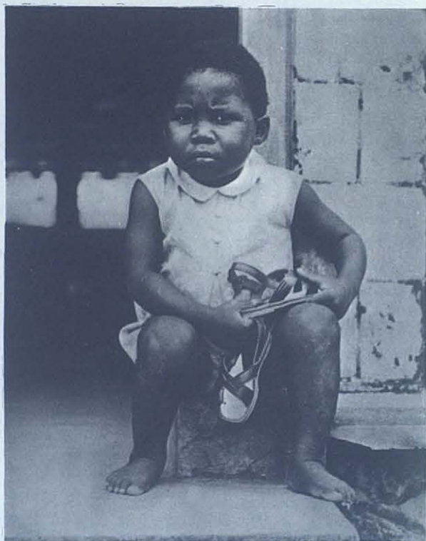
LIBREVILLE: Otro niño gabonés en cuyo rostro no se adivina la felicidad de la infancia.

En Blefort hicimos noche. Una larga reunión hasta las 10,30 de la noche alternando con tam-tam y cantos cristianos. Son Yakubas también. Cada uno dormimos en una casa diferente de adobe como todas. Sin ventana alguna. Pero nos dan lo mejor que tienen: una «cama» con 4 listones o de bambú y 4 trapitos encima. Ellos se apañarían para dormir en cualquier rincón. De dormir, a ratos. Los mos-