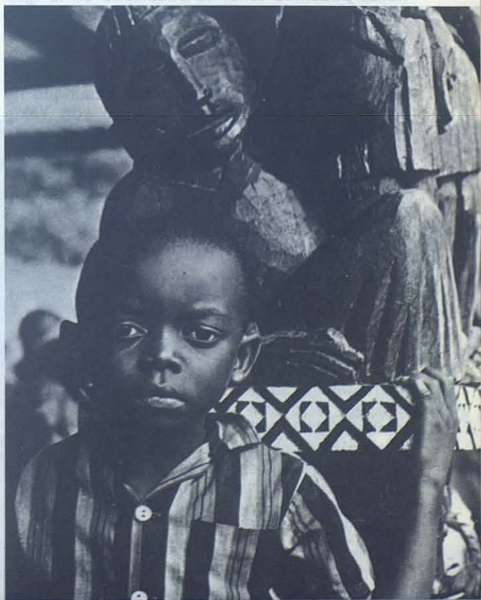
LIBREVILLE (Gabón): El Africa de mañana está en la intensidad con que miran al mundo estos niños.

Son varias las instalaciones que tiene la Misión: Casa de los misioneros, locales con comedor y dormitorio para los «stages» trimestrales de los 54 catequistas, iglesia a dos pasos, arpatanes (tipo glorieta para reuniones al aire libre, un pequeño huerto y hasta dos perros, Lassi (perra) que pertenecía a las hermanas Asuncionistas que dejaron la misión