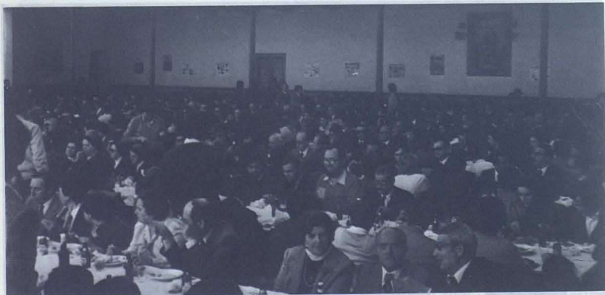
CORDOBA: El patio del Colegio Salesiano se convirtió en un inmenso restaurante para más de mil comensales de la Familia Salesiana.

¿Qué más nos han dado los Salesianos? Nos han dado la fe religiosa, el amor al Papa, el fervor. Cuando no hay fer-