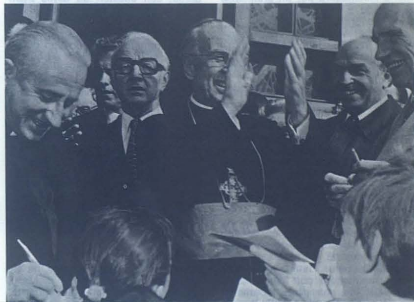
VIENA: Los Salesianos de Austria han celebrado su 75.º aniversario con la participación de 17 inspectores salesianos. Han presidido las fiestas: el Cardenal Koenig, el Presidente de Austria R. Kirschlaeger, y el Rector Mayor don Egidio Viganó. «Me congratulo con los Salesianos de Austria —dijo el Presidente— por su jubileo; y mucho más, por su presencia dinámica y por la fuerza con que han entrado en nuestra sociedad con sus obras y con la constancia de su trabajo».

El Congreso se concluyó con el insustituible «fogón», momento de alegría familiar.