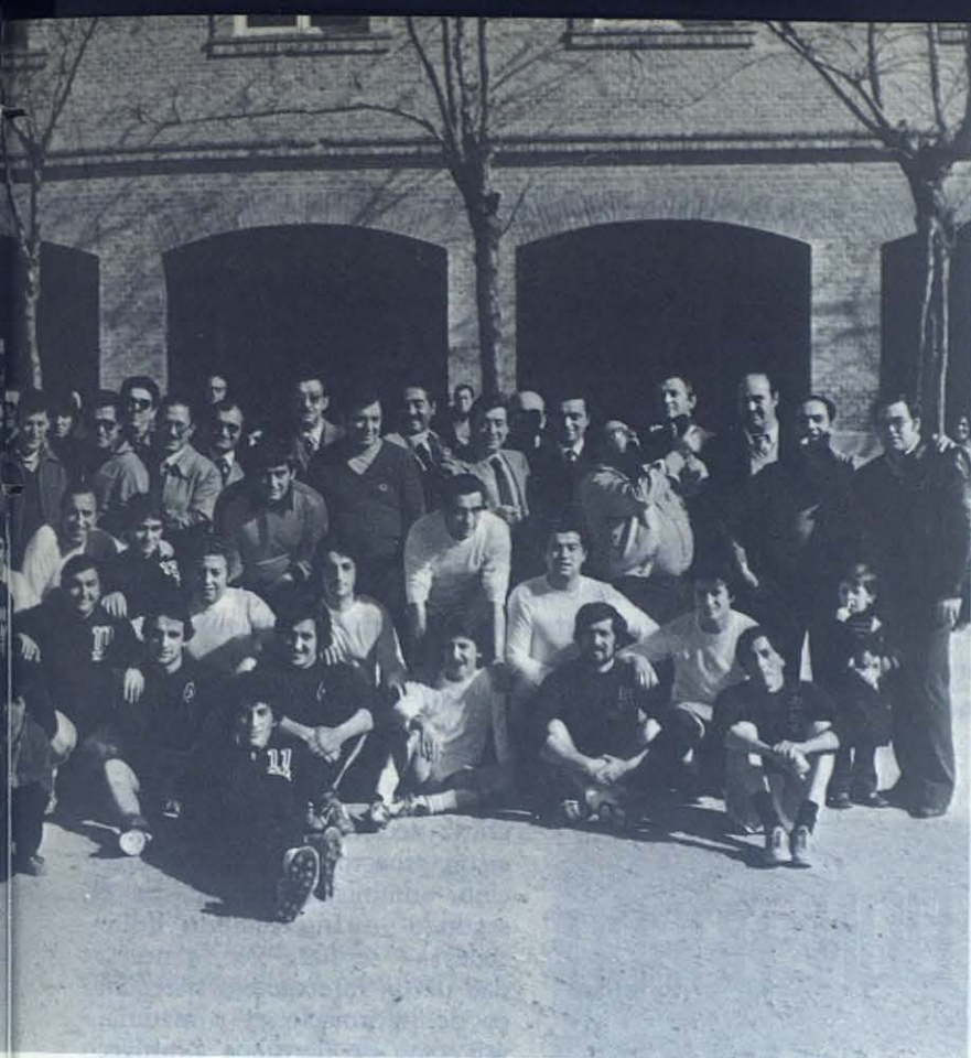
MADRID: Los hombres del Cine español se reúnen en torno a Don Bosco en el Colegio de Estrecho.

por lo que se calla que por lo que se dice. Y me corta: