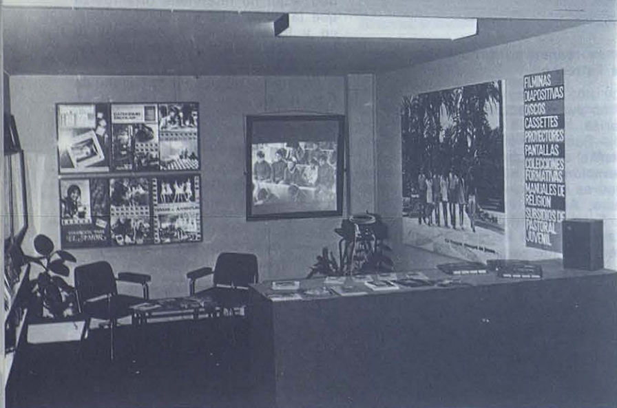
MADRID: La Central Catequística Salesiana presentó esta muestra en el Palacio de Exposiciones de Madrid.

Con el encuentro del 23-26 de mayo pasado, en Caracas (Venezuela), se han sentado las bases para una colaboración orgánica internacional entre las Editoriales salesianas. En aquella ocasión se redactan tres documentos que constituyen la «car-