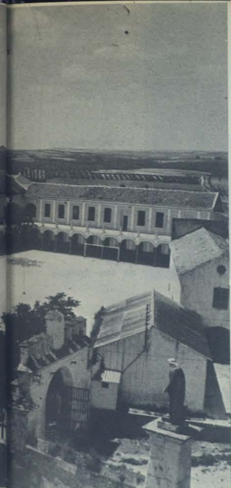
Vista panorámica del Colegio, como era antes...

porque le será más fácil cantar las glorias y las bellezas de una ciudad que se queda en el corazón de cuantos la visitan.