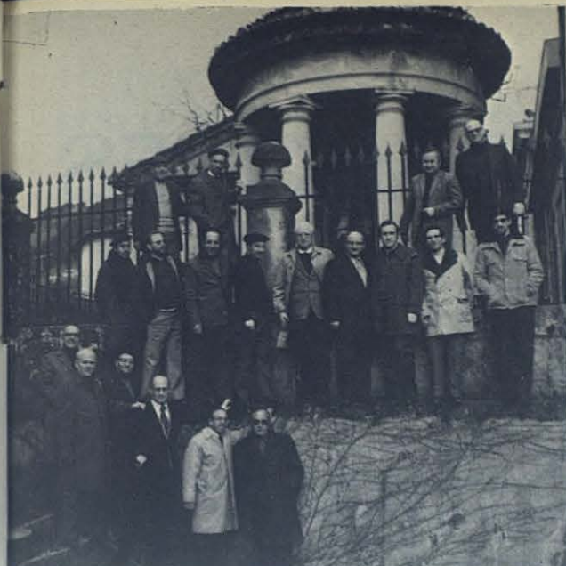
Las tierras vascas tienen muchas cosas que ver. La historia, el arte, el paisaje, la industria... Aquí, ante el histórico Arbol de Guernica.

pectores que acaban su mandato. Te hablo por mí, que hubiera agradecido inmensamente esta oportunidad que más tarde pudieran tener colegas míos. A los Directores que acaban el sexenio y se les proporciona un año de menor compromiso. A los que próximamente deberán cargar con la responsabilidad de una comunidad y ejercer un liderazgo religioso de tipo nuevo y más difícil que llevar adelante una empresa. Vivir el Curso sería la mejor preparación. A cuantos tienen cargos de responsabilidad en la comunidad. Nada mejor que la experiencia del curso. Finalmente, a todos los que hace diez años se ordenaron o hicieron la profesión perpetua. Algunos Institutos lo han puesto obligatorio en este momento de la vida, que suele coincidir muchas veces con la pérdida del entusiasmo y espontaneidad inicial y el comienzo de la rutina. El próximo curso, en la Pisana, organizarán un curso para la tercera edad: de sesenta a setenta y cinco años.