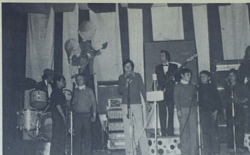
El grupo «Shalom» de Ronda, ganador del «Disco de Oro» del III Festival de la Canción Infantil. Lástima que no se oiga la extraordinaria voz de este rondeño...