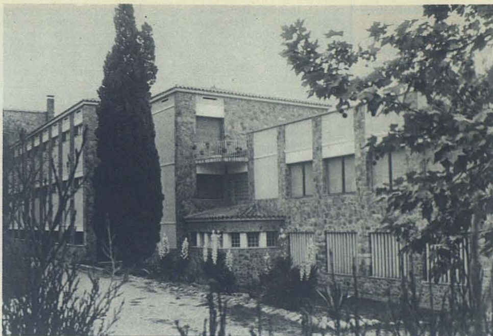
No se trata de un palacio, sino del colegio de las chicas de Plegamans.

—Hemos tenido mucha suerte con los Dirigentes. Tanto en lo que concierne a la educación, como en lo que atañe a la economía; nuestro margen de libertad es grandísimo. Nos apoyan en todo, yo mismo el Tribunal Tutelar de Barcelona, de quien dependemos directamente, como el Consejo Superior de Protección de Menores, con sede en Madrid, y a cuyo Presidente ya conoces.