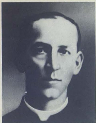
(Arriba).—El siervo de Dios Luis Variara, salesiano que entregó su vida al servicio de los leprosos de Agua de Dios.

lesianos han construido una ciudad de 32 casas, distribuidas en cuatro barrios de ocho casas; hay cocina común, biblioteca, salón de actos, banda de música, banco, cooperativa, jardines, iglesia..., todo. Allí pasan a vivir los que lo han merecido. Tienen su alcalde, sus consejeros y su cabildo. Con capacidad para 520 muchachos.