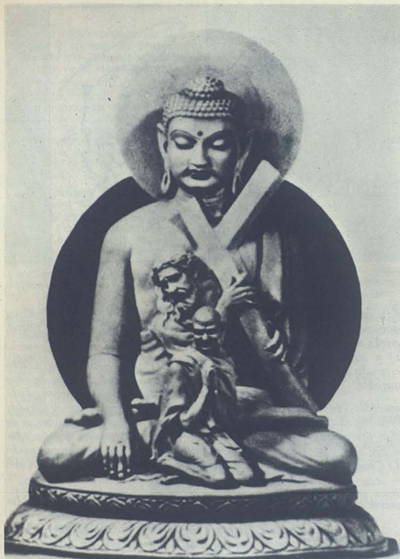
Un escultor de la India realizó este grupo escultórico original en los años 60. Entre Buda y Gandhi vemos la figura de Jesús de Nazaret.