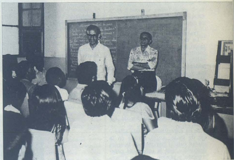
SAO GABRIEL (Brasil). —El Obispo y el Alcalde hablan a un grupo de indios a los que la Iglesia de Río Negro les ha encomendado la evangelización de sus comunidades. El empuje misionero de esta Prefectura Apostólica está transformando la región. Treinta tribus de indios están organizadas en comunidades de base, a imitación de los primeros tiempos del cristianismo.

"Soy un clérigo español de la Inspectoría de Barcelona, uno de los componentes de la expedición misionera del Centenario-75. Mis familiares y amigos me piden in-