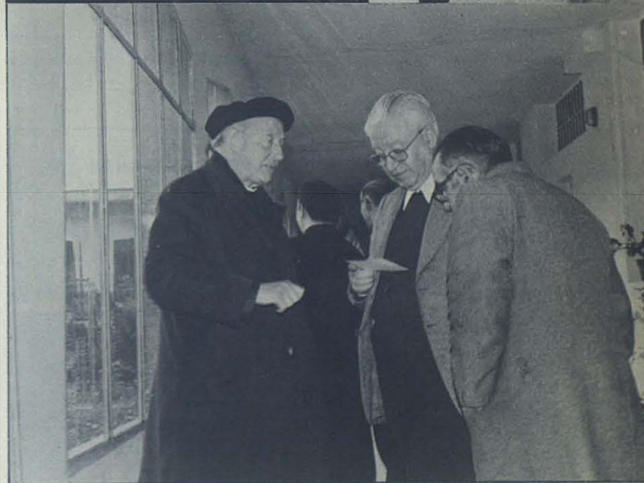
Don Juan Manuel de Beobide, por lo visto plantea un problema muy serio a don Ambrosio y a don Esteban...

Incluso muchos sacerdotes de cierta edad no han captado toda la significación de las tareas de aquellos cuatro fecundos años romanos.