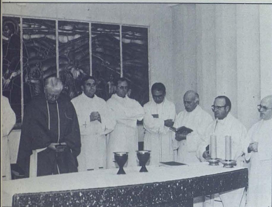
Cada mañana, la fiesta íntima y reflexiva de la Eucaristía abre el alma a la comunión universal.