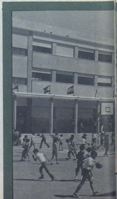
Los patios del Colegio Salesiano de Rota se ven en invierno y en verano alegremente concurridos de gente joven amante del deporte.