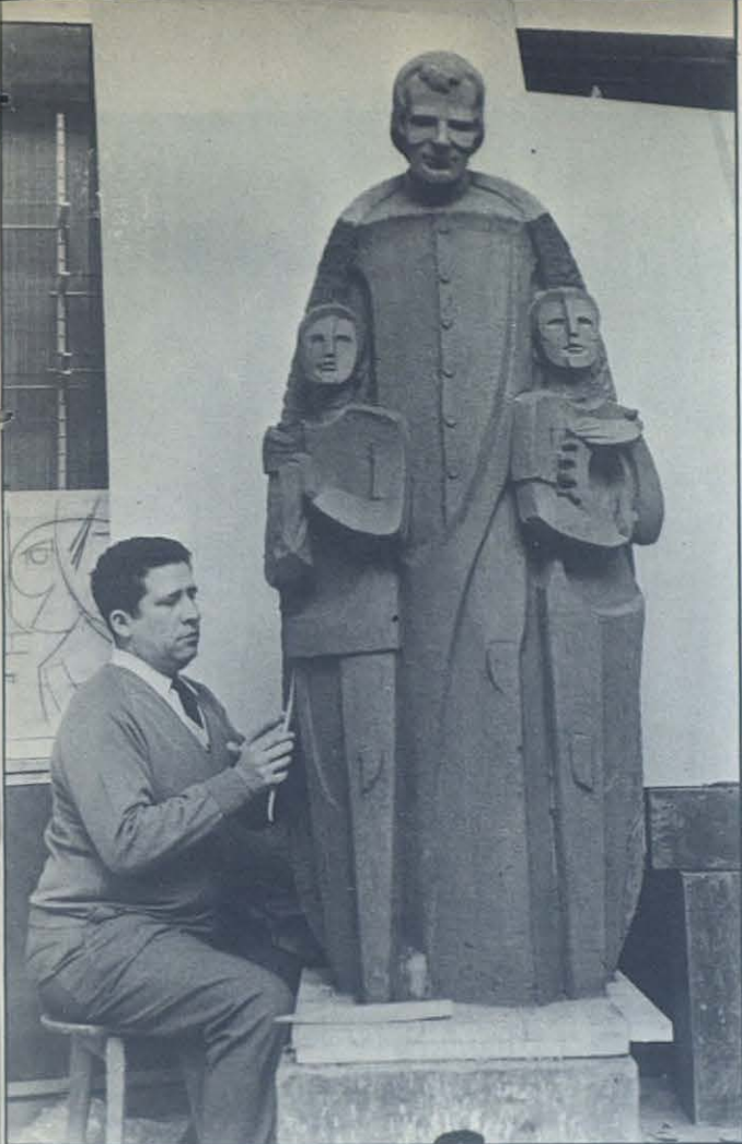
El escultor en pleno trabajo artístico con una de sus imágenes favoritas: Don Bosco.

—No es disonante si conserva la proporción ambiental con la que juega el gótico. Hemos de reconocer que en el siglo XV, en pleno apogeo del estilo gótico, los artistas de esta época no eran góticos sino simplemente modernos, es decir, actuales. Crearon este estilo porque era producto de sus vivencias, de su cultura, de su forma de pensar. Esto mismo podríamos decir del románico, del renacimiento, etcétera. Todos nuestros antepasados eran más sinceros que nosotros —en arte por lo menos—, porque no se copiaban retrospectivamente, evolucionaban siempre hacia adelante, y no es raro encontrar en iglesias, que tardaron centurias en construirse, ver reflejados todos los estilos que cronológicamente se sucedieron.