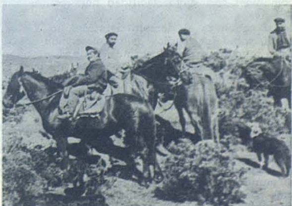
PORVENIR (Chile).—Salesianos de la Escuela Agrícola, en busca de las ovejas... que han de trasquilar.