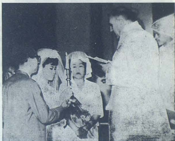
ASUNCION (Paraguay).—Prófugos de Corea del Norte refugiados en Paraguay y asistidos por un salesiano. En nuestra foto, una coreana de 25 años recibe el bautismo.