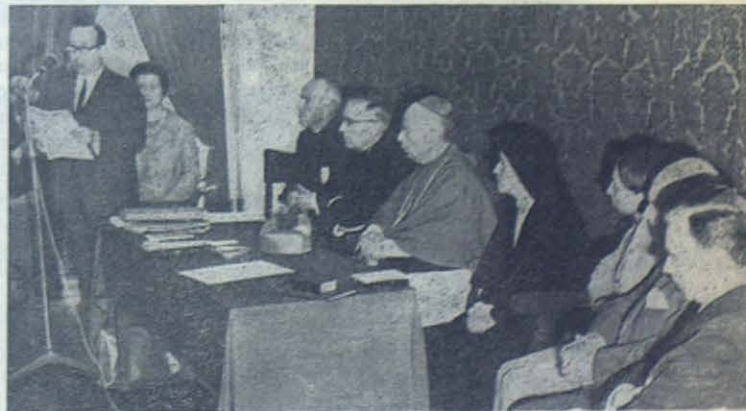
Presidencia de la reunión general de los Cooperadores Salesianos portugueses, en Fátima. Participaron a la sesión más de 300 socios.