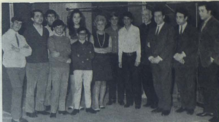
Grupo de los actores y realizadores de la serie "Chicos del cielo", después de una emisión en la Radio Nacional de Portugal.

Todos los jueves se retransmitía a las siete de la tarde. Participaron en esta emisión artistas nacionales y chicos de los colegios salesianos. Así, por medio de la Emisora Nacional se ha difundido la vida de Don Bosco y de los muchachos santos de su sistema pedagógico.