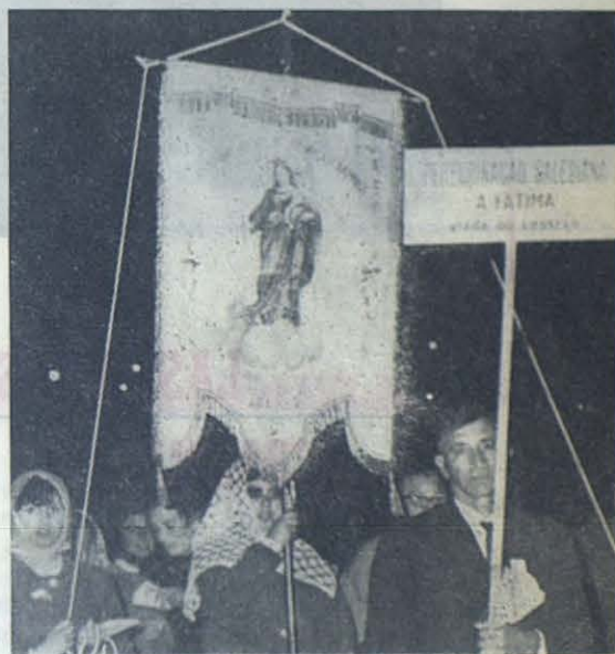
Estandarte que encabeza a los 5.000 peregrinos de la Obra Salesiana en Portugal.