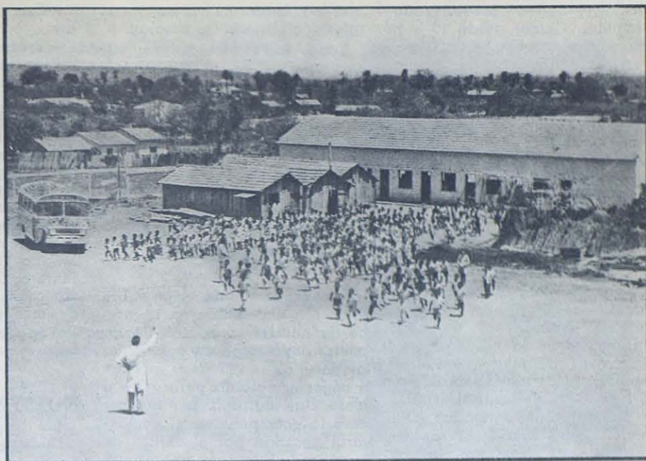
mando aspecto con sus barracones de mampostería y sus cientos de chicos que disponen de ellos, de amplios patios para sus juegos y de profesores que les atienden y educan. A la vista de esos modestos edificios se piensa sin querer con que poco basta para evangelizar a los pobres y como rinden esas limosnas que hacen posible las obras salesianas.