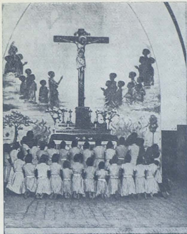
Ante un sencillo altar, ilustrado con un mural en el que los Mártires de Uganda rodean al Mártir del Calvario, la niñez de la nación honrada por la visita del Papa, se afirma en su fe y alienta el deseo de dar también la vida por Cristo si hiciera falta.