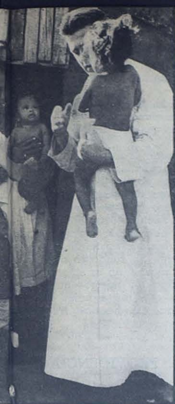
Un grupo de mujeres que llevan a sus hijos donde dos médicos amigos que acuden en busca de ellos. Como la ciudad va to-