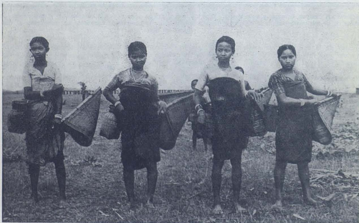
La vida de las tribus assamesas no es fácil. En la tribu de los garos los misioneros salesianos han implantado un sistema de cooperativas y ayudas económicas que han librado a los cristianos de la miseria y de la usura, como nos narra el P. del Curto en las declaraciones que reproducimos. En nuestra foto un grupo de mujeres garos con sus artefactos de pesca se dirige al río en busca de un complemento para su plato de arroz.