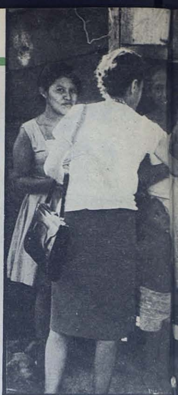
mismo padre atiende a un grupo de sus pequeños al dispensario. En la foto de la izquierda los muchachos se turnan para visitar al padre por su salud. En la tercera foto ven

de chicos vagabundos que no pueden formar parte de nuestra ciudad porque no tenemos ni sitio ni medios.