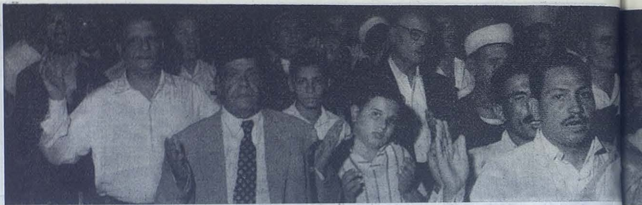
Cristianos del Líbano participando a la Santa Misa. El «sacerdocio común»

de donde han de beber los fieles el espíritu verdaderamente cristiano (Cons. L. n.º 14). Notemos los términos empleados: «participación plena, consciente y activa».