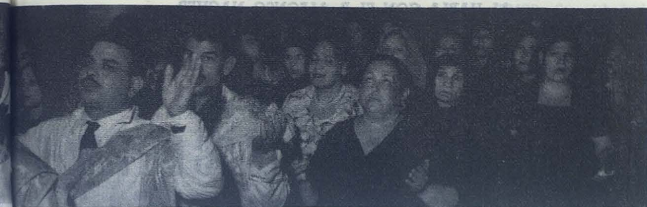
in los fieles» se expresa principalmente en la participación en el culto.

lio y vivida con espíritu de fe, de esperanza y de amor, para gloria del Padre en unión e imitación de Cristo hermano mayor, por ella todas las actividades humanas y todas las realidades del mundo quedan consagradas a Dios desde nuestra intimidad.