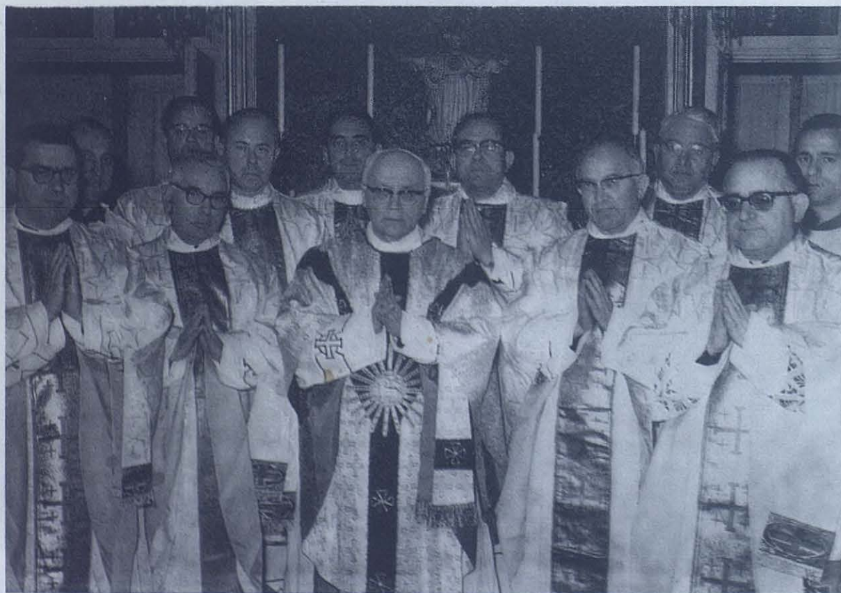
Los inspectores salesianos de España y Portugal rodean al Rector Mayor Don Luis Ricceri, con quien concelebraron en la Capilla de las Habitaciones de Don Bosco. Con ellos Don Isidro Segarra en su calidad de presidente de la Conferencia Ibérica Salesiana. Dicha conferencia se reunió en las inmediaciones de Turín durante el mes de Enero.