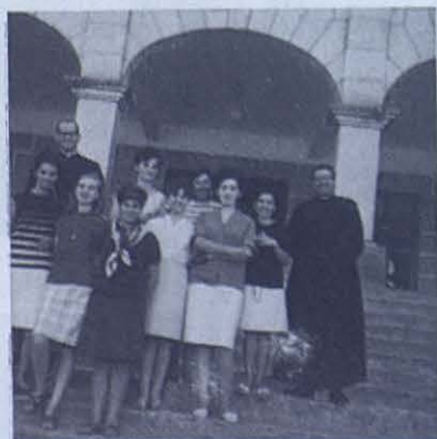
CAMBADOS — Grupo de cooperadoras de Vigo, que visitaron la Casa de Formación.