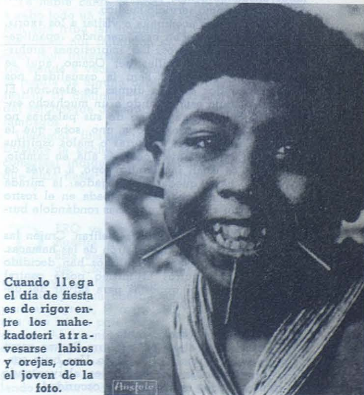
Cuando llega el día de fiesta es de rigor entre los mahekodoteri atravesarse labios y orejas, como el joven de la foto.

En la breve explanada que se extiende al pie del Cerro Wanidi, se aprecian las edificaciones de la Misión Salesiana. Los locales antiguos se han levantado con materiales de la selva: parature, cedro y macanilla, pero los nuevos —amplios, funcionales y no desprovistos de estética— se han levantado con bloques y piezas prefabricadas: es el cemento «civilizado» que ha llegado más cerca de las cabeceras orinoquenses. La girándula del pozo parece un avión que no halle dónde aterrizar. A decir verdad, las obras hidráulicas y otros hitos de ingeniería pregonan El Platanal como el