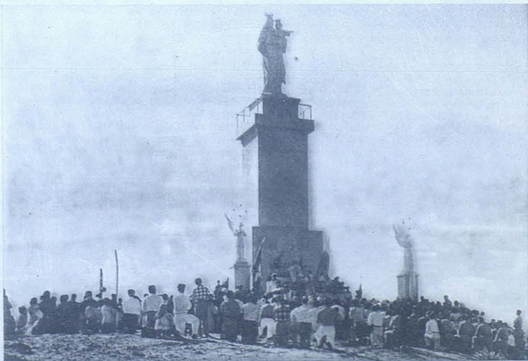
CONTRATACION (Colombia).—Monumento a María Auxiliadora recién bendecido.

Como se ve el diálogo con los hijos está entretejido de mil hilos diversos, seguiremos tejiendo.