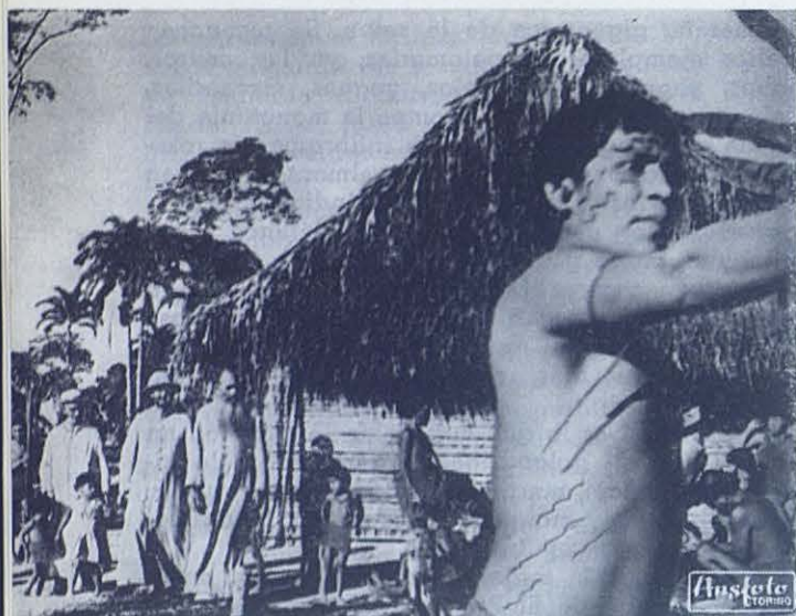
Visita a una aldea de Mavaca.

caserío moderno más cercano a las fuentes del Orinoco.