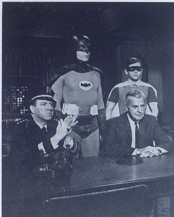
Neil Hamilton presenta actualmente un programa televisivo cuyos principales personajes aparecen en la foto.

—«Ahí está el busilis. Hasta ahora les iba pagando yo, pero se me acabó el carbón.»