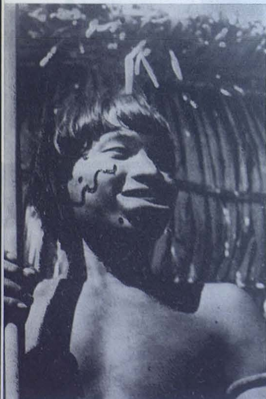
Indio guaica que se ha abultado los labios como señal de fortaleza.

En la oscuridad de sus «yano» al avaro fulgor de los fogones, cenan los indios... El menú es variado. Todavía hay pijiguao de la última cosecha.