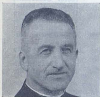
Don Albino Fedrigotti PREFECTO GENERAL

Nacido el 21-10-1902 - Salesiano: 14-8-1919 - Pref. Gen. 1.º-8-1952.