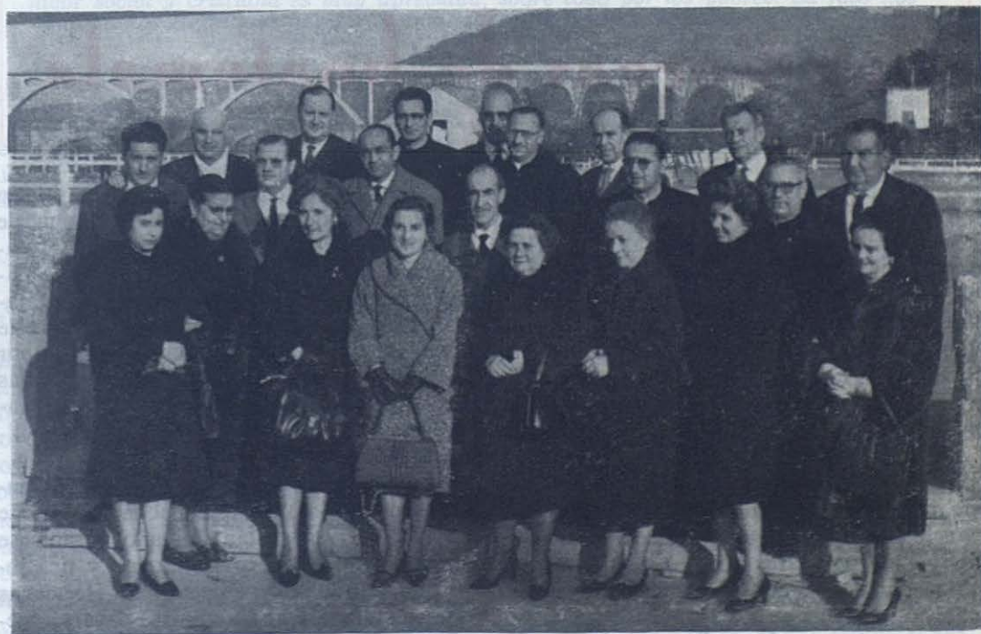
ORENSE.—Delegados y Consejeros de Orense, Allariz y Celanova, que se reunieron para estudiar el calendario de actividades del presente curso y cambiar impresiones para la mejor marcha de la Pia Unión en la provincia.

Dijo la misa fray Mauricio de Begoña, capuchino, que también pronunció una plática. Asistieron a la ceremonia religiosa numerosos artistas del cine, teatro y de otras actividades artísticas.—(Ya.)