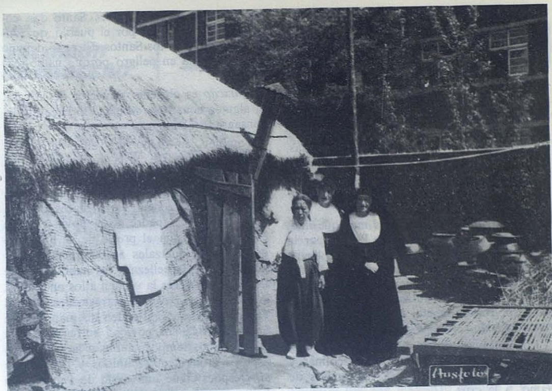
Las Hijas de María Auxiliadora son un valioso auxilio en las Misiones. Su labor social y cristiana es muy apreciada, sobre todo por los pobres. La foto nos muestra dos Hermanas de María Auxiliadora de visita a la cabaña de una familia, que se levanta al lado de una casa moderna.

Las dos parroquias que concurrieron a la fiesta de María Auxiliadora, el 24 de mayo, cuentan con 35.000 habitantes, de los cuales 7.000 son cristianos y el resto paganos.