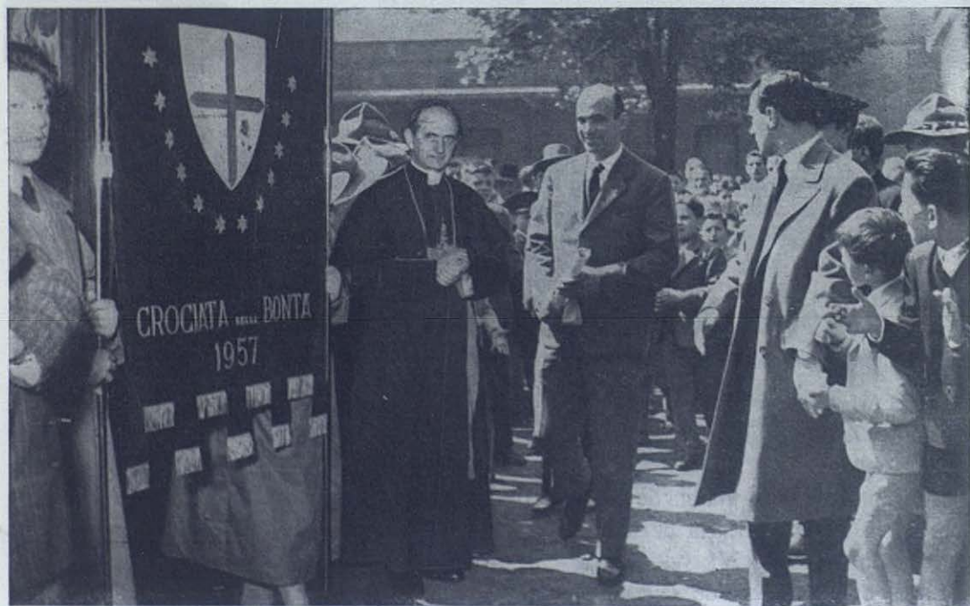
Una de las visitas realizadas por el actual Pablo VI, cuando fue nombrado Arzobispo de Milán por Pío XII, fue a la parroquia salesiana de San Agustín para repartir los premios de la Cruzada de la Bondad a los chicos del oratorio. Su amor a los pobres, a los humildes, ha sido siempre una de las características del nuevo Papa quien ahora, desde su alta cátedra, irradiará al mundo las luces de la caridad cristiana.

Al júbilo de la cristiandad y a la admiración del mundo la familia salesiana de España, por su portavoz el BOLETÍN SALESIANO, agradece a la Providencia su inestimable don y se une gritando con entusiasmo y amor: «¡Bendito el que viene en el nombre del Señor!».