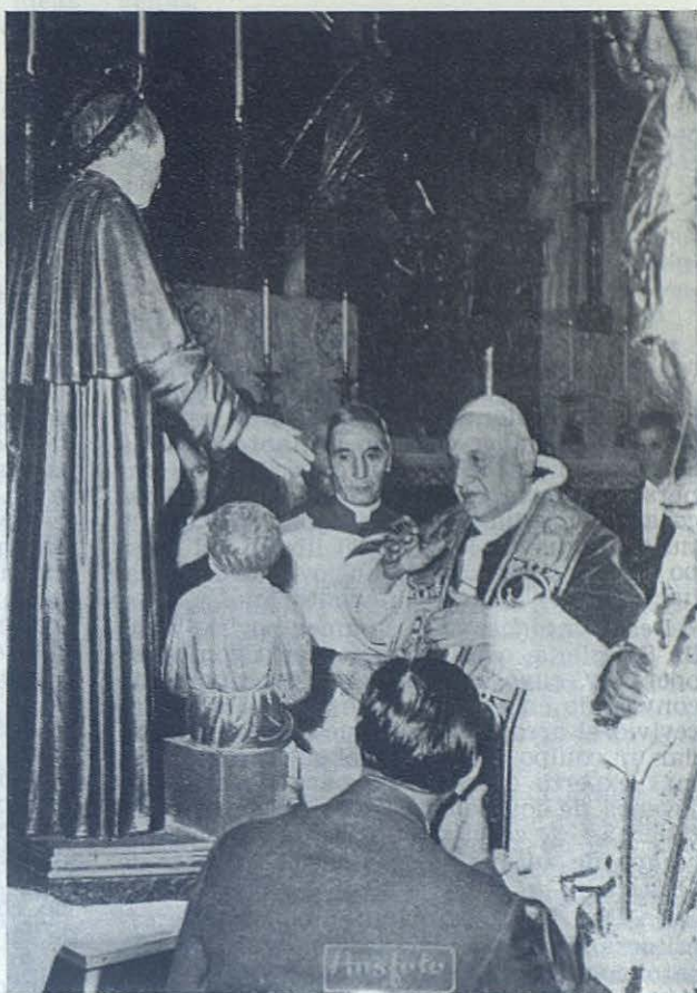
ROMA.—S. S. Juan XXIII bendice una estatua de San Juan Bosco durante su visita al Templo del Santo de Roma.

Recordad finalmente el paso del discurso en que manifestó: « Por nuestra parte hemos ofrecido nuestra vida en pro del buen éxito del Concilio ». He aquí a la distancia justa de un año que su ofrecimiento generoso ha sido aceptado y ha volado al seno de Dios para propiciar los auxilios neces-