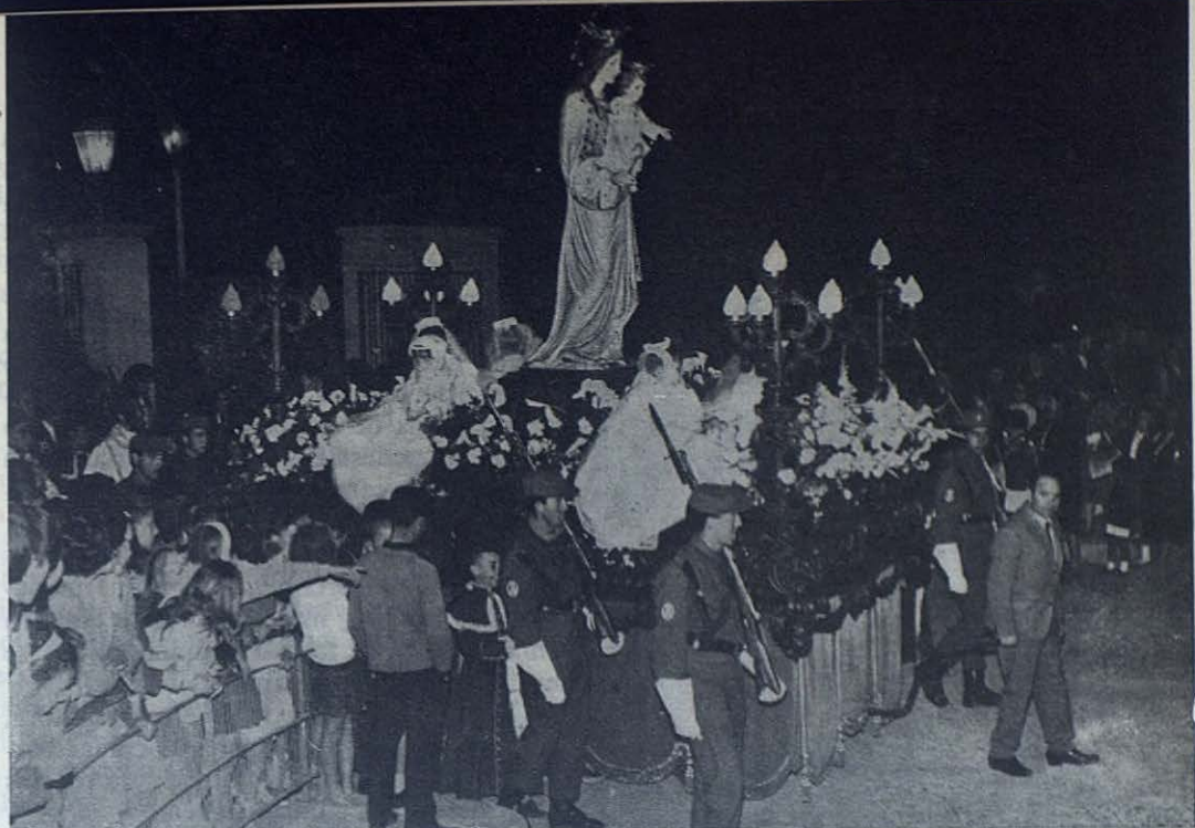
La fiesta de María Auxiliadora se ha celebrado con todo fervor en España. Nuestras fotos recogen el paso de la Virgen en Zamora (foto superior); la bajada de la Virgen en Cáceres (foto inferior dcha.) y la procesión de la Coronación de María Auxiliadora en La Palma del Condado, ciudad donde unas 900 familias reciben mensualmente la visita de María Auxiliadora (foto inferior izqda.). Más de cien poblaciones españolas vieron desfilar a María Auxiliadora en medio del fervor de sus devotos, cada día más numerosos.