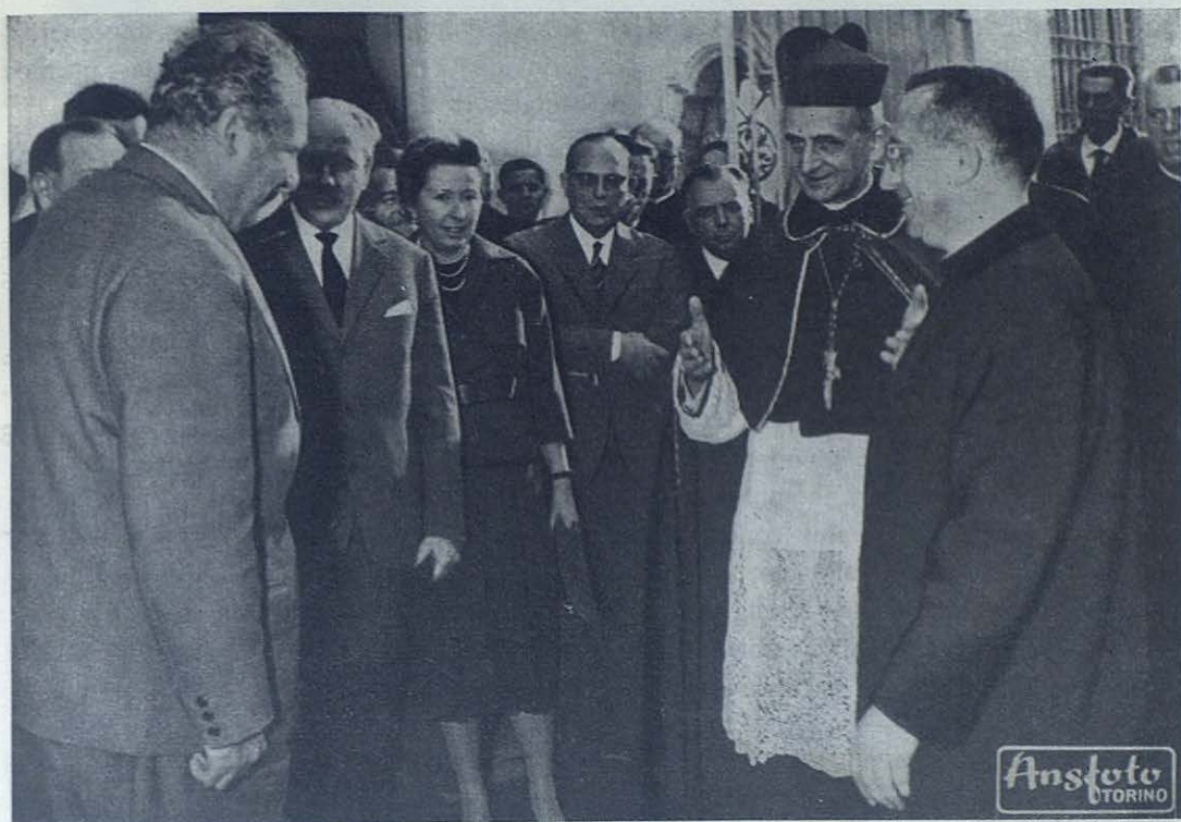
El nuevo Papa, Pablo VI, siendo Cardenal de Milán, prodigó sus atenciones a la Congregación Salesiana, a la que le unen lazos de afecto y un común interés por la juventud. La foto nos lo muestra en el Colegio salesiano de Arese, reformatorio cuya labor regenerativa de jóvenes descarriados, según el sistema de Don Bosco, tantas alabanzas recibió del hoy Pablo VI.