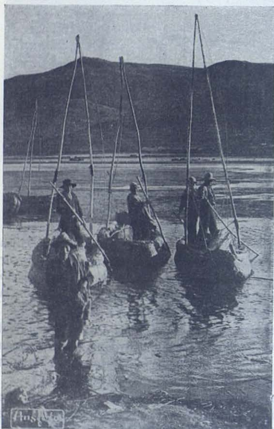
Pescadores del lago Titicaca sobre sus barcas trenzadas con mimbres y fibras vegetales.

PUNO.—A 3.800 m. de altura, en las orillas del pintoresco lago Titicaca, la ciudad de Puno tiene una población de 15.000 habitantes. Además de las riberas del Titicaca, el resto de la región es una de las más ricas del Perú y de las más fértiles (tierra negra), buena también para la cría de ganado. Una necesidad urgente de técnicos y la lucha contra el analfabetismo han inducido al Gobierno a crear un centro de estudios y de cultura para los indios.