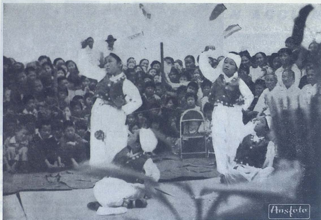
SEUL.—Niñas de la parroquia salesiana de San Juan Bosco en la capital coreana, danzando en la celebración de una fiesta religiosa.