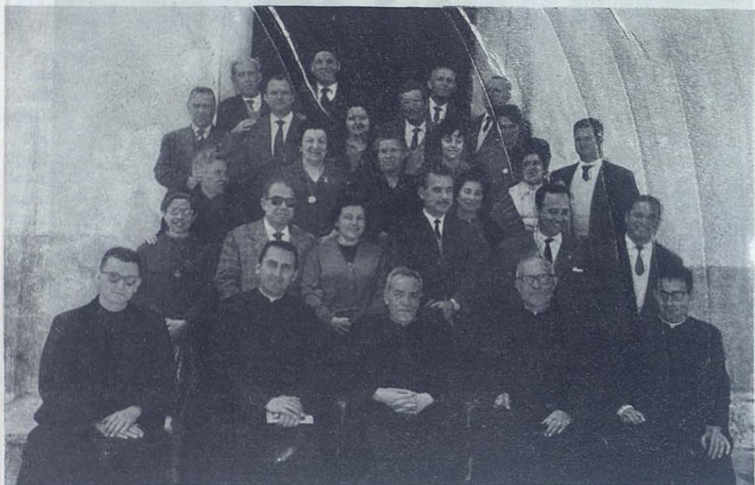
GODELLETA.—Cooperadores que celebraron el primer día de retiro espiritual.