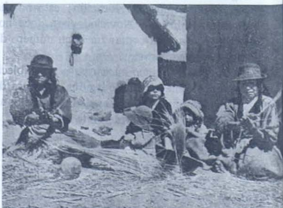
Artesanía inca, fabricando cordeles.

Las difíciles condiciones de vida de los indios no favorece la higiene, y sobre este punto los Salesianos tienen mucho que hacer. Pero han de luchar sobre todo contra la "coca" y el alcoholismo y todas sus consecuencias. El uso de la "coca" está demasiado extendido. Apenas el indio acusa cansancio,