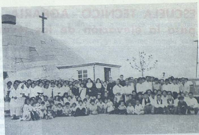
A 40 kilómetros de Kwanju existe un villorrio de 200 leprosos a los que atienden las Hijas de María Auxiliadora y los Salesianos.

Hace ahora cinco años que nos establecimos también en Seul, dedicados a la cura de almas en una parroquia, dedicada a San Juan Bosco desde hace veinte años.