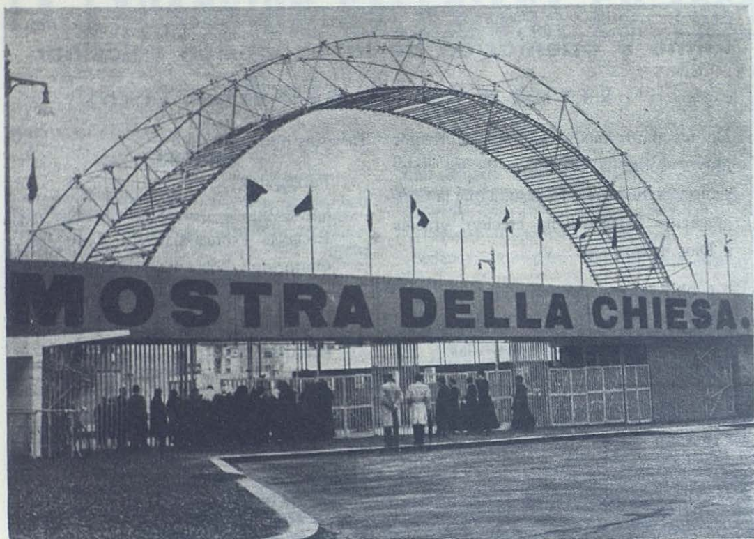
ROMA.—Vista de la entrada a la Exposición de la Iglesia.