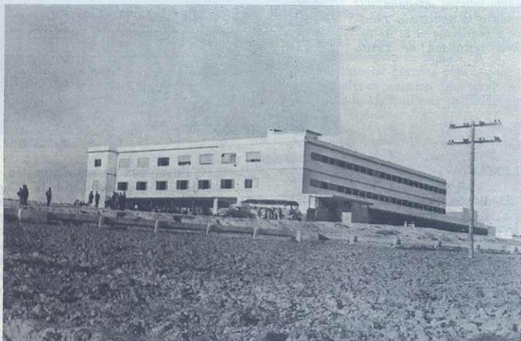
PEDRO ABAD (Córdoba).—Nuevo aspirantado de la Inspectoría de Córdoba.