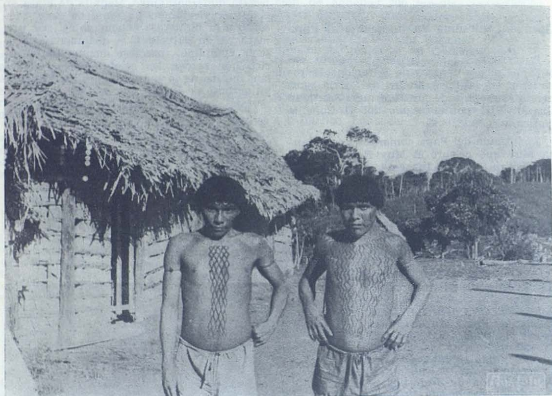
ANABORI (Brasil).—Dos jóvenes aicás, huéspedes de la Misión.