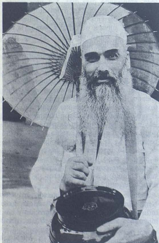
INDIA.—Misionero salesiano vestido a la usanza de los santones hindúes con la hucha típica para limosnas.

El regimiento de tamilianos que construye las carreteras en el Bhután han enviado el jeep azul, japonés, para llevar al pater .