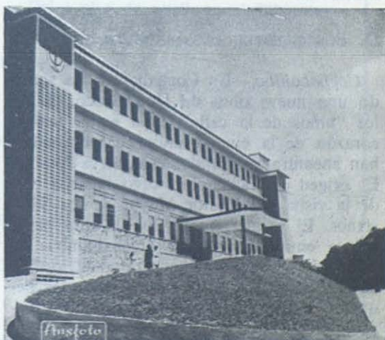
LOS TEQUES-VENEZUELA.—Pabellones recién inaugurados del Aspirantado Salesiano.

Desde ahora en adelante los fieles que todos los domingos vienen desde todas las partes de la ciudad para escuchar la Santa Misa, recibir los Sacramentos, al ver sus restos mortales, recordarán también los con-