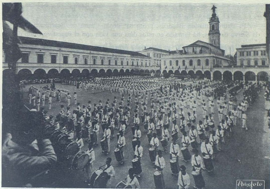
SAO PAULO.—Magnífico aspecto del patio del Liceo del Sagrado Corazón durante el homenaje a Juan XXIII, que le tributaron los alumnos en la persona de su representante, el Nuncio.

vian las penalidades del enfermo que yace en el lecho del dolor; otras, en fin, de otro cualquier modo particular entienden en el bien del prójimo por amor de Dios.