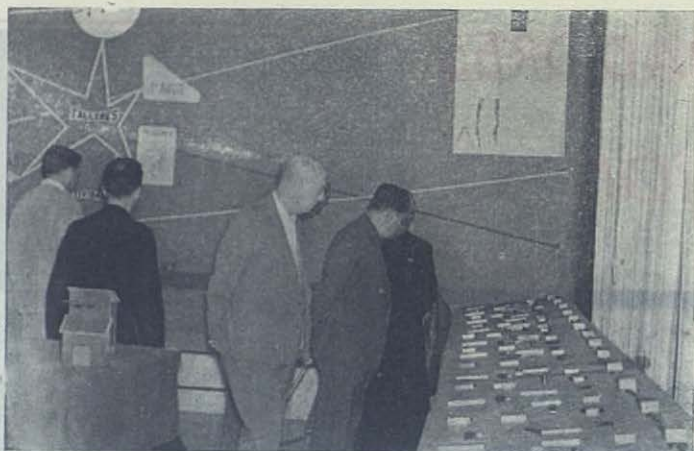
PUERTOLLANO.—Exposición profesional escolar.