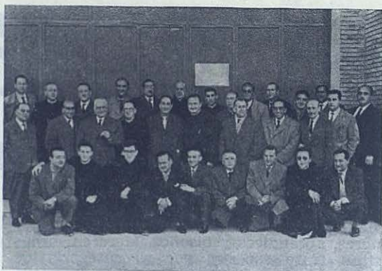
ELCHE.—Grupo de personalidades y de antiguos alumnos ilicitanos que celebraron la fiesta de Don Bosco.

Desde los primeros momentos la ciudad recibió con todo entusiasmo a los Hijos de Don Bosco. Hoy se puede decir que toda ella respira en salesiano. Son ya muchas las familias que reciben la capilla de María Auxiliadora y que asisten a los cultos que se celebran mensualmente en la iglesia del colegio.