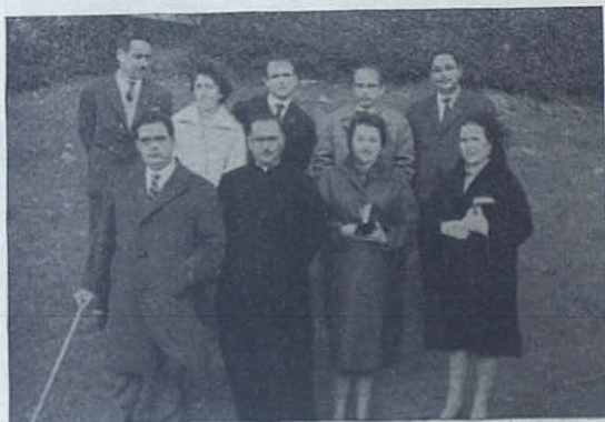
Grupo de Cooperadores salesianos que componen el Consejo Local en el Centro Colegio-Hogar de San Roque, de Vigo.