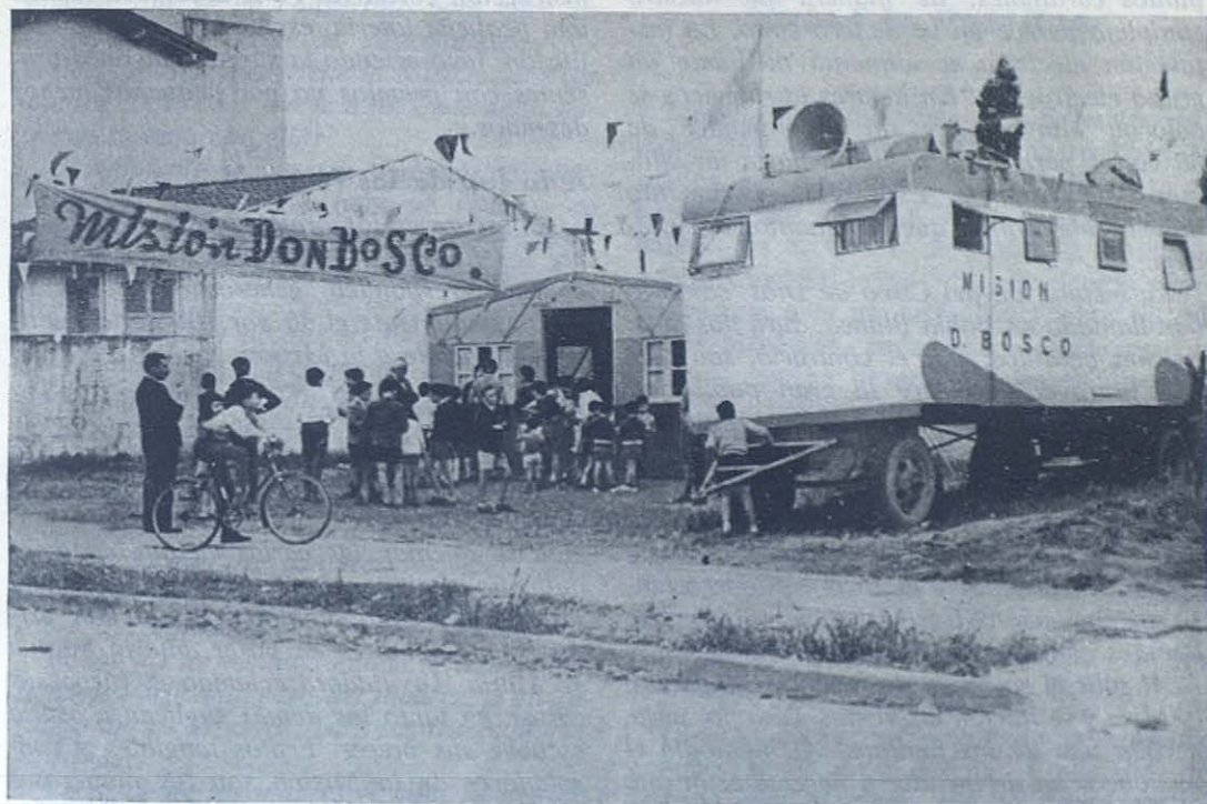
BAHIA BLANCA.—La Misión Don Bosco rodante echa los frenos en las afueras de la ciudad.