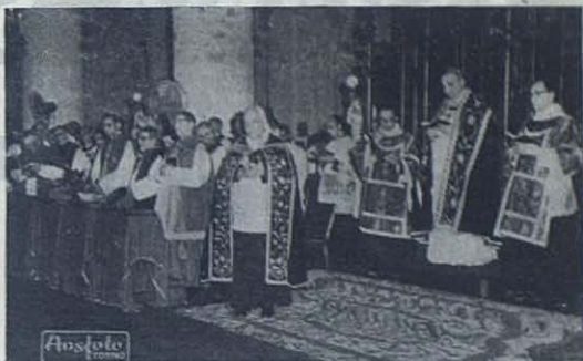
SANTO DOMINGO. —Solemnes funerales por el alma del Arzobispo Salesiano Mons. Pittini.