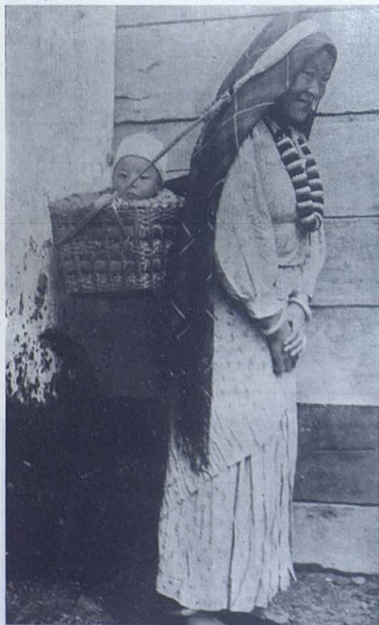
SHILLONG. — Las madres khasis rodean a sus hijos de grandes cuidados. Los llevan consigo a todas partes, dentro de una cesta que cuelga de sus cabezas y apoyan en la cintura.

Nueve tribus khasis habitan en el cielo y siete sobre la tierra. En otro tiempo, las siete tribus de la tierra subían y bajaban a su gusto por medio de un árbol altísimo plantado en lo alto de una montaña. (Leyenda khasi.)