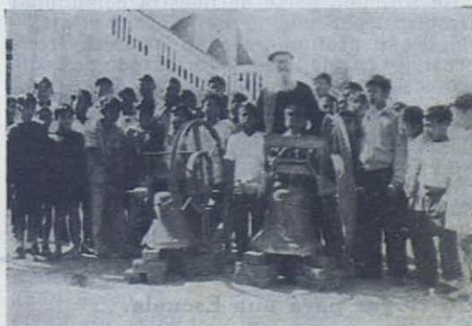
SHILLONG. —Unos buenos Cooperadores han regalado estas campanas para la iglesia de María Auxiliadora. Antes de que las suban al campanario son admiradas por los muchachos del Orfanato.