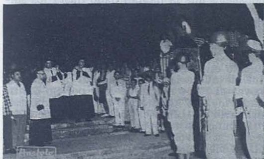
SANTO DOMINGO. —Entierro de Mons. Pittini. Se le rindieron honores militares.