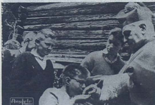
SUIZA. —Los Salesianos han habilitado un edificio para recoger a los hijos de los refugiados checoslovacos. El Obispo de la diócesis los visita y obsequia con caramelos.