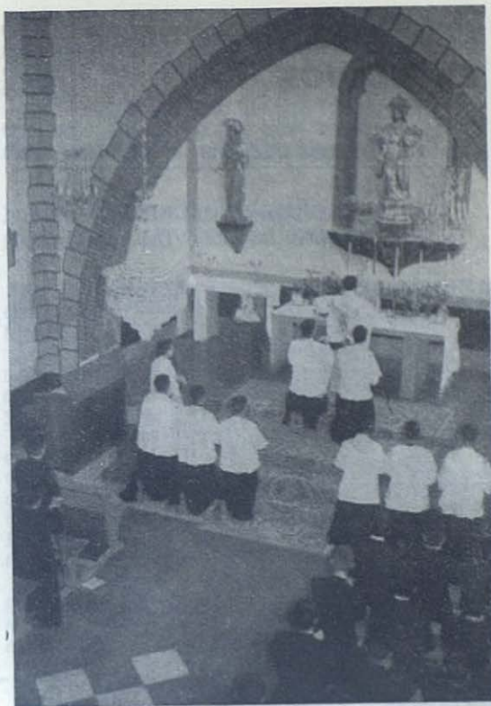
GODELLETA.—Capilla del nuevo Noviciado.

Ya lo sabéis, queridos lectores del BOLETÍN, sobre todo, vosotros los madrileños: En el Oratorio Santo Domingo Savio, de Hermanos García Noblejas, 66, de Madrid, hay centenares de niños, buenos y simpáticos, que piden por ustedes todos los días para que sean del número de sus bienhechores. Esta es una oportunidad que el Señor nos ofrece a todos de ayudar a San Juan Bosco a hacer de los niños pobres honrados ciudadanos y buenos cristianos.