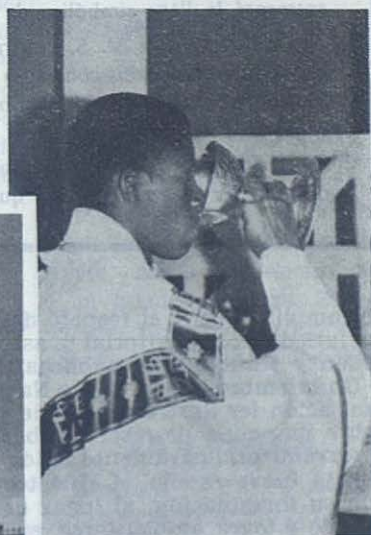
ELISABETHVILLE. — Mientras la guerra enluta el Congo, este novel Sacerdote Salesiano ofrece la hostia pacífica y el cáliz salvador.