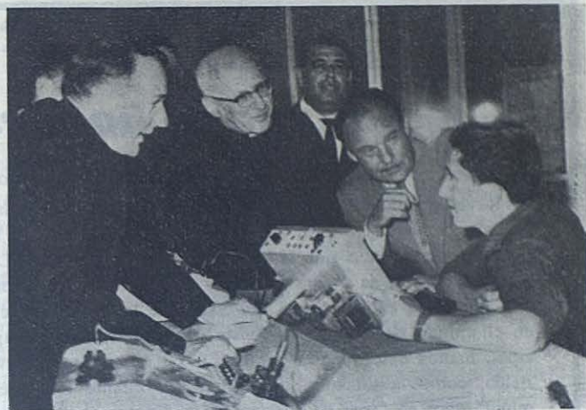
ROMA. — El Ministro de Trabajo inglés de visita en Ponte Mammolo.