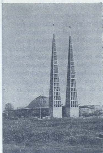
AUSBURGO. —Las airosas torres de la iglesia dedicada a San Juan Bosco acaban de ser terminadas. Miden setenta metros de altura.