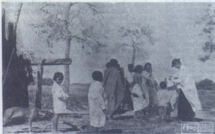
CHACO PARAGUAYO. — Tocó a Mons. Pittini abrir muchos de los caminos de América a los Salesianos: El Chaco, Santo Domingo, Boston... En el Chaco tuvo que empezar por una obra de misericordia, vestir al desnudo, como nos lo muestra la histórica foto.

«Efectivamente, así es, un salto casi mortal desde los bosques del Chaco a los rasca-cielos de Nueva York; desde la florida primavera del Uruguay en noviembre, al preludio frío y húmedo de aquella metrópoli; de la vida tranquila y alegre del ambiente sudamericano al vértigo de la vida febril estimulada por los negocios en aquella tierra; de la melodiosa habla española al gutural y áspero anglosajón; de la red de oro de relaciones y amistades, resultado de una convivencia de treinta y cuatro años al ambiente social enteramente desconocido de Estados Unidos. Salto, en verdad, casi mortal, pero no para las alas de la obediencia, que no conocen distancias.