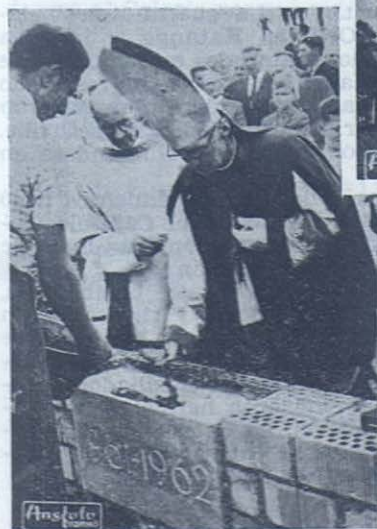
SUIZA. — Primera piedra del Aspirantado Salesiano.