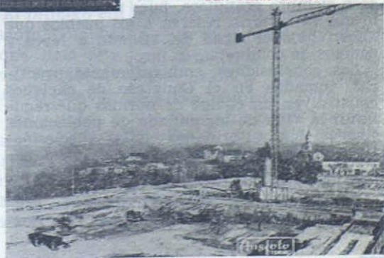
COLLE DON BOSCO. — Estado de las obras del templo a San Juan Bosco.