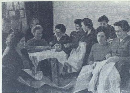
ALLARIZ (Orense). —Grupo de celosas Cooperadoras que semanalmente dedican una tarde para arreglar la ropa del centenar y medio de Aspirantes que se preparan para ser futuros Sacerdotes Salesianos.

Cooperadores les animó a seguir militando en esta Pia Unión de Cooperadores, tan grata a los Papas y a la Iglesia. A los nuevos seminaristas les animó a dar su nombre para que disfruten de los beneficios con que está enriquecida la Pia Unión de Coopera-