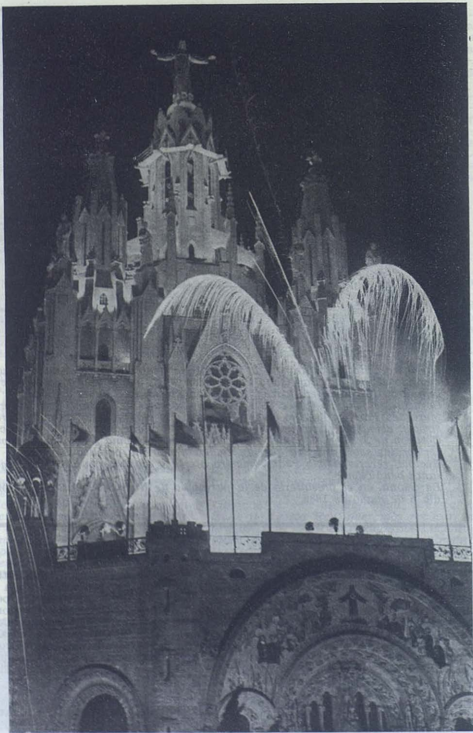
TIBIDABO.—Iluminación del templo.—La noche del 21 de octubre se enriqueció con una nueva estrella, encendida por el Papa en el cielo de Barcelona. La Basílica del Tibidabo resplandece en la altura cual la nube protectora que Dios regaló a Israel: brilla durante la noche y guía durante el día a la tierra de promisión de las misericordias de Jesús.