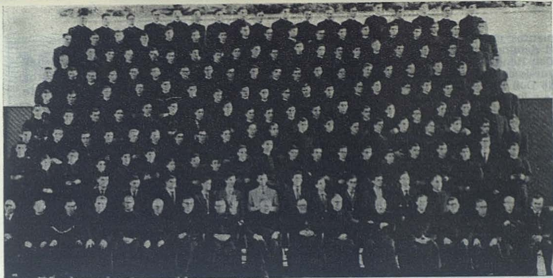
SAN JOSE DEL VALLE.—Novicios y coadjutores que han recibido la sotana salesiana de manos del Rector Mayor.

les. Todavía quedaban en el recuerdo, imborrables, las gratisimas impresiones de aquellas jornadas de 1953, en que estuvo con nosotros recién elegido Superior Mayor.