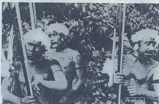
Indios Guaiacas, o guerreros, que viven junto al Orinoco, en estado primitivo. Desde hace dos años los Salesianos tratan de civilizarlos y convertirlos.

EL río Orinoco tiene su geografía particular. Comienza su curso en la Sierra Parina, que forma la divisoria de aguas entre Brasil y Venezuela. Después de recorrer 500 kilómetros el río se bifurca dirigiéndose hacia el mar el brazo más grueso, en tanto que el de menor caudal comienza a correr en otra dirección, principalmente hacia el Sur, dando comienzo al Casiquiare. Recorridos 200 kilómetros, este brazo secundario tropieza con un río colombiano, que en su curso penetra en Venezuela: el río Guina Guaina. De la confluencia de ambos, nace el Río Negro que, a su vez, muere en el Amazonas.