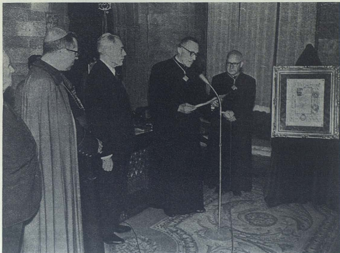
BARCELONA.—El Rector Mayor contesta a las palabras del marqués de Castell Florite, agradeciendo el honor que en su persona se rinde a la Congregación Salesiana.