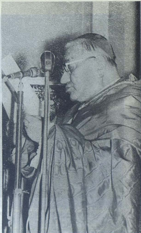
TIBIDABO.—El Cardenal Cicognani, leyendo el mensaje del Papa durante el pontifical de la fiesta de Cristo Rey.

Sobre la puerta misma de la nueva Basílica Don Bosco, en blanca estatua de mármol afirma su presencia; Don Bosco desde su