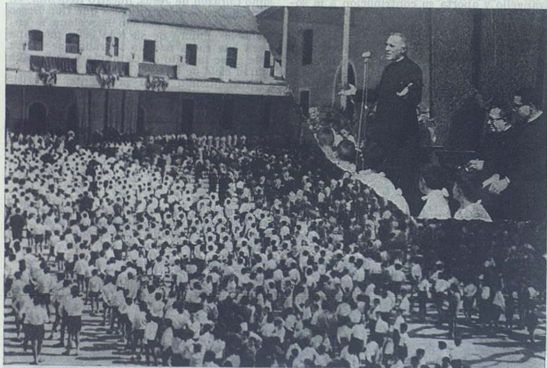
SEVILLA.—Ante los millares de alumnos de las Escuelas Salesianas de Sevilla, antiguos alumnos, y cooperadores, el Rector Mayor agradece el recibimiento triunfal que le dispensan.