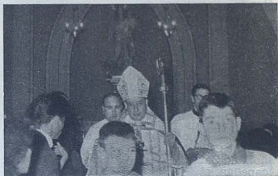
TORTOSA.—El señor Obispo de la diócesis, Monseñor Manuel Moll, Antiguo Alumno Salesiano, bendijo el altar de María Auxiliadora en el Aspirantado de las Salesianas.

Las cinco primeras Aspirantes se han convertido en cincuenta y una, que forman bello marco al altar; las cinco Religiosas en catorce; las alumnas pasan del centenar, entre ellas han florecido tres vocaciones; las Archicofrades, 200 y, en las naves de la Parro-