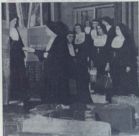
NEWTON (Estados Unidos). — Expulsadas por Fidel Castro las Hijas de María Auxiliadora que trabajaban en Cuba, se han repartido por diversas naciones. Un grupo llega a Newton, donde son recibidas con todo cariño por la Madre Inspectora de los Estados Unidos.

nata y al salero gaditano, la ciencia del acreditado magisterio español.