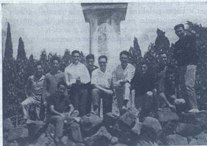
MARTI-CODOLAR. — Jóvenes Cooperadores de San José de Rocafort que han hecho ejercicios espirituales.

Adelante más unidos, mejor organizados, con programas completos y concretos, atendiendo principalmente a las obras de apostolado especificadas en el Reglamento.