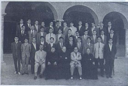
MADRID-ATOCHA.—Grupo de Maestras industriales salido este año de las Escuelas Profesionales Salesianas.

La Exposición permaneció abierta un mes, siendo visitada por unos 10.000 visitantes.