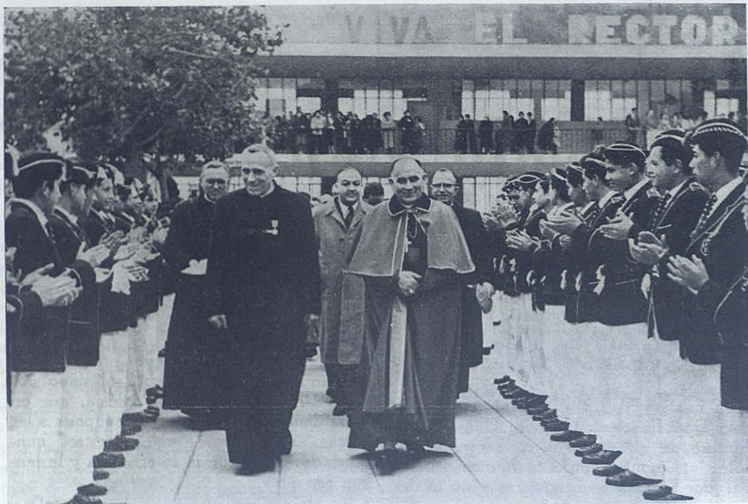
VALPARAISO.—Llegada del Rector Mayor al Colegio Salesiano.

con sus vistosos uniformes por la plaza de la Catedral. En las afueras de Talca, en Villa Colín , las Hijas de María Auxiliadora dirigen una escuela agrícola, que es visitada por el Rector Mayor.