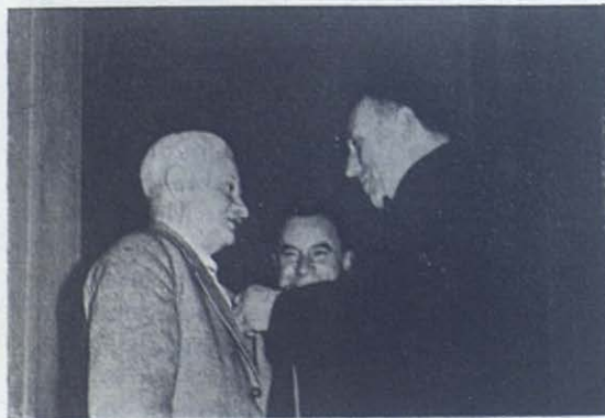
PUNTA ARENAS (Chile).—El Rector Mayor impone la Medalla de la Congregación al padre de un Salesiano.

Forman los alumnos y alumnas de nuestros colegios con uniforme. Una muchedumbre contempla entusiasmada el acto.