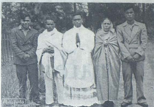
ASSAM (Indias).—Un nuevo sacerdote assamés rodeado de su familia el día feliz de su primera Misa.

BANGKOK.—Los Salesianos han añadido a sus muchas actividades una más que ha suscitado comentarios muy favorables: la de los Cursos de Religión por correspondencia. Numerosos católicos se han inscrito para poder instruirse mejor y especialmente para poder consultar los casos difíciles de aplicación de la ley cristiana en su vida diaria, pues han de vivir en una sociedad fuertemente impregnada de Budismo. También se han inscrito muchos budistas, con afán de conocer la Religión Católica que goza de muy buena fama en la nación. ANS.