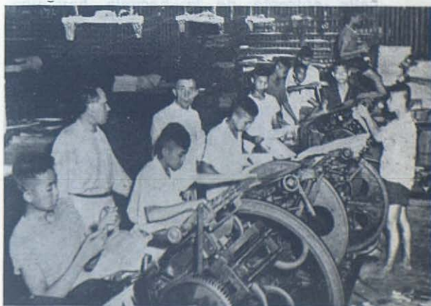
BANGKOK (Thailandia). — La im- prenta de las Escuelas Don Bosco.

Esta bendición del Cielo se concretó el día en que la señora del Primer Ministro