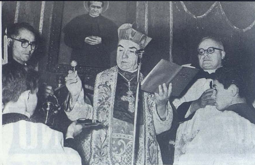
NAPOLIS. — El Cardenal Alfonso Castaldo bendice la sotana de los nuevos novicios salesianos de Portici.

finés y oponerse al error, como promover, sembrar y sostener las vocaciones sacerdotales y religiosas. Contra los activistas ateos, los activistas de la causa de Dios. No pueden olvidar los Cooperadores Salesianos que son parte viva e integrante de la Iglesia Católica, la cual urgentemente pide obreros para la viña del Señor.