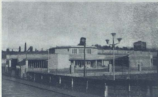
LLARANES-AVILES.—Vista del Grupo Escolar confiado a los Salesianos por ENSIDESA.