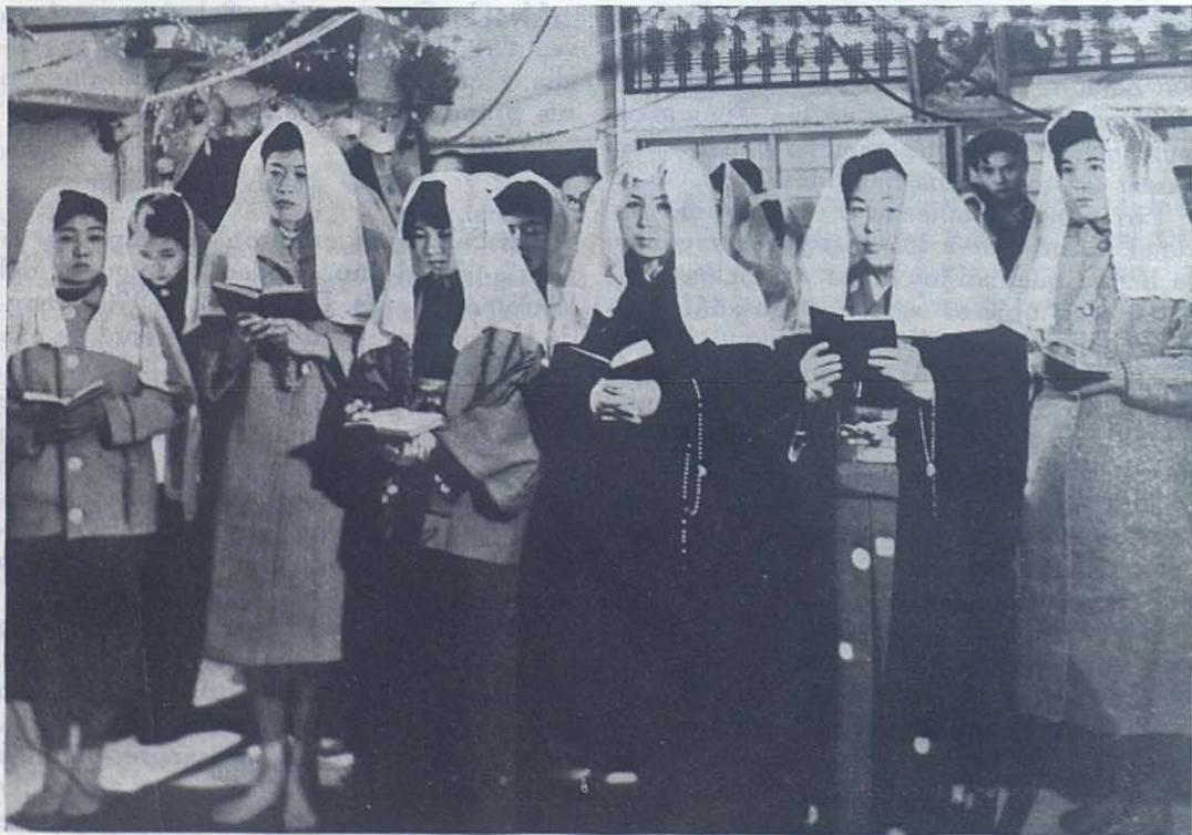
Navidad en la Misión Salesiana de Yokkaichi.—Muchachas japonesas católicas cantan himnos celebrando el gran acontecimiento de la Redención. Por respeto están descalzas.

En 1929 el misionero don Dalmasso, salesiano, cayó en manos de los comunistas. Monseñor se apresuró a escribirle. De sus