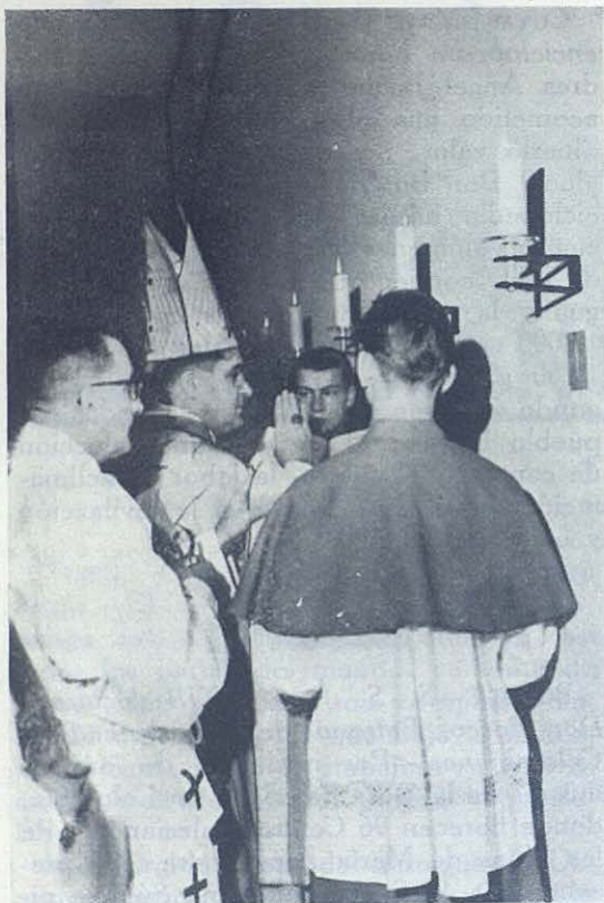
BERLIN OCCIDENTAL.—El Cardenal Döpfner consagra la nueva parroquia dedicada a San Juan Bosco.

«Aquellos que en la flor de la edad se preparan a ejercer en la vida un arte u oficio invocan y veneran con toda justicia a San Juan Bosco como Padre y Maestro eximio de su juventud. Por esta razón nuestro inmediato predecesor, Pío XII, deseoso de acrecentar cada vez más esta devoción, quiso consagrar con Carta Apostólica del 28 de enero de 1958 a todos los aprendices de Italia al mismo Santo Patrono. Ahora, secundando nuestra misma íntima persuasión, algunos ilustres personajes de la República de Colombia, donde la asociación de trabajadores llamada SENA está oficialmente constituida, nos ha dirigido la viva súplica de que declaremos a San Juan Bosco Patrono de los alumnos de las Escuelas Profesionales. Adhiriéndonos gustosísimos a esta petición, avalada por la recomendación de Nuestro