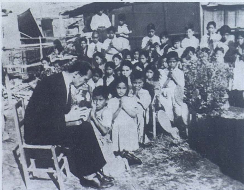
ORATORIO FESTIVO DE MORELIA - MEJICO. — Como en tiempos de Don Bosco, el sacerdote actúa en pleno patio, hasta para las confesiones.

Mientras estamos pendientes del prometido Mensaje de Fátima en este año 1960,