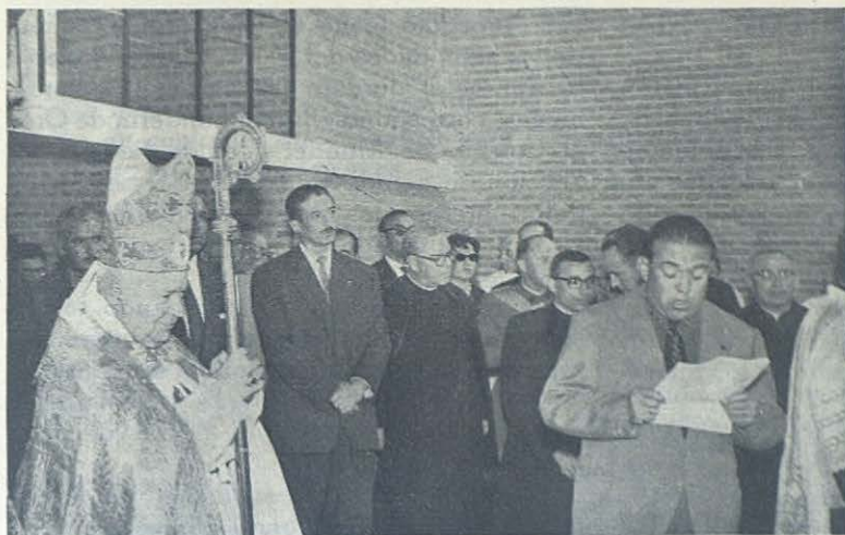
HERRERA DE PISUERGA. — Bendición del nuevo Colegio Salesiano. Arriba: el Sr. Alcalde en presencia del señor Obispo y del Excmo. Sr. Gobernador de la Provincia, del Ilmo. Sr. Presidente de la Diputación Provincial y Delegado de Juventudes ofrece el Colegio. Abajo: Aspecto del teatro durante su inauguración.

MEDINA DEL CAMPO. —En esta histórica ciudad ha adquirido la Congregación una hermosa finca con amplias y modernas edificaciones, que al presente se están adaptando convenientemente, para instalar en ellas el Estudiantado de Filosofía de la Inspectoría. Es un sitio ideal, rodeado de grandes extensiones de pinos, que forman un ambiente sano, muy a propósito para la juventud. En este curso y provisionalmente, se han instalado allí un grupo de seminaristas salesianos del primer curso de latín. Se proyecta también organizar en la finca una pequeña Granja-Escuela.