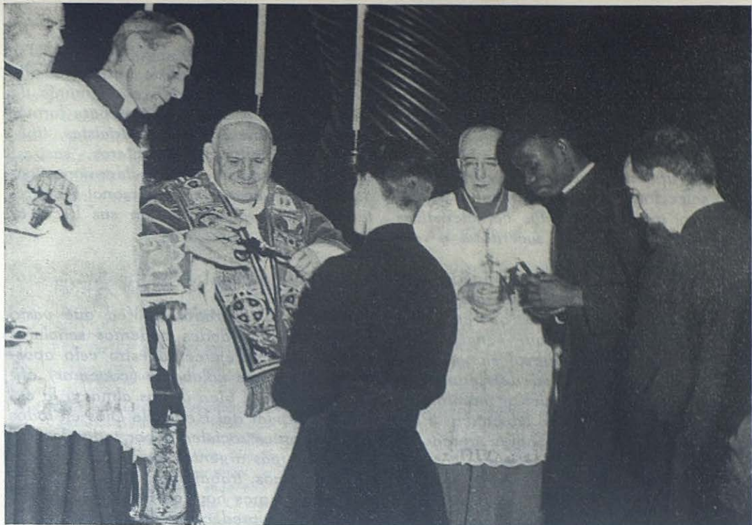
Su Santidad Juan XXIII entrega el crucifijo de misionero a más de 500 sacerdotes pertenecientes a diversas Ordenes Religiosas y Diócesis. Entre ellos había numerosos sacerdotes de color.

sianos la consigna: «Salvemos la moralidad», subdividiendo el trabajo según las posibilidades de los diversos grupos.