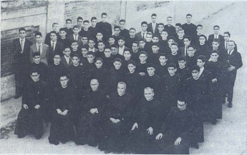
ARBOS DEL PANADES. — Los señores Inspectores de Barcelona y Valencia con los novicios de ambas Inspectorías en el día de la imposición de sotanas.

Durante el verano y participando todos los colegios de la Inspectoría, se organizaron diversas concentraciones en Lérida.