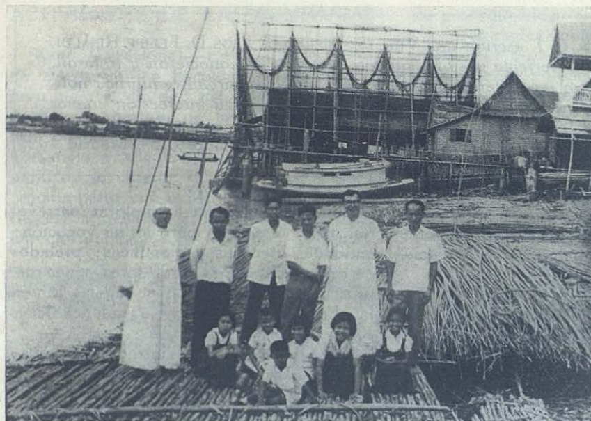
THAILANDIA.—Balsa de bambú; prontos para zarpar.