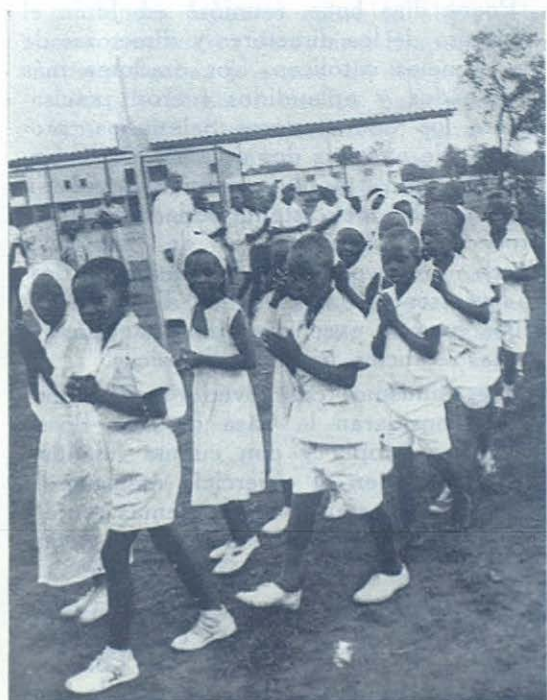
CONGO BELGA. —ELISABETHVILLE. — Caras negras y almas blancas.—Primeras Comuniones en la Parroquia Salesiana de Ruashi.