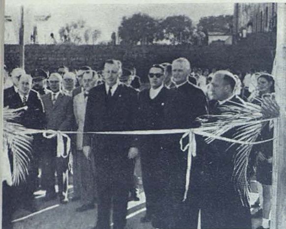
PARAGUAY. —El Excmo. Sr. Presidente de la República. General Alfredo Stroessner, en la inauguración de los nuevos pabellones de las Escuelas de Artes y Oficios.

borador de esta Institución, la primera de este género en el país.