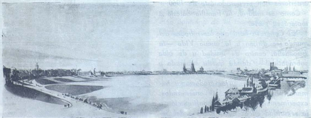
Plaza del Congreso, donde tendrán lugar los actos más importantes del mismo.