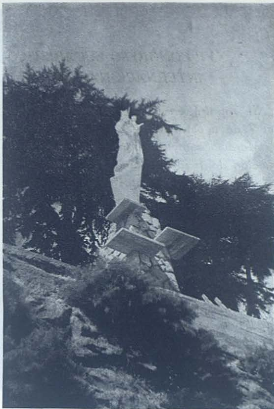
CHILE-VALPARAISO. — La monumental estatua de María Auxiliadora sobre la colina que domina la ciudad, junto al Instituto Salesiano.

en su libro sobre "El Sistema Educativo de Don Bosco" — al frente de su taller-escuela ejerce una especie de ministerio sagrado que, así como le honra sobremedida, le impone responsabilidades que son una garantía ante la sociedad. En tratándose de su arte debe ser poco menos que enciclopédico. Y no puede ser diversamente, pues "le incumbe dirigir de tal modo la instrucción técnica y profesional, que los jóvenes aprendices se adiestren en todo lo concerniente a su arte; desarrollar los programas según las aptitudes de los alumnos y las necesidades de los tiempos y lugares; ayudar eficazmente a los sacerdotes a fin de que los alumnos obreros progresen no solamente en el oficio, sino también en la cultura, en la Religión y en la virtud; mantener sobre la gente de fuera la superioridad moral que da la ciencia y el ascendiente que otorgan la