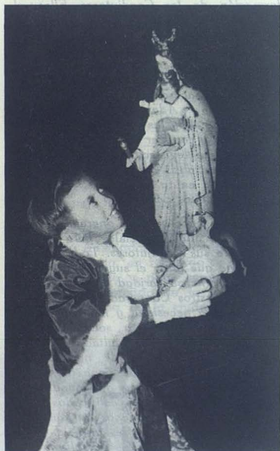
INDIA-MADRAS.—Niño anglo-indio del Colegio Salesiano. Para ellos la Virgen es siempre «la bendita Madre».

Constituid becas para la formación de Coadjutores Salesianos. Entendeos con nuestros Reverendísimos Inspectores o Provinciales. Os la agradecerán Dios y los hombres.