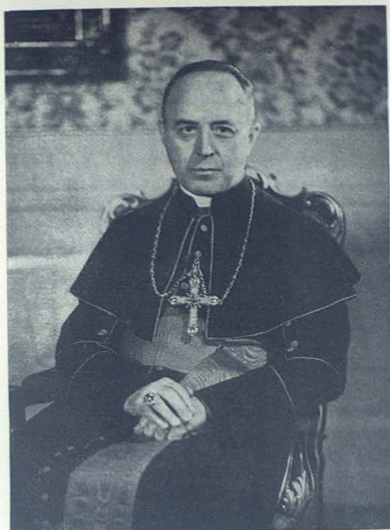
Su Eminencia el Cardenal D. José Wendel, Arzobispo de Munich.

sión de Jesucristo en el Cuerpo Místico por El creado; será la Misa el tema central del Congreso. 23 son las Comisiones que estudiarán el imponente programa. En las sesiones generales hablarán los más eminentes maestros. Habrá actos litúrgicos de extraordinaria importancia. Los Congresos anteriores han preparado éste de 1960.