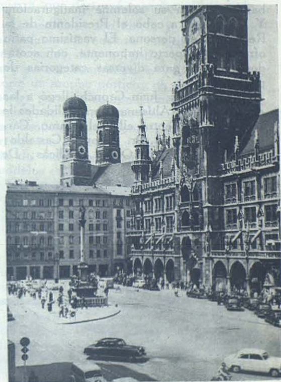
Plaza de María, en el centro de Munich.

Oremos por su éxito feliz y preparémonos a su celebración.