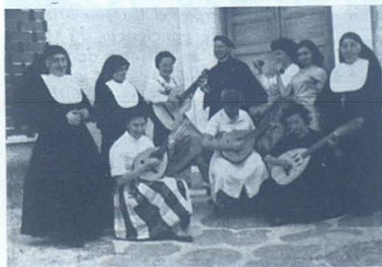
EL PLANTIO.—La rondalla se prepara para actuar.