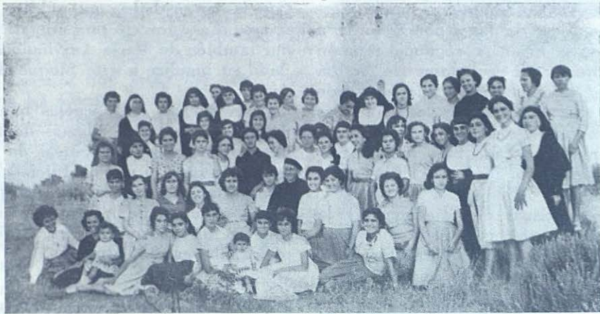
MADRID.—Grupo de jóvenes de los talleres de Pueblo Nuevo, que pasaron un mes de descanso en los pinares de El Plantío.

EL PLANTÍO (Madrid): Provechosas vacaciones. —Las Hijas de María Auxiliadora dirigen en Pueblo Nuevo un importante centro de artesanía. Un centenar de jovencitas lo frecuentan, al margen de las Escuelas Populares que allí mismo tienen, con otros centenares de niñas de enseñanza elemental y primaria y una simpática escuela maternal para párvulos de ambos sexos; los varoncitos pasan luego a las Escuelas «Domingo Savio», que no muy lejos de allí dirigen sus hermanos los Salesianos.