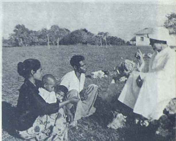
TIMOR. —La primera familia cristianizada por los Misioneros Salesianos en la Misión de Fuiloro.

El 8 de abril de este año el Revdmo. Prefecto General, D. Albino Fedrigotti, bendijo solemnemente una Gruta de Lourdes, muy original, adyacente a la espléndida Escuela Profesional de Kwangiu. Hallábanse presentes, además de los 1.100 alumnos, un buen número de Cooperadores y Cooperadoras Salesianos. En tal ocasión el Dr. Tomás Ció, no sin emoción, hizo entrega al amado Superior, y en él, a la Congregación, de aquel singular monumento consagrado a la Virgen, levanta-