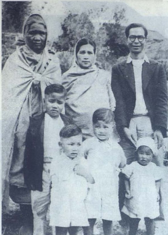
MISION DE SHILLONG (Assam).—La familia del Catequista, providencial auxiliar, del Misionero.