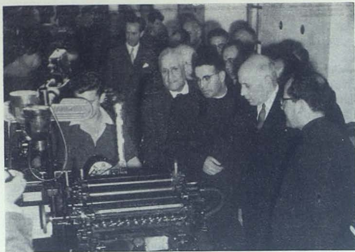
LISBOA.—El Presidente de la República visita las Escuelas Profesionales Salesianas, fundadas por el Venerable D. Miguel Rúa.