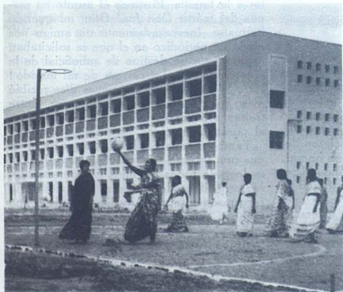
VELLORE (India). Nuevo Colegio de las Hijas de María Auxiliadora.