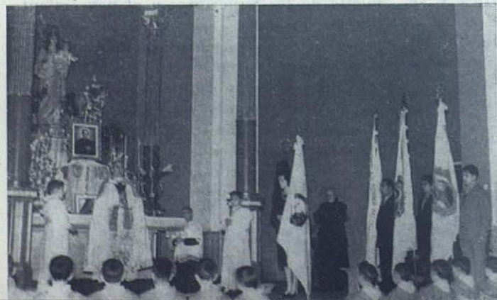
ZAMORA.—Bendición de la bandera de los Cooperadores Salesianos.

El Presidente de la Diputación y el Director del Colegio-Hogar «Calvo Sotelo» recibieron, a la entrada, a las autoridades e invitados, que pasaron, en primer lugar, a la capilla, donde oraron breves instantes.