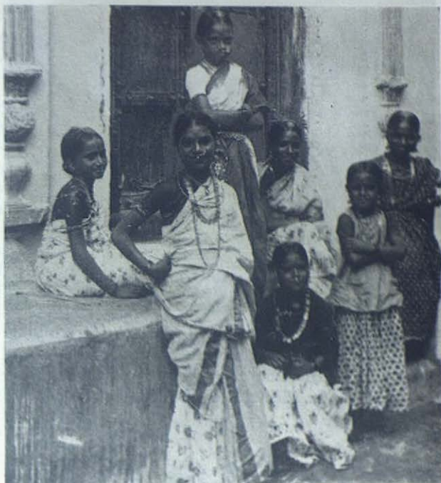
Familia india vestida de fiesta.

de mí; buscaron un amigo católico, y éste me llevó a nuestra Procura. Así terminó mi odisea nocturna. Entretanto, mi «salvador» me dijo que deseaba ardientemente estudiar a fondo la Religión Católica, porque en el budismo no había encontrado lo que su alma buscaba y necesitaba. Al día siguiente volvió, y lo dejé con la vida de Jesús y un catecismo explicado. Todo es providencial en el mundo. ¿No podrá decirse que el accidente del malentendido lo dispuso Ella para mi encuentro con este jovencito? Pero aquellos a quienes conté mi aventura me reprocharon el no haber dicho en el aeropuerto que buscaba a «Don Bosco», porque seguramente habría ido inmediatamente a la Casa.