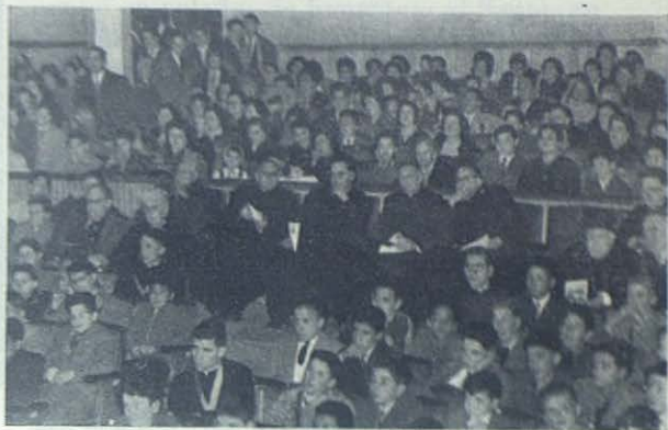
BARCELONA - SARRIA. — Asistentes a la Conferencia de los Cooperadores Salesianos, el 31 de enero.

Figuran en esta exhibición numerosos trabajos manuales y dibujos artísticos y lineales, y una serie de gráficos, fotografías y otras ilustraciones que reflejan la gran obra salesiana de formación del obrero en el taller o en la clase. Todas las secciones de la exposición: Artes Gráficas, Calzado, Carpintería, Corte y Confección y Mecánica, fueron grandemente elogiadas y recorridas por numeroso público asisten-