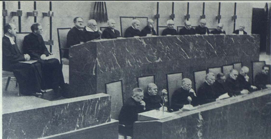
MADRID: Congreso de la F. E. R. E.—La Presidencia.

nos da algunos datos interesantes, de los cuales destacamos éstos: