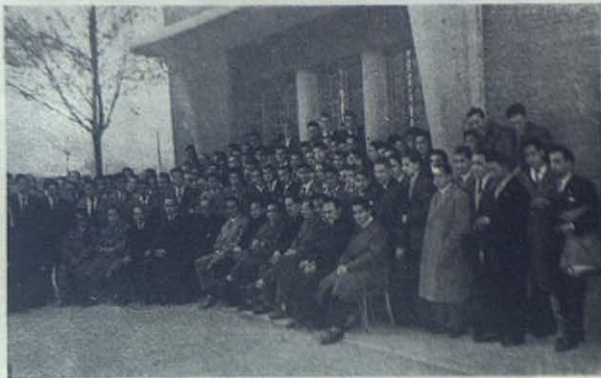
PAMPLONA: Alumnos y Antiguos Alumnos en la fiesta de San Francisco Javier.