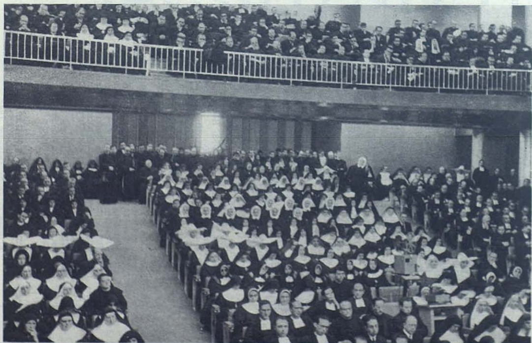
MADRID: Congreso de la F. E. R. E.—Un aspecto del salón.