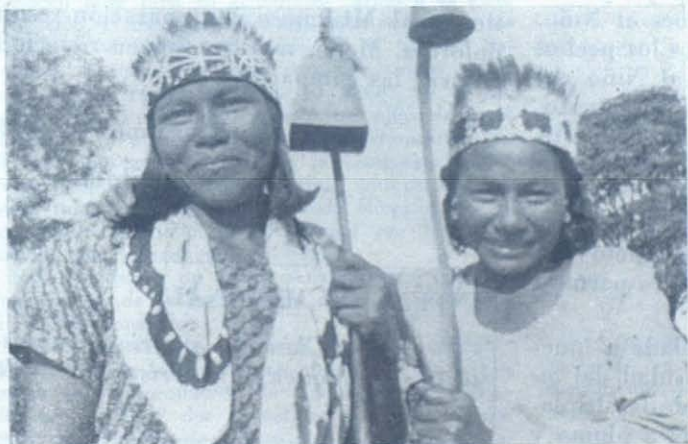
Mujeres angaitas vestidas de fiesta.

También los Khasis creen que cuando Dios creó al hombre, la paz reinaba en el mundo. El pecado, el dolor, la injusticia eran desconocidos. Dios había hecho pacto con los hombres, y la paz reinaría mientras los hombres fueran fieles al pacto. Pero el hombre pecó. Cayó así el puente que unía al cielo con la tierra; rota la alianza, el pecado empezó a reinar en el mundo, y con el pecado todos los ma-