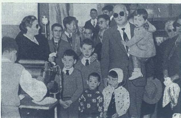
CÁDIZ: Bendición de la máquina de imprenta «Santiago Apóstol».

CÁDIZ. —Con motivo de las fiestas en honor de la Purísima, tuvo lugar en las Es-