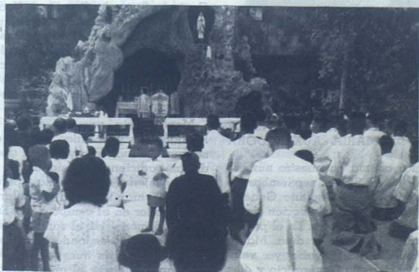
Inauguración de la Gruta de Lourdes en BANGKOK-KUEK (Thailandia).