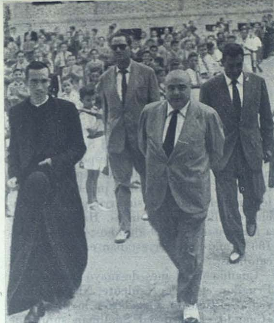
El Excmo. Sr. Alcalde de Murcia visita la Casa Salesiana de Cabezo de Torres.

arrollando los Salesianos en esa barriada extrema de la ciudad.