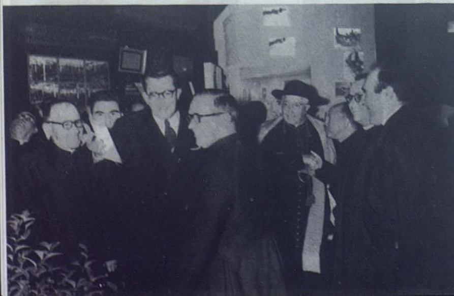
MADRID. — Semana de la Formación Profesional. Otro aspecto de la visita a la Exposición de Trabajos.