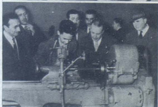
Sevilla: Diversos aspectos de la visita del señor Ministro de Trabajo a la Universidad Laboral.