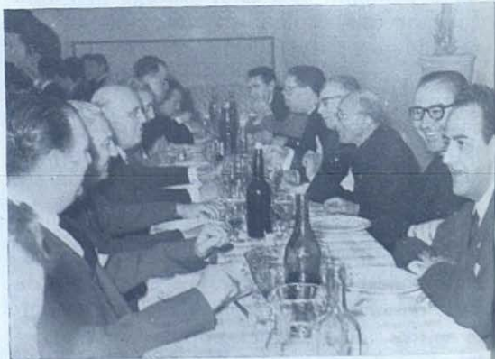
Madrid: Colegio San Miguel. Antiguos Alumnos Salesianos en ágape fraterno durante su reunión anual.

MADRID.— Colegio Salesiano de San Miguel (Paseo de Extremadura). Reunión de Antiguos Alumnos. —Como todos los años también ahora se reunieron para «la Fiesta de la Unión» los antiguos alumnos del Colegio de Carabanchel, —trasladado después de la guerra al Paseo de Extremadura—. Eran algo más de 200. Algunos vinieron desde lejos. Como cuando niños, con-