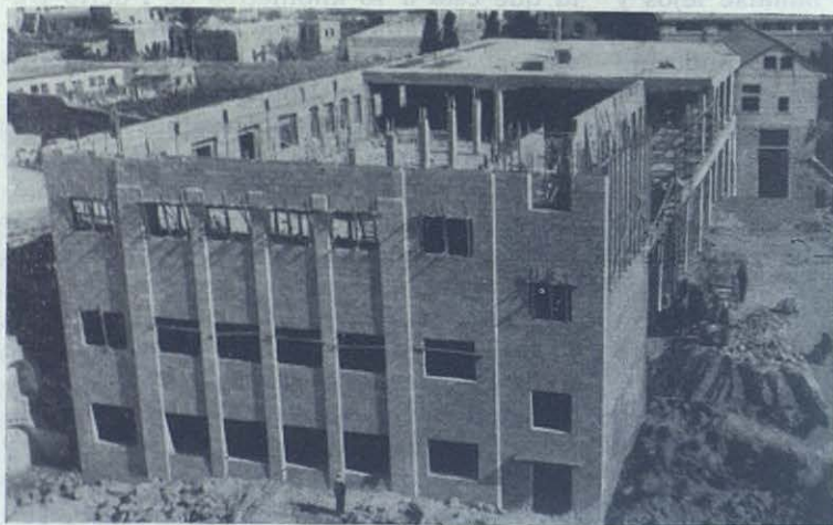
Nazareth: Escuelas Profesionales Salesianas dedicadas a Jesús Obrero y a San José Artesano.