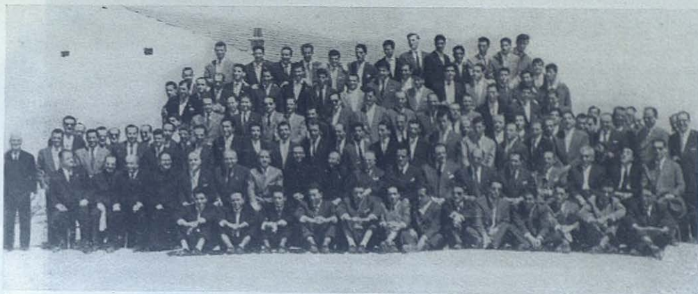
Madrid: Colegio San Miguel. Grupo de Antiguos Alumnos asistentes a la reunión llamada «Fiesta de Unión».