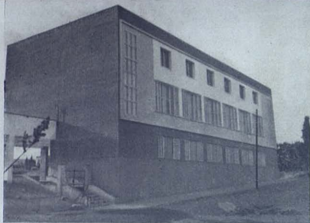
Tarrasa: Nueva obra popular salesiana. Aspecto parcial.