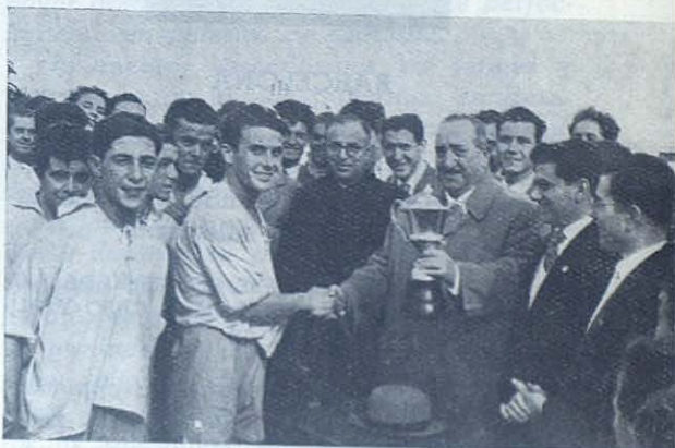
PUERTO REAL. — El Sr. Director Técnico entrega la Copa «San Juan Bosco» al capitán del equipo vencedor.

Vigo. —Tanto en la ciudad como en Bouzas pueden calificarse de solemnísimas las fiestas. Programa muy denso, en el que