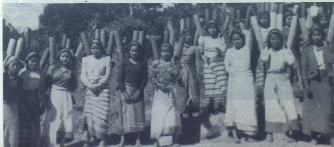
ASSAM.—Así se lleva el agua del río a las casas: vasijas de bambú.

De las calles de Shillong sube un fru fru como de enjambres. Afuera, las calles son una inmensa marea humana. Los hindúes avanzan con sus vestidos rozagantes y van a ofrecer incienso, flores y regalos a la diosa Durga Puya. Los altavoces vuelcan so-