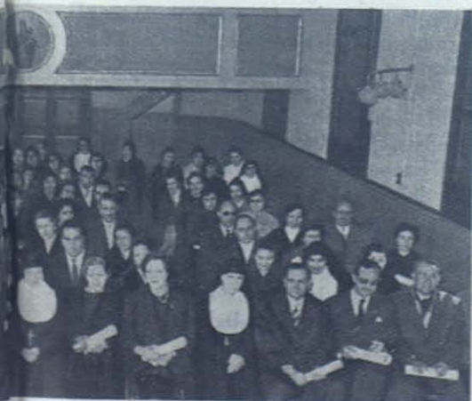
Centro inaugurado en BARCELONA. Después de la conferencia y distribuidos pomas.