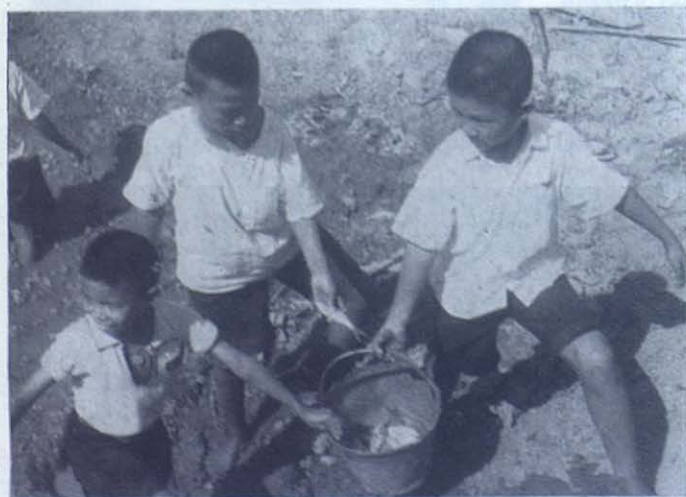
RATBURY.—Niños seminaristas en la pesca. Con el tiempo serán «pescadores de hombres».

Peregrino, ¿no has percibido pasos silenciosos?