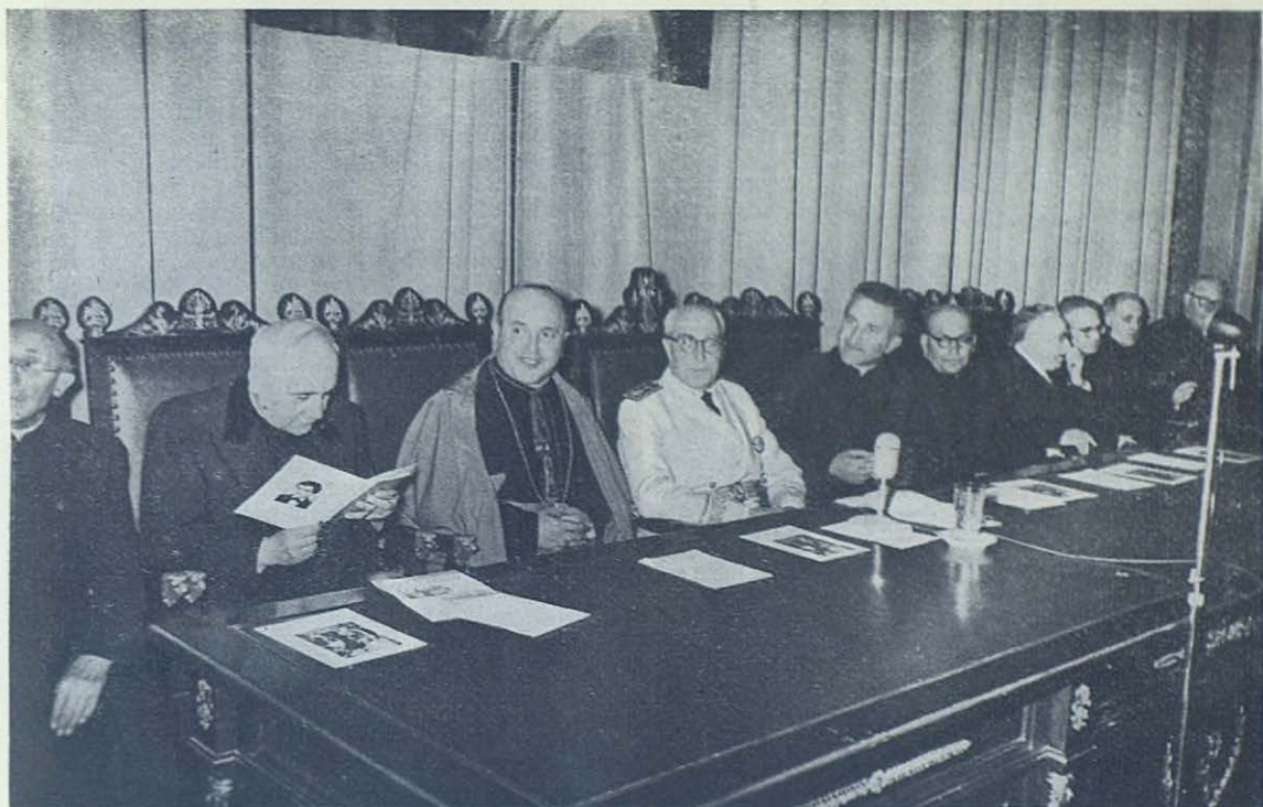
Tercera sesión del Congreso, presidida y abierta por el Excmo. D. Joaquín Planell, Ministro de Industria.

práctica, que el sistema educativo de Don Bosco, todo cariño y comprensión, es adaptable a todas las situaciones y a todos los estamentos de la sociedad. Sus palabras causaron profunda impresión, y fueron una verdadera lección objetiva del Sistema Preventivo.