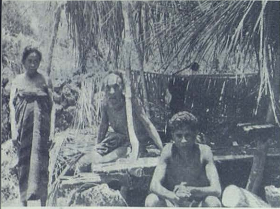
MISION DE FUILORO. —Últimos días del Rey de Nari.

De la mujer no hablan, porque les parece lógico que la creara también para que le hiciera compañía. Y prosigue: