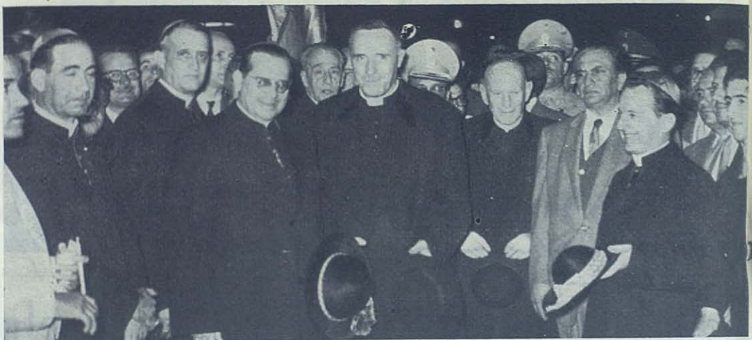
CARACAS (Venezuela).—Apotéosis recibimiento del Rvdo. Rector Mayor D. Renato Ziggotti en el aeropuerto internacional de Laquetia. Entre los presentes, los Excmos. Señor Nuncio de S. S., Señor Arzobispo de Caracas, Señores Obispos salesianos de Coro y Puerto Ayacucho y multitud de personalidades antiguos alumnos salesianos.

antiguos alumnos, al frente de la multitud de ellos, y muchos simpatizantes de la Obra Salesiana.