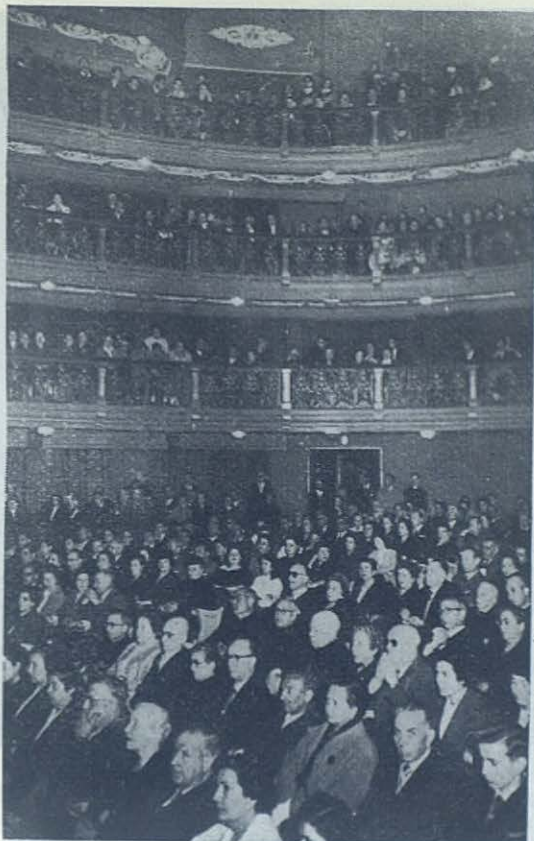
Aspecto del Teatro Español en el acto de clausura del Congreso.