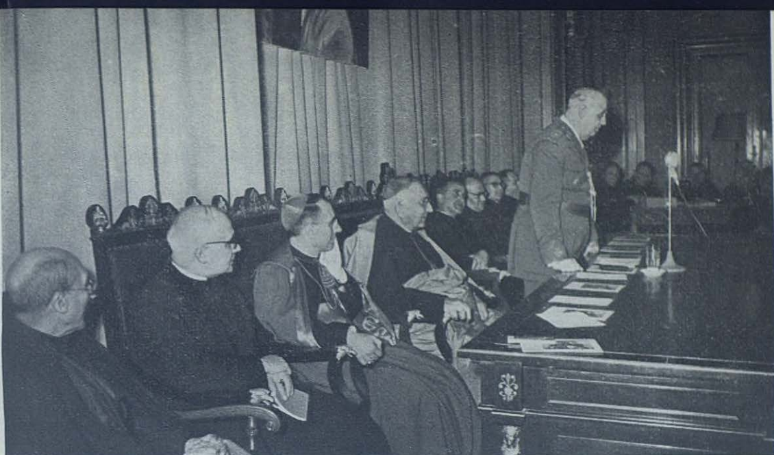
Segunda sesión del Congreso, presidida y abierta por el Excmo. D. Antonio Barroso, Ministro del Ejército.