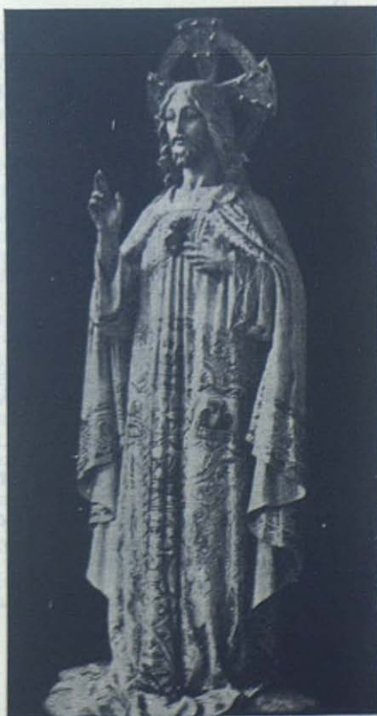
Imagen del Sagrado Corazón que se venera en la cripta del Templo Nacional Expiatorio.