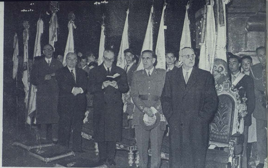
Presidencia de autoridades que asistieron al solemne pontifical.