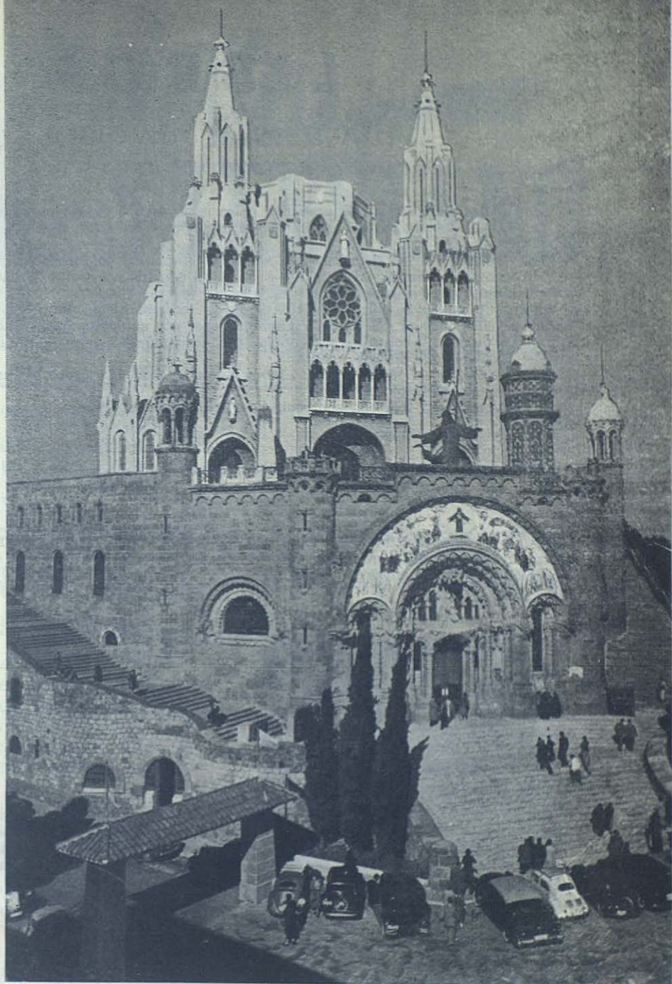
TEMPLO EXPIATORIO DE ESPAÑA AL SAGRADO CORAZON, EN LA CUMBRE DEL TIBIDABO, BARCELONA.

Lo profetizó San Juan Bosco en su visita a nuestra patria el año 1886, cuando nadie aún podía sospechar la gran importancia que al correr de los años adquiriría esta montaña. En el Congreso Eucarístico Internacional de 1911, celebrado en Madrid, fué declarado Templo Expiatorio de España. Celebrándose este año el LXXV aniversario de la llegada de los primeros salesianos a España, será escenario de importantes actos, con motivo del Congreso Nacional de Antiguos Alumnos Salesianos, que tendrá lugar en Barcelona en el próximo mes de octubre. Se aprovechará esta circunstancia y la presencia del Reverendísimo Superior General P. Renato Ziggitti para la inauguración de varias obras realizadas en el templo durante estos últimos años.