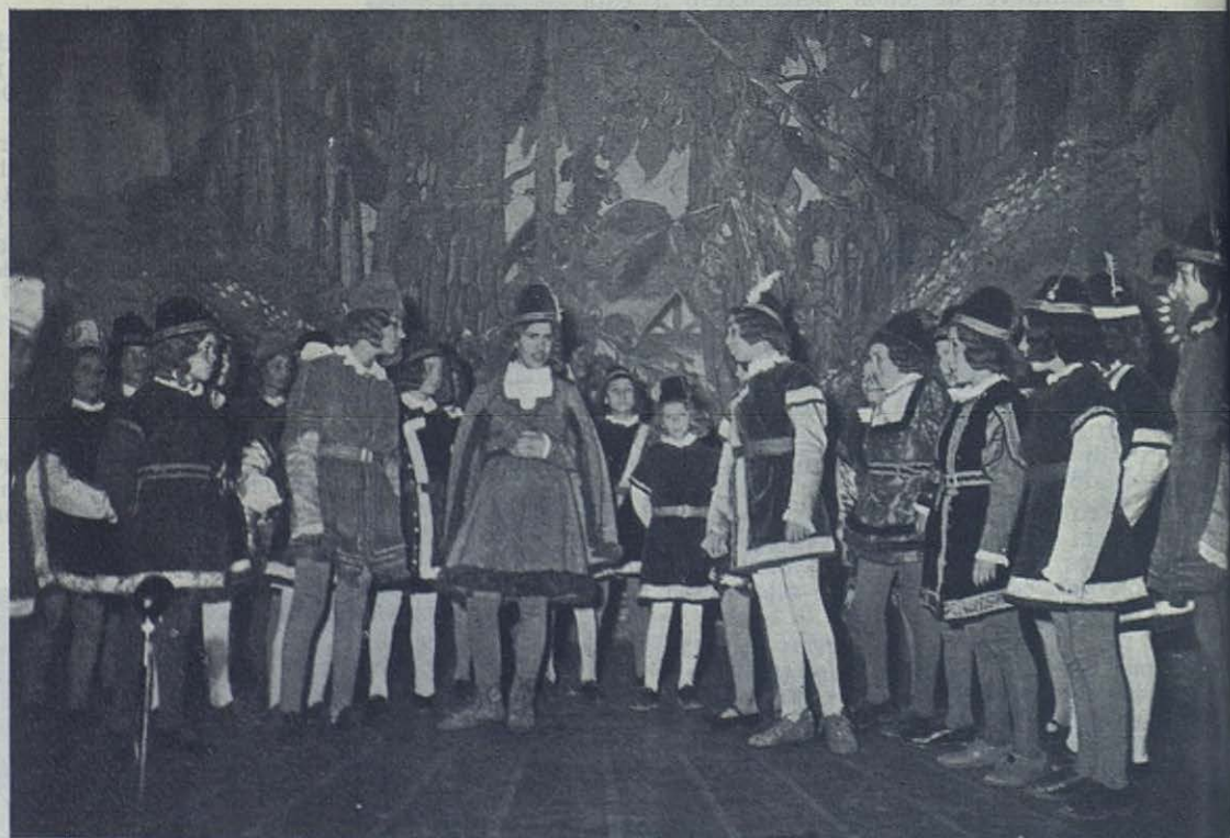
FOTO SUPERIOR. —Las alumnas de las Salesianas. FOTO INFERIOR. — Los alumnos salesianos. Unas y otros actuando en la clausura del Congreso en el Teatro Español.