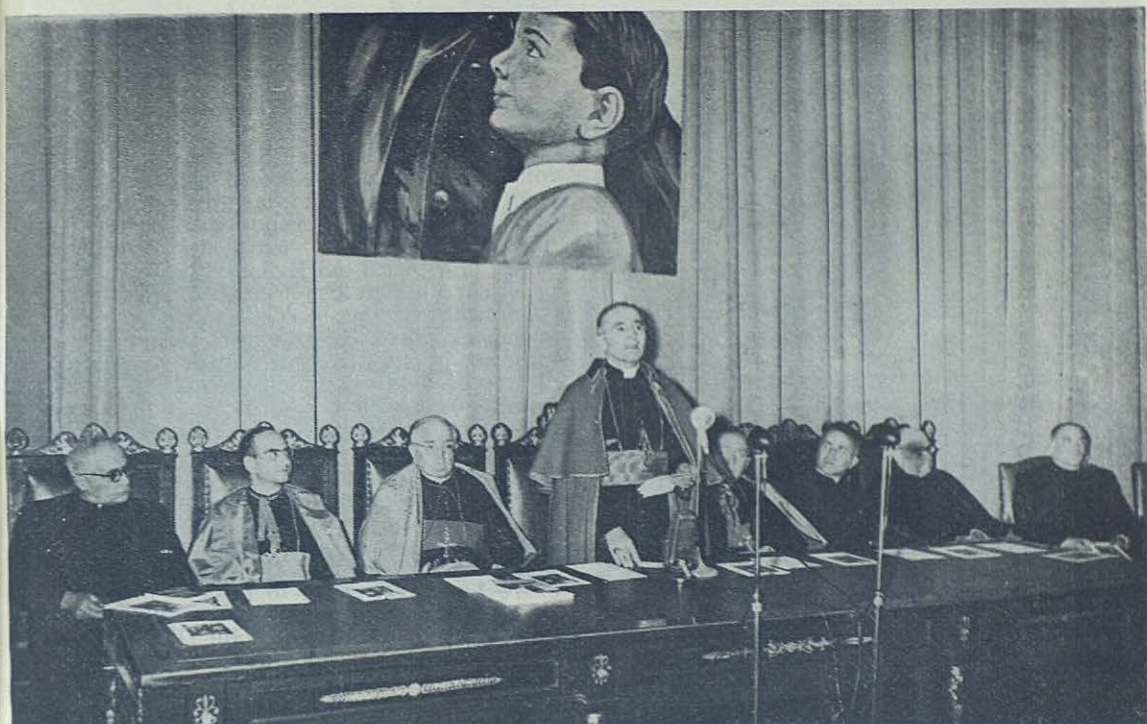
El Excmo. Sr. Nuncio de S. S. en la presidencia y apertura del Primer Congreso Nacional de Cooperadores Salesianos.