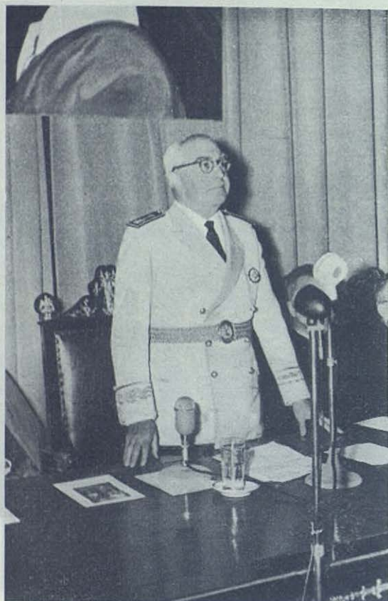
El Excmo. Sr. Ministro de Industria durante las palabras de apertura.

desarrollo de la piedad entre el pueblo, etcétera. La cooperación salesiana es ante todo un medio de santificación personal para ejercer provechosamente el apostolado con los métodos salesianos y según el espíritu de San Francisco de Sales, practicado por Don Bosco. Toda Casa Salesiana organiza y dirige su Centro de Cooperadores, y el Provincial y la Provincial los superdirige y anima.