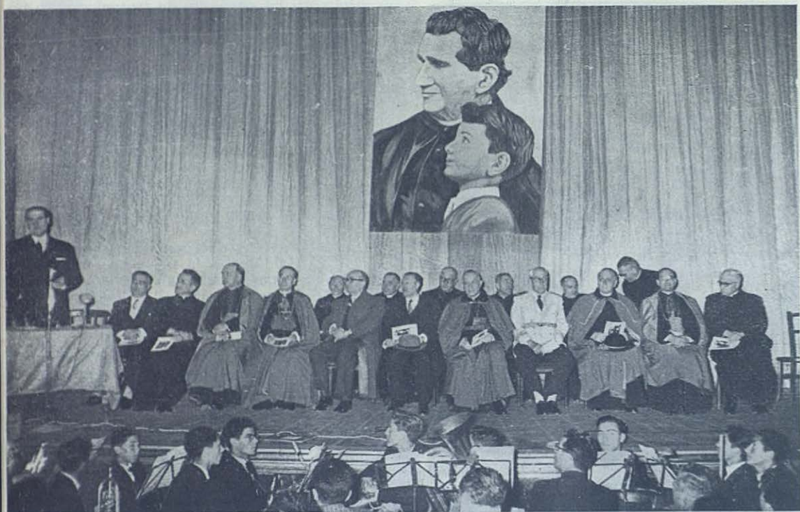
Sesión de clausura del Congreso que tuvo lugar en el Teatro Español. La presidencia del acto.

porque poseen los métodos de San Juan Bosco y el espíritu de San Francisco de Sales. Es necesidad imperiosa, ya que Dios ha tenido a bien asociar al hombre en todas sus obras sobre la haz de la tierra, y requiere en todo momento la colaboración humana para hacer los milagros.» Añadió que la caridad, base fundamental de la actuación salesiana , es eminentemente genética y obliga a un crecimiento progresivo. La caridad no puede ser estática : impone un esfuerzo continuado y progresivo; por eso Don Bosco procuró, y mandó a sus hijos, ir siempre a la vanguardia del progreso. Enumeró las principales obras salesianas, en que pueden o deben cooperar los Cooperadores.