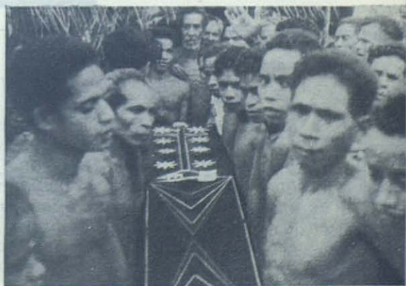
MISION DE FUILORO. —El hijo mayor del Rey de Nari, presidiendo el entierro de su padre llevado al sepulcro por los nietos.

Agradecemos profundamente a nuestros bienhechores y cooperadores las li-