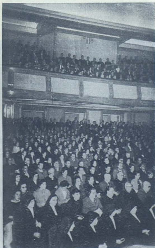
Aspecto que ofreció todos los días el salón del Instituto Nacional de Previsión, donde tuvieron lugar las reuniones.

Relató cómo fué creada la Obra en una época de ruinas y de lágrimas, para remediar las necesidades del mundo por medio del ejercicio activo de la caridad, vivificada por la piedad , con obras espirituales y materiales, de justicia y socorros materiales, de instrucción y guía. Y aunque la acción se extienda a todos los sectores de la sociedad, su campo primordial es la juventud , especialmente la que se encuentre más ne-