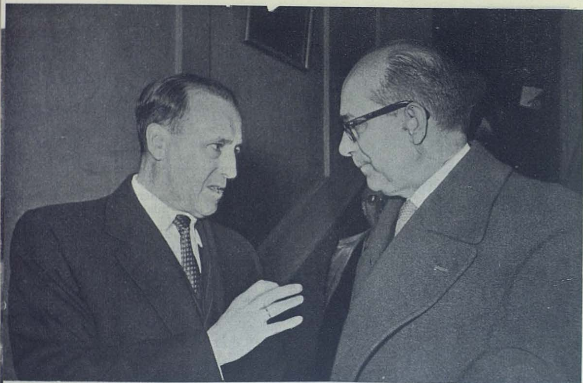
Excmo. Sr. Ministro de Trabajo, Sanz Orrio y Excmo. Sr. Ibáñez Martín, Presidente del Consejo de Estado.

co en su familia, en su profesión y en el ámbito de la sociedad a que cada uno alcanzase.