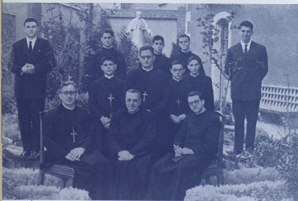
Segunda Expedición: Salen del Estudiantado Filosófico de San Vicente dels Horts, Barcelona.