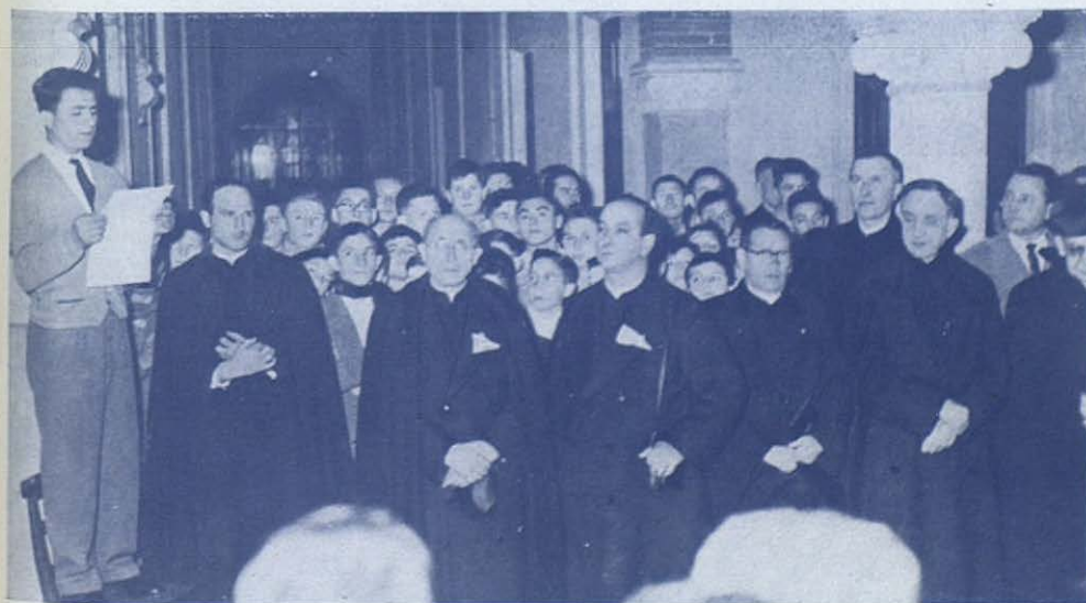
Presidentes y Consiliarios reciben el saludo.