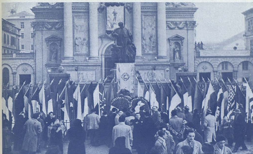
Ante el monumento del Padre.