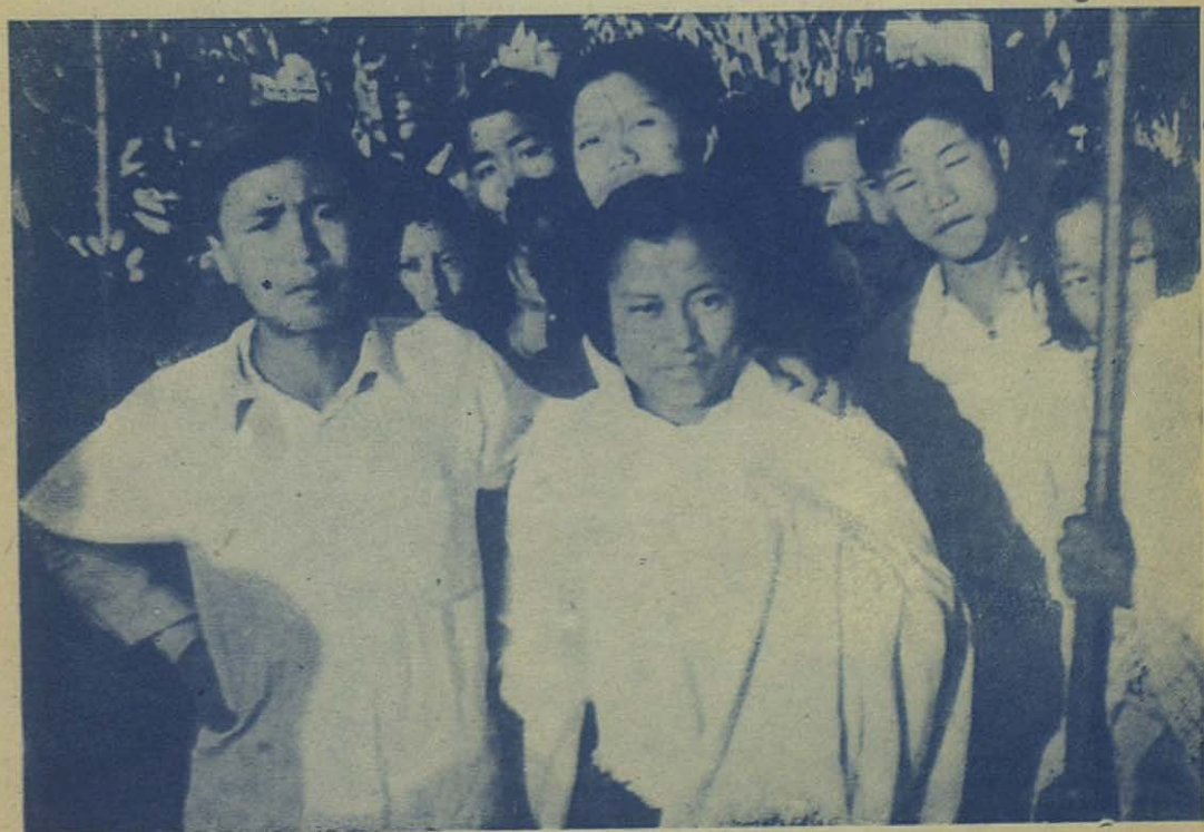
ASSAM (India).—Joven matrimonio católico de las tribus Naga (Misión Salesiana)

"Los mensajeros y propagadores de la verdad y de la virtud cristianas, que mueren lejos de sus patrios lares en el ejercicio de este tan santo ministerio, son semillas de las que algún día, cuando Dios disponga, brotarán ubérrimos frutos. Por eso el Apóstol San Pablo afirmaba: "Nos gloriamos hasta en las tribulaciones", y el Obispo mártir San Cipriano, consolaba y animaba a los