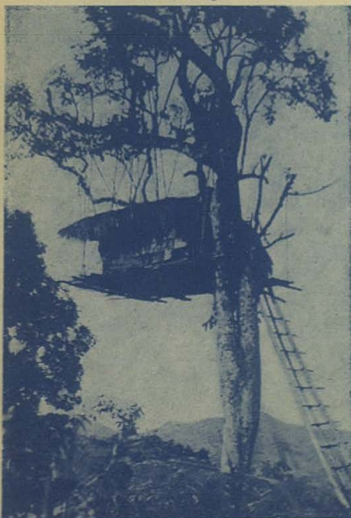
ASSAM (India).—Casa «Mikir», verdadero palafito... natural

Estos indígenas son blancos, de talle esbelto y proporcionado; ellos mismos se preocuparon de aprender las palabras portuguesas y propagarlas entre sus propias familias, formándose así un nutrido vocabulario. Su curiosidad natural promete un cierre de relaciones amistosas con los misioneros salesianos, causando admiración su interés y simpatía por todos los objetos religiosos y por todas las noticias de los misioneros que les visitan.