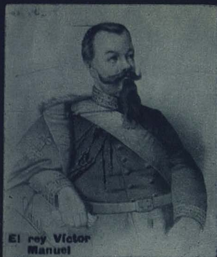
El rey Víctor Manuel