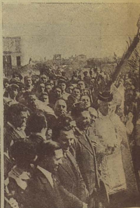
El Excmo. señor arzobispo do bendice, el 18 de marzo de 1928 de cien viviendas que van a leva las dignísimas autoridades vale sianos y numerosos antiguos al

BODAS D DE COOPERATIVA BARATAS, “ DON B ANTIC ALUMNOS S VALEN