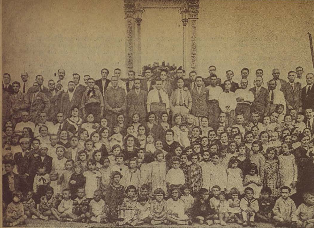
Grupo numeroso de cooperadores y familias ante el retablo del titular San Juan Bosco, en una tarde de fiestas del año 1932