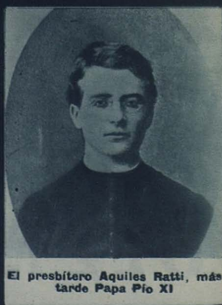
El presbítero Aquiles Ratti, más tarde Papa Pío XI