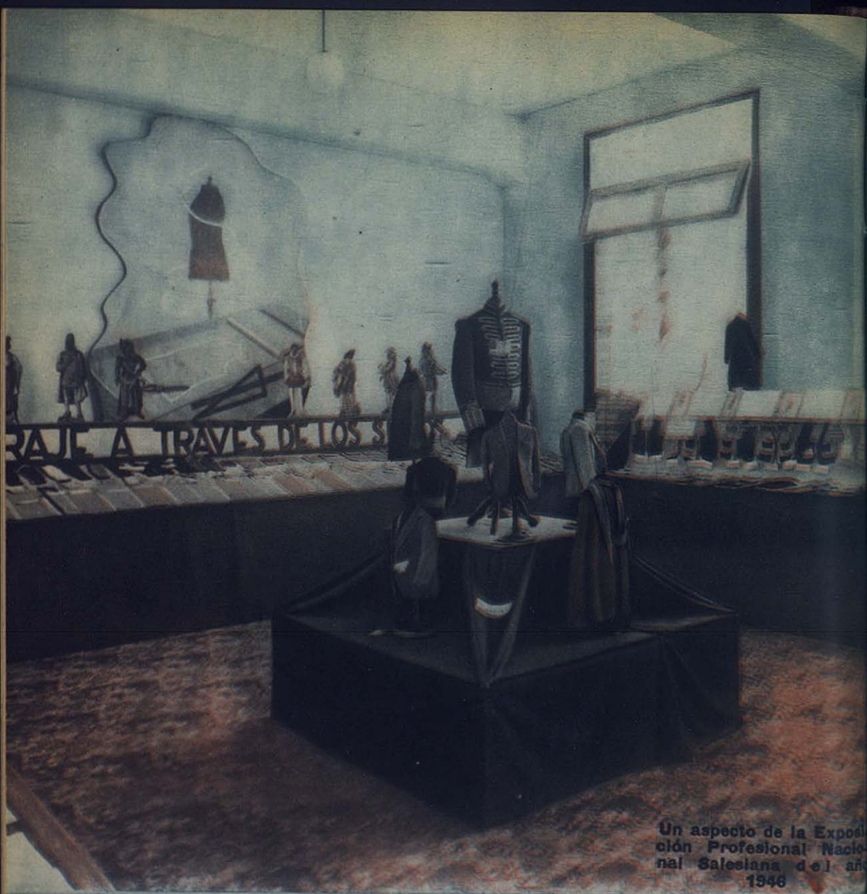
Un aspecto de la Exposición Profesional Nacional Salesiana del año 1946