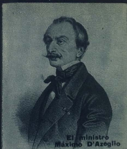
El ministro Máximo D'Azéglio