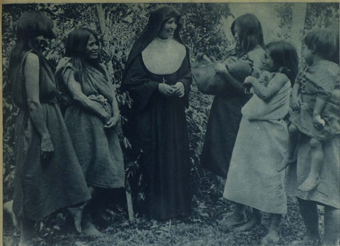
VICARIATO APOSTOLICO DE MENDEZ (Ecuador).—Una Hija de María Auxiliadora catequizando a unas mujeres jíbaras