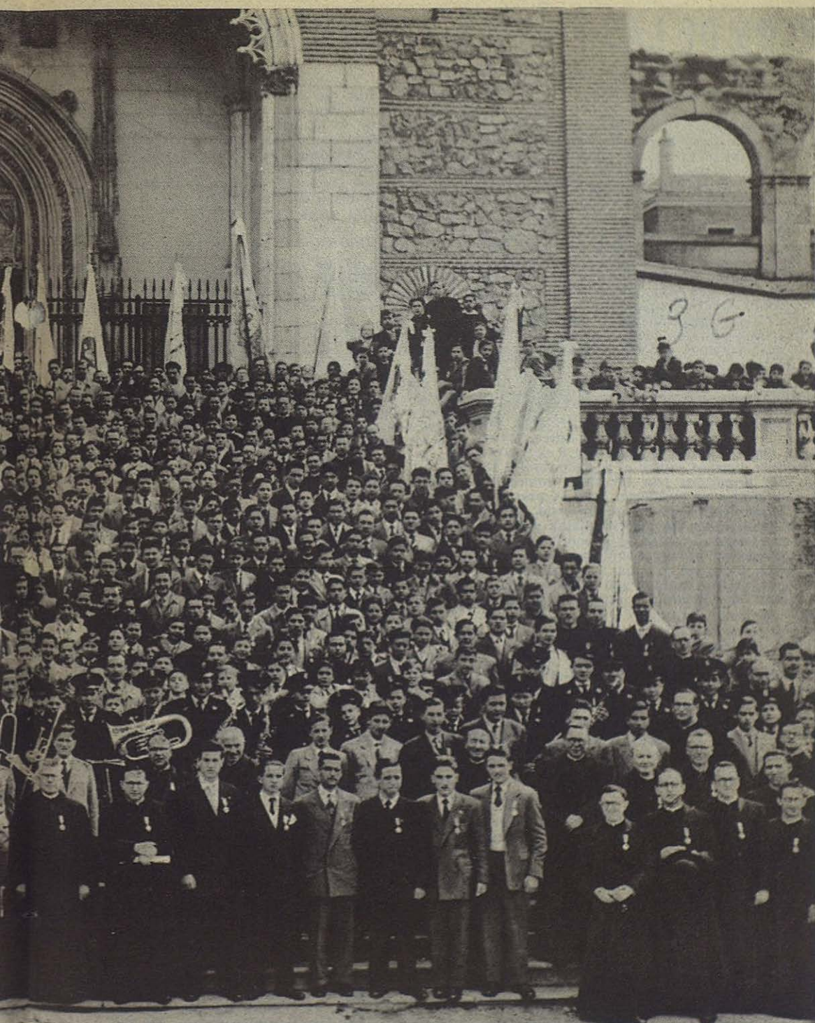
oda España, obtenido ante la fachada del templo de San Jerónimo el Real (Madrid) al clausurar el Antal, catequista general de la Congregación Salesiana