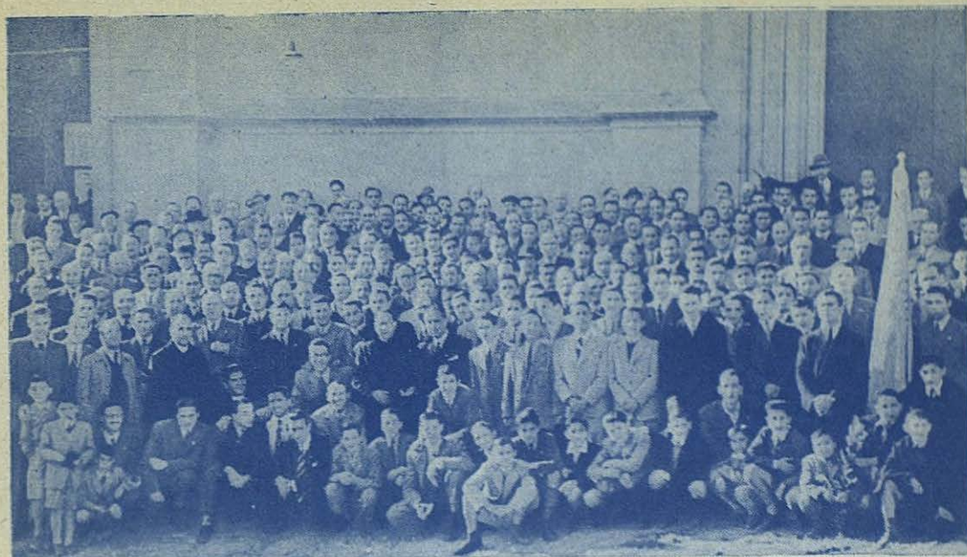
Nutrido grupo de Antiguos Alumnos Salesianos de Vigo, que con tanto fervor y provecho practican anualmente los Ejercicios Espirituales

Víacrucis del viernes y la comunión numerosísima del domingo, con lo que se clausuró la tanda, reuniéndose luego todos en amistoso desayuno.