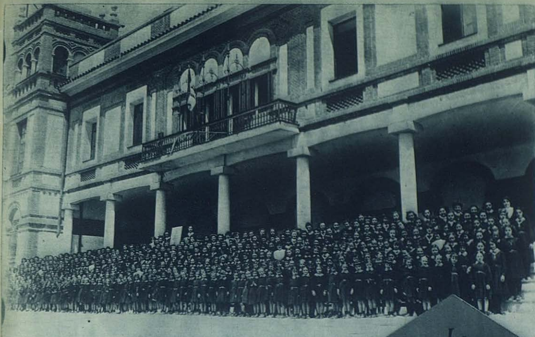
Arriba: Un grupo numeroso de alumnas de las Hijas de María Auxilladora, quienes, al igual que los Salesianos, se dedican a la educación de la juventud bajo la guía de la Pedagogía de Don Bosco