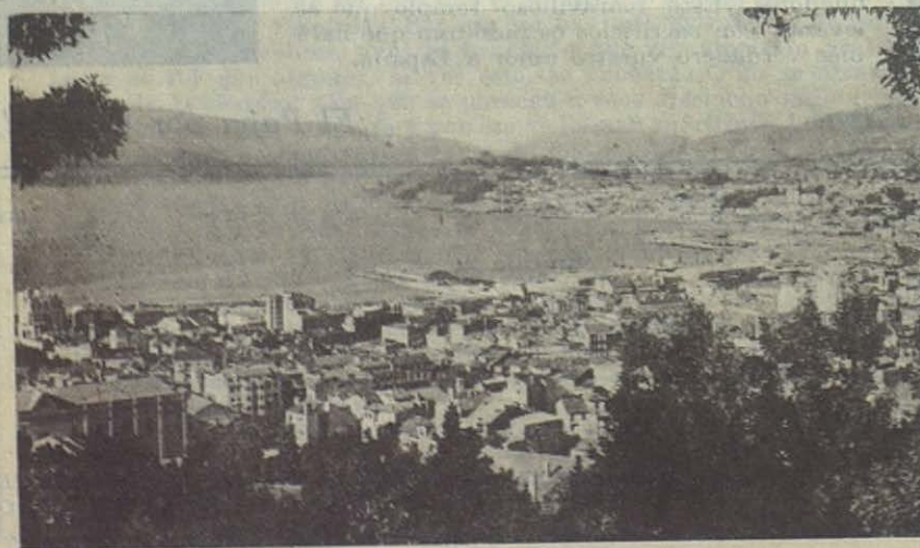
Vista general de Vigo, la ciudad tan salesiana, que cuenta con una formidable Asociación de Antiguos Alumnos