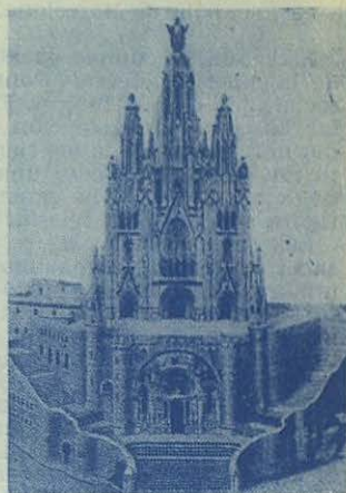
Templo Nacional Expiatorio que se levanta con sacrificios en la cumbre del Tibidabo, Barcelona. Teléfono 27 83 67.

Los enemigos de Dios y de España arrasaron la cripta completamente. Hoy, rehecha y más hermosa que antes, bendecido, aunque no terminado, el majestuoso templo en ocasión del Congreso Eucarístico Internacional, son ya meta estos santos lugares de fervorosas peregrinaciones, no sólo nacionales, sino también extranjeras, sobre las cuales el Divino Corazón derrama sus misericordiosas bondades.