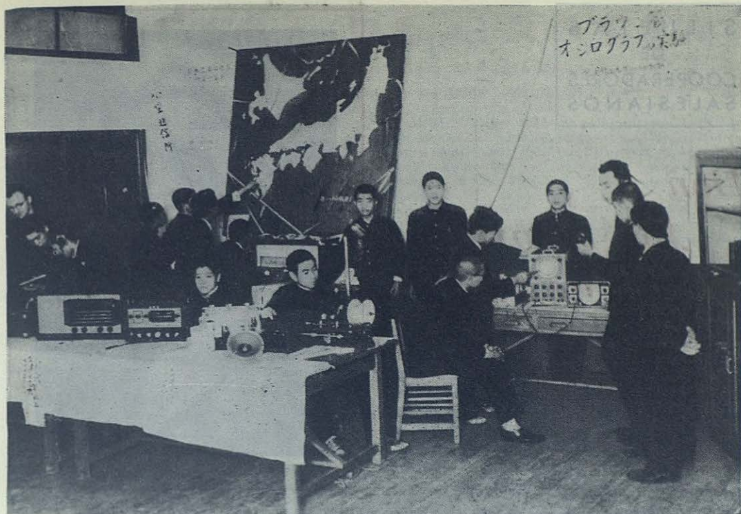
TOKIO.—Escuelas «Don Bosco».—Exposición profesional 1952. Sección de electricidad

última hora. Por ello se niega rotundamente a entregar el Crucifijo, que consigo lleva, a los milicianos que se lo quieren arrebatar; se arrodilla y estampa un fervido beso en el Mártir Divino; luego se signa y comienza a caminar en dirección del río con el Crucifijo en una de sus manos. Varios milicianos van desplegados tras él; suena una descarga y cae de bruces el mártir. El antiguo Profesor del Seminario de Almería y nuevo soldado en el Ejército de Don Bosco bendiga desde el cielo a España, a Almería y a la Congregación Salesiana.