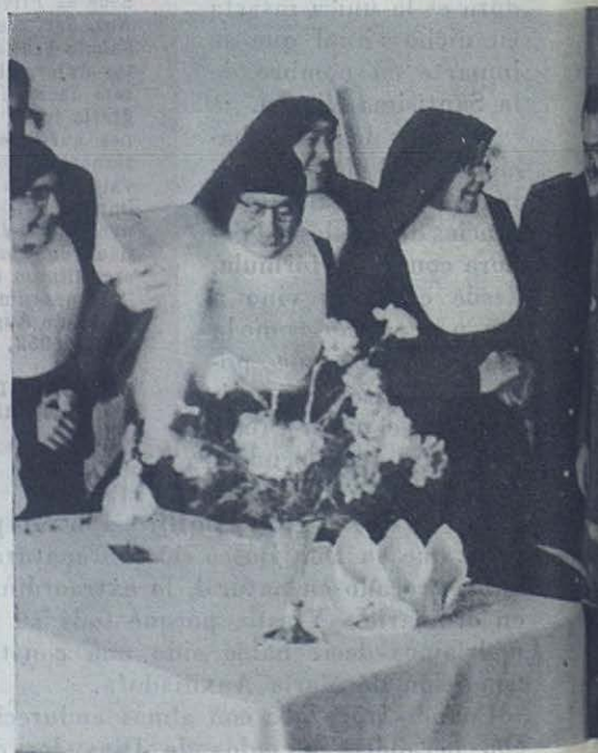
El Caudillo de España visita la Casa que...