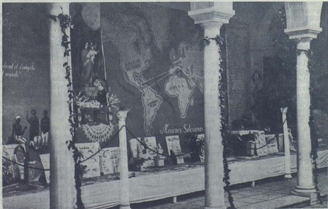
MALAGA.—Un aspecto de la sección salesiana en la Exposición Misional Diocesana, recientemente celebrada bajo los auspicios del excelentísimo Prelado don Angel Herrera Oria