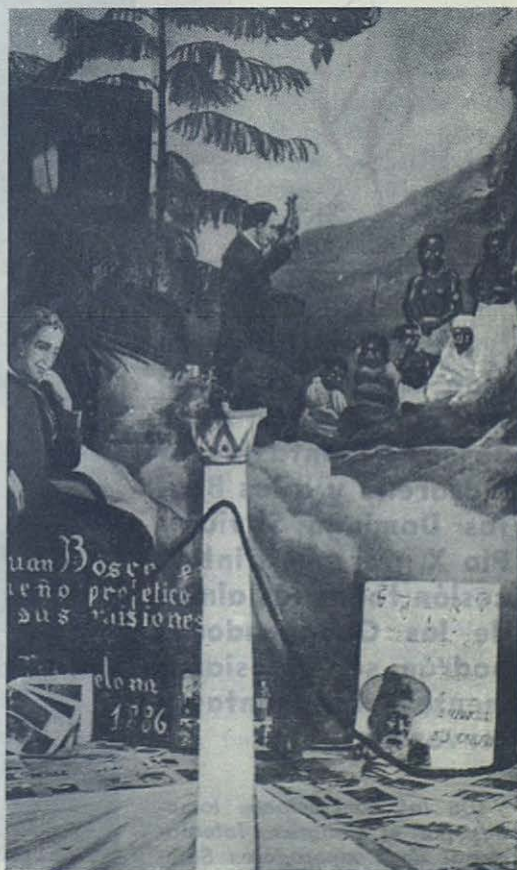
MALAGA.—Otro aspecto de la Exposición Misional

Por eso, este buen suceso de Santo Tomás de Villanueva, más que dar él a su Patronato cuantos recursos puede, en cambio del ideal de que no haya maestro que