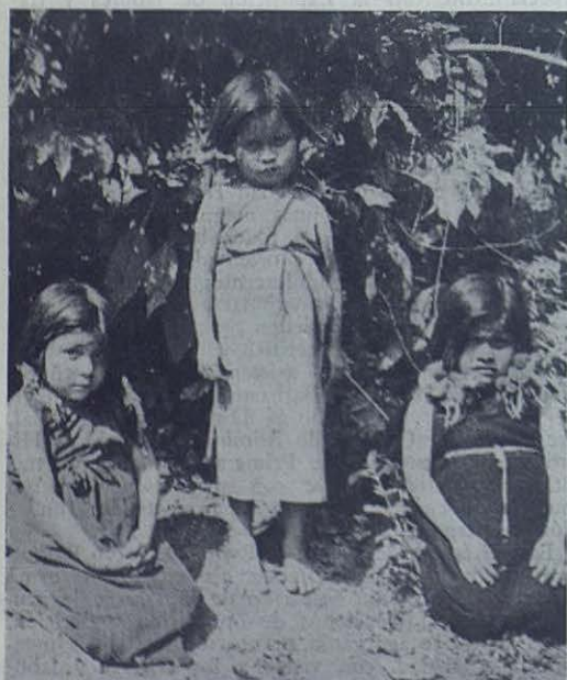
VICARIATO APOSTOLICO DE MENDEZ (ECUADOR).—Niñas jíbaras de la Misión Salesiana