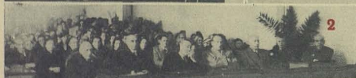
Escuelas profesionales de Huarte y Cía.-Pamplona