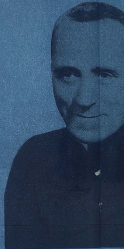
El Rvmo. don Renato Zigliotti, V. Bosco, Rector Mayor de la Congregación.

Las Escuelas Profesionales constituyen hoy día una de las más honradas preocupaciones de los Gobiernos y de cuantos tratan de la educación de la juventud. Muchos jóvenes se ven obligados a frecuentar las escuelas clásicas y técnicas, porque en muchos países no hay bastantes y buenas escuelas para la formación de obreros. Desde que el niño