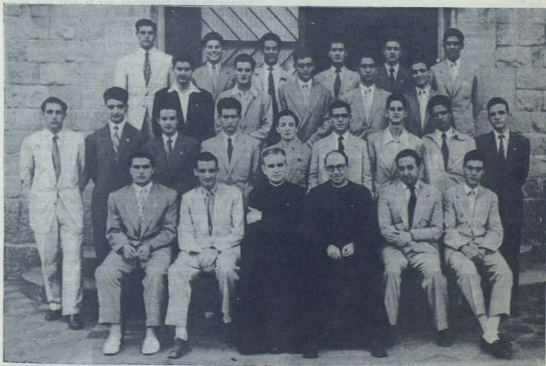
VALENCIA. — Jóvenes que, terminado su bachillerato, han constituido la Compañía de María Inmaculada

“La concebimos y la hemos desarrollado para una capacidad de cien alumnos, y consta, como veis, de esta nave en forma de “L” para las clases teóricas,