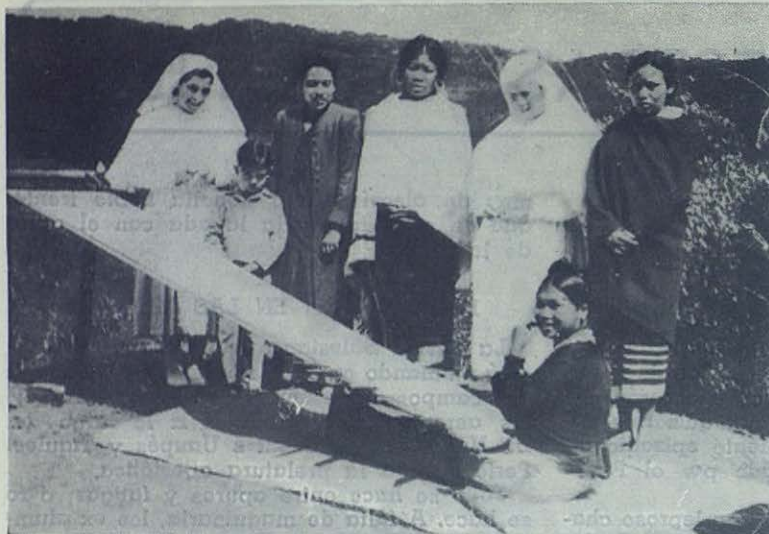
ASSAM (India). — Religiosas españolas, «Misioneras de Cristo Jesús», valiosas auxiliares de los misioneros salesianos en su apostolado entre las tribus Nagas. Estas pertenecen al hospital de Kohima