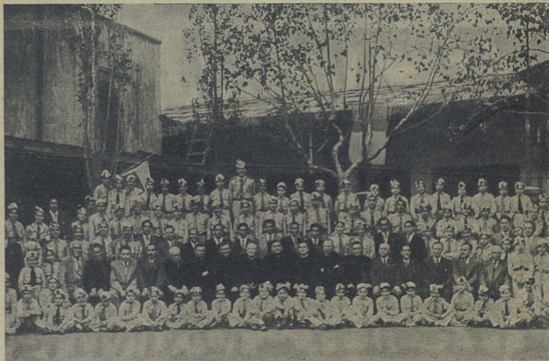
SANTIAGO DE CHILE.—Un grupo de Exploradores de Don Bosco del Oratorio Salesiano con los Superiores al centro y algunos de los principales Cooperadores