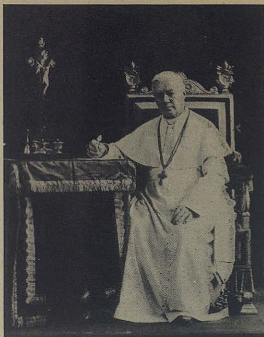
El Papa Pío X, el primer Cooperador Salesiano beatificado por la Iglesia

Mientras la lucha contra la nave de la Iglesia se está haciendo cada vez más amenazadora, dos Papas rinden tributo a la