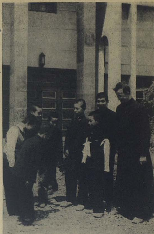
Niños japoneses recién bautizados reciben el parabién en los jardines de la Escuela Don Bosco, en Tokio

En este Círculo funcionan consultorios médico y odontológico, escuelas nocturnas para jóvenes obreros y clases de corte y confección para muchachas. Ha sido tal el éxito del nuevo Círculo, que se ha tenido que pensar y proceder a la construcción de un nuevo edificio para completar las instalaciones. Actualmente el Círculo reúne hasta mil obreros. Un grupo de señoras trabaja activamente en el ropero, siendo ya muy