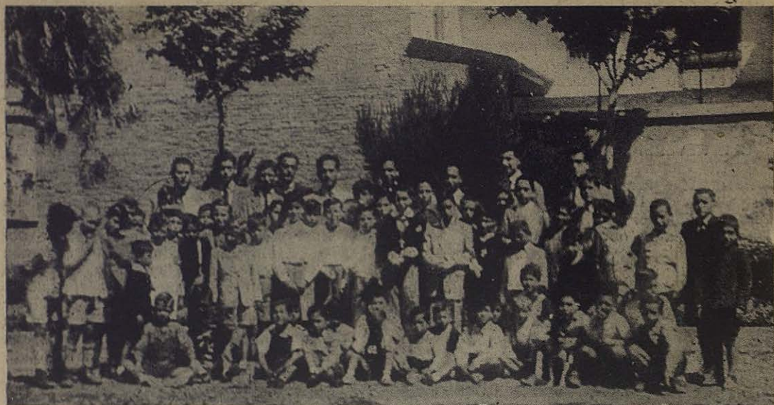
La sección universitaria de Antiguos Alumnos Salesianos de Valencia, lleva una floreciente categoría en la barriada de Ruzafa

señanza que todos los católicos deben conocer y defender». Como hay tanta ignorancia y tanta desorientación sobre este punto, y es un deber de todo católico instruir al ignorante y ejercitar los derechos fundamentales, este folleto del P. Guerrero debe difundirse largamente.