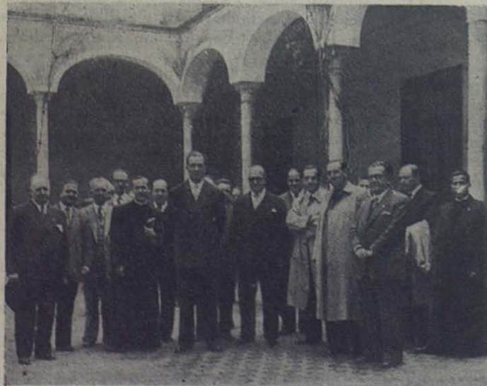
El Excmo. Sr. Ministro de Educación Nacional en el patio de las Escuelas Profesionales Salesianas de la Stma. Trinidad, de Sevilla

Las gracias obtenidas por su intercesión sean comunicadas sin dilaciones. Es un tesoro éste que hemos de presentar en su día, cual un capítulo más, a favor de nuestros Siervos de Dios.