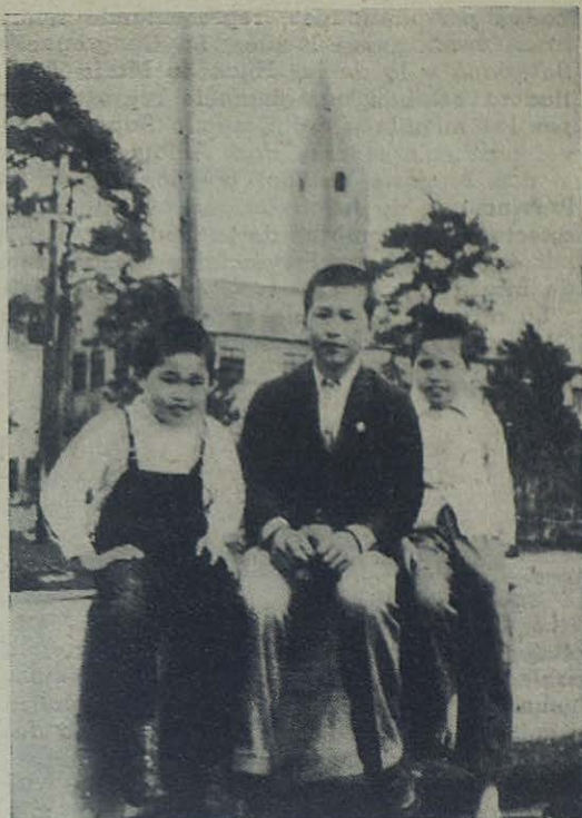
Tres simpáticos japositos que esperan con ansia la designación de nuevos misioneros salesianos para su país. ¿Cuántos serán? Todo depende del apoyo que nuestros superiores reciban de parte de los amigos de nuestras Misiones

Gracias sean dadas a Dios por este triunfo de la Eucaristía. Que El haya escuchado las oraciones allí vertidas por la paz del mundo. Que El siga cumpliendo su promesa de reinar en España con más veneración que en otras partes, y que, en fin, bendiga, proteja y guíe a nuestras cristianísimas autoridades, gracias a cuya fidelidad a la causa de Cristo ha podido celebrarse este Congreso en un marco de tanta paz, seguridad y respeto. Bendito sea el Señor por este triunfo: hace dieciséis años se tenía que distribuir la comunión en Barcelona en cajas de cerillas... y hoy podemos de nuevo pasear al Señor Sacramentado en la magnificencia de la custodia de Arfe, y posarlo sobre el trono de nuestros reyes.