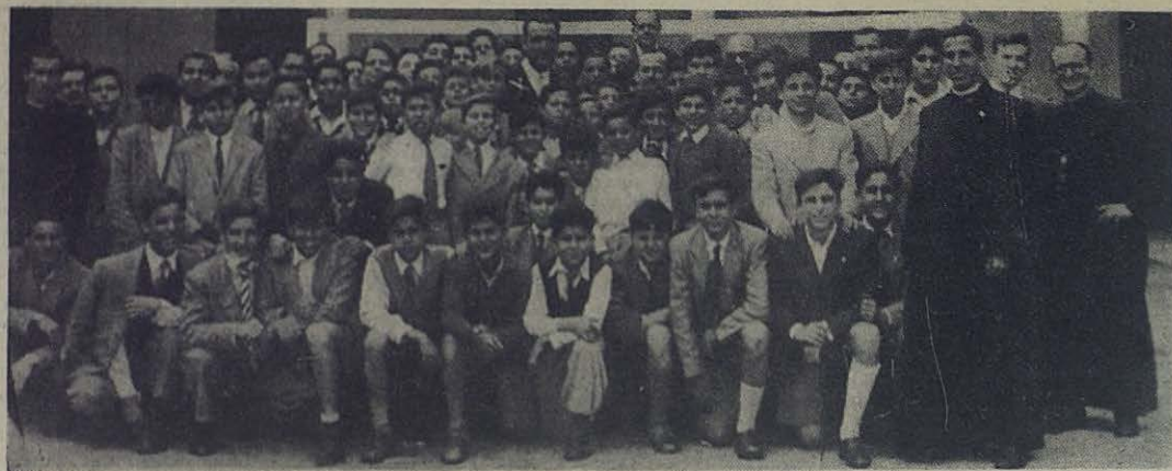
El Excmo. señor Ministro de Educación Nacional, Sr. Ruiz Jiménez, con un grupo de alumnos de las Escuelas Profesionales Salesianas de la Stma. Trinidad, de Sevilla, a los que visitó espontánea y familiarmente