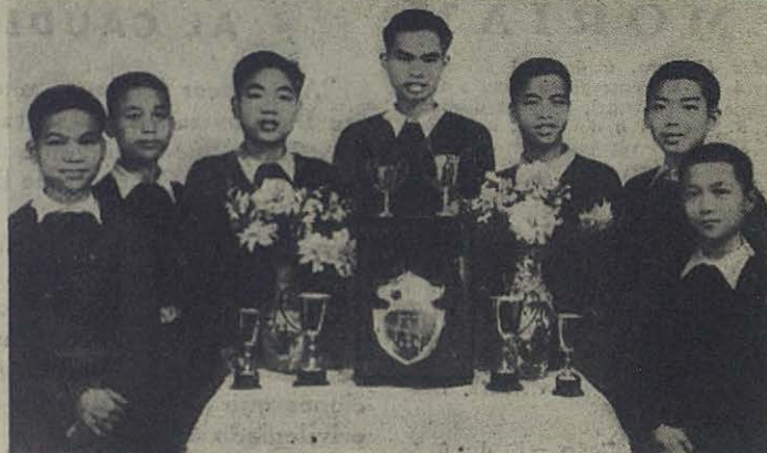
MACAO (China).—Estudiantes pertenecientes a los Colegios Salesianos de la ciudad que más se han distinguido en el estudio del Catecismo