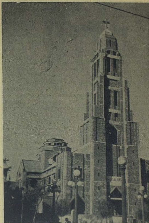
LA PAZ (Bolivia).—Exterior de la nueva iglesia en honor de María Auxiliadora, cuyo interior se inauguró con ocasión de su fiesta de mayo